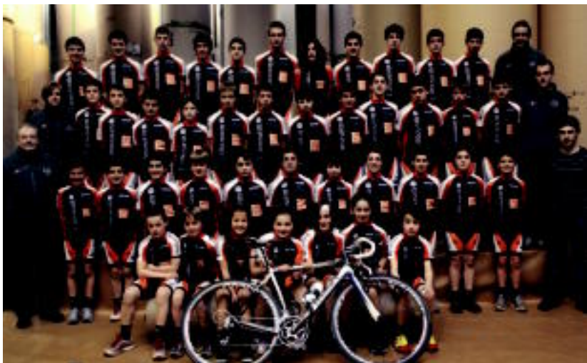
Oriako Txirrindulari Eskolako prestatzaileak eta txirrindulariak. HITZA

Ostirala, 2012ko apirilaren 13a. IX. urtea. 2.391. zenbakia. tolosaldea.hitza.info