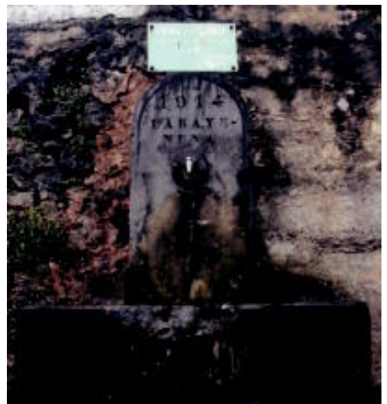
Goiatz auzoan dagoen 1914. urteko Erriko iturria . IT.

Gipuzkoako altuera handieneko herrigunea du Bidegoianek. Kokapenarengatik izan da, hain justu, garrantzitsua historian, Oria eta Urola bailarak batzen zituelako. Beizama, Errezil eta Aiarekin, Mendietako bost herrixkak izenez ezagutzen zen multzoa osatu zuen. Bost herrixka horiek Sayazeko Alkatetza Nagusiaren zati ziren, Aia, Laurgain, Urdaneta eta Albizturrekin.