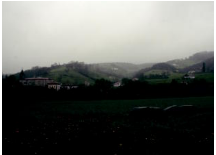
Bidegoiango Bidania auzoa, Tolosarantz edo Azpeitirantz doan errepidetik ikusita. IT.

Azpeitirako bidean bi aukera irekitzen diren puntura iritsiko da. Hau da, Urrakitik segi, edota Bidanitik barna Errezil igaroz. Bigarrena, eskuinekoa, aukera-