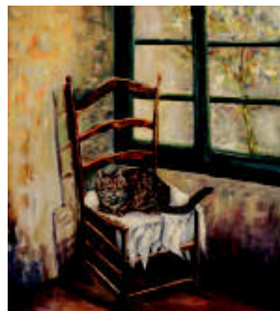
Paisaiak nagusi diren koadroak hilaren amaiera bitartean egongo dira ikusgai; hamabost koadro dira guztira, eta olioiz margotutakoak dira. E. MAIZ