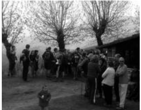
Igaratzako aterpetik pasatzen dira ibilaldiko parte hartzaileak.