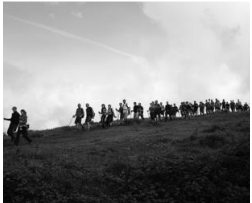
Duela 87 urte 14 mendizale izan ziren arren, gaur egun 3.100 baino gehiagok parte hartzen dute. HITZA