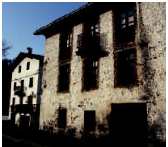
Eskola etxea eta eskola zaharra ikusiko dira ibilbidearen amaieran.