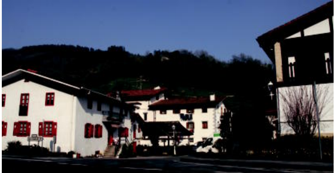
Amezketako Ugarte auzotik hasiko da ibilbidea. Bedaio Behekoan zegoen eskolara iritsi arte joan eta bertan buelta hartuko da.

Errepide laua bihurgune batzuek hautsiko dute, eta erreka eskuineko aldetik ikusiko dugu. Erreka gurutzatu ahal izateko eginiko egurrezko zubi zahar bat ere bada bidean. Toki lasaia da, eta trafiko gutxi izango du ibiltariak. Bedaiotarren joan etorriak izango dira gehienak. Hiru kilo-