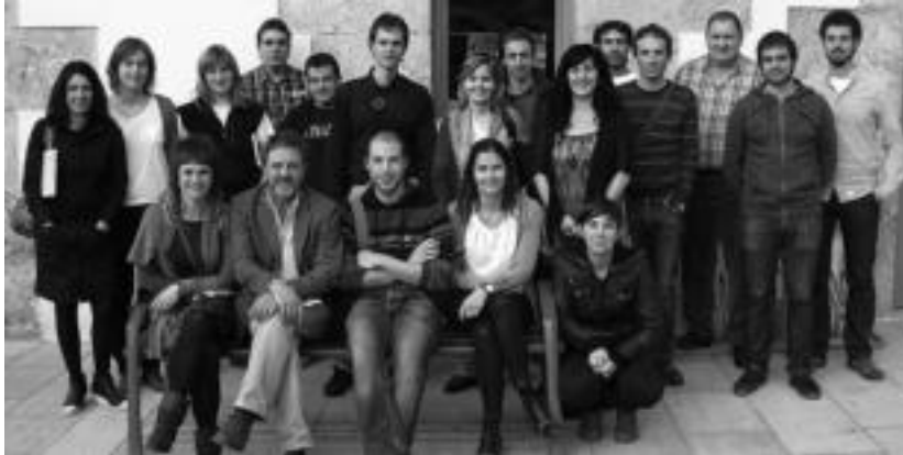
Bileran parte hartu zuten eskualdeko kideak Amezketan elkartu ziren.

Amezketan bildu dira eskualdeko alkate nahiz udal ordezkariak, Tolosaldea Garatzenek antolatutako foroan