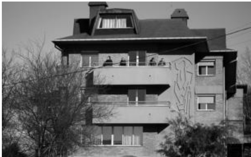
Asuncion klinika eskualdeko ospitale publiko egitea nahi du TOPAK. E. EZEIZA

Hau guztia kontuan izanda, Asuncion klinikaren publikazioa eskatu zuten mozioko lehen puntuan, eta gainerako eskualde-