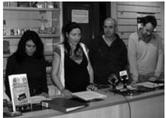
Atzo aurkeztu zuten ekimena Ibarrako arropa denda batean. I.T.