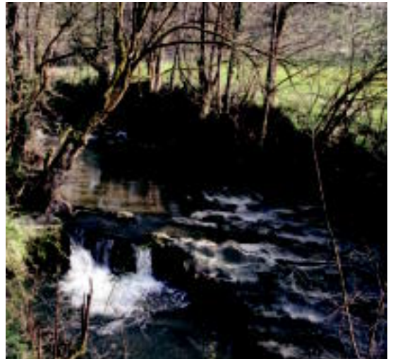
Bedaio erreka irudi politak ateratzeko aukera ematen du. E.MAIZ