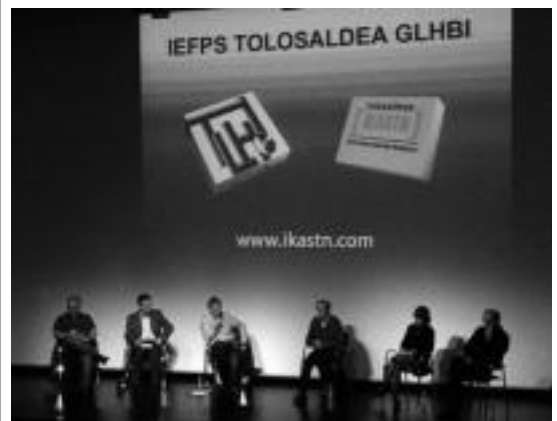
Mahai ingurua Leidor aretoan izan zen. HITZA

Tolosaldean Ikastn-eko antolatzaileek eskerrak eman nahi izan dizkio hizlariari eta herritarrei, mahai inguruan parte hartzeagatik.