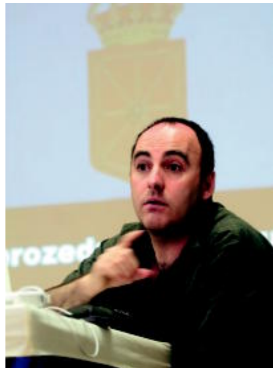
Floren Aozek Nafarroako konkistaren ondorioetaz hitz egingo du. INIGO URIZ