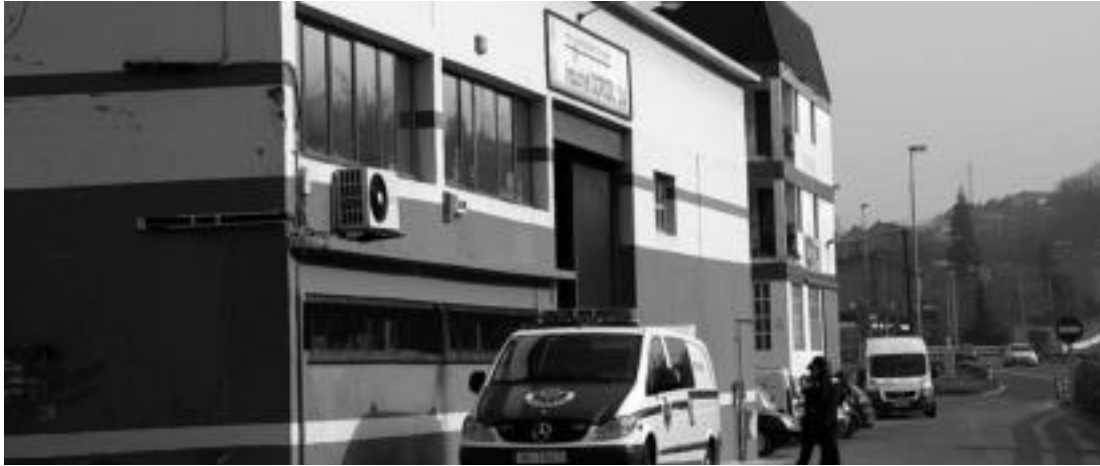
Istripua Villabonako Industrial Borobil lantegian gertatu zen, atzo goizean. I. URKIZU

Euskal gehiengo sindikalak, hainbat eragilek eta CCOO elkarrataratzeak egingo dituzte gaur eta bihar