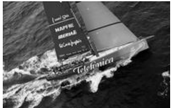
Erritmo onean ari da Telefonica ontzia Brasilera bidean. MARIA MUJINA

Telefonica ontziak geldialdia egin beharra izan du Chileko Herschel irlan konponketak egiteko, baina bertan galdutako denbora pixkanaka errekupeztatzen ari da. Atzo eguerdian, helmugara iristeko 1.300 milia geratzen zitzaizkielarik, liderrarengandik 240 miliako distantziara gerturatu ahal izan zuten. Etapa irabazteaz ez dute lan erraza izango, baina nabigatzaileek ez dutela itxaropenik galdu esan dute.