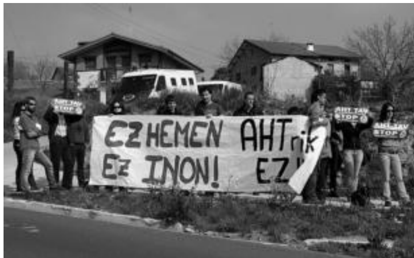
Aiztondoko AHTaren aurkako taldea bertaratu zen, aldarrikapenak egitera. I. URKIZU

Azkenik, krisiaren gaia ere gogora ekarri zuten, eta «AHTrako dirua bideratzeko, beste eremu batzuetan gutxitu beharra» dagoela salatu nahi izan zuten: «Inoiz baino arrazoi gehiago daude AHTari ezetz esateko».