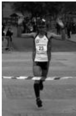
Larraulgo helmugako marra zeharkatzen Amilibia eta Ait Chao. E.S.

Eskualdeko lasterkari ugari parte hartu zuen, eta lan txukuna egin zuten.