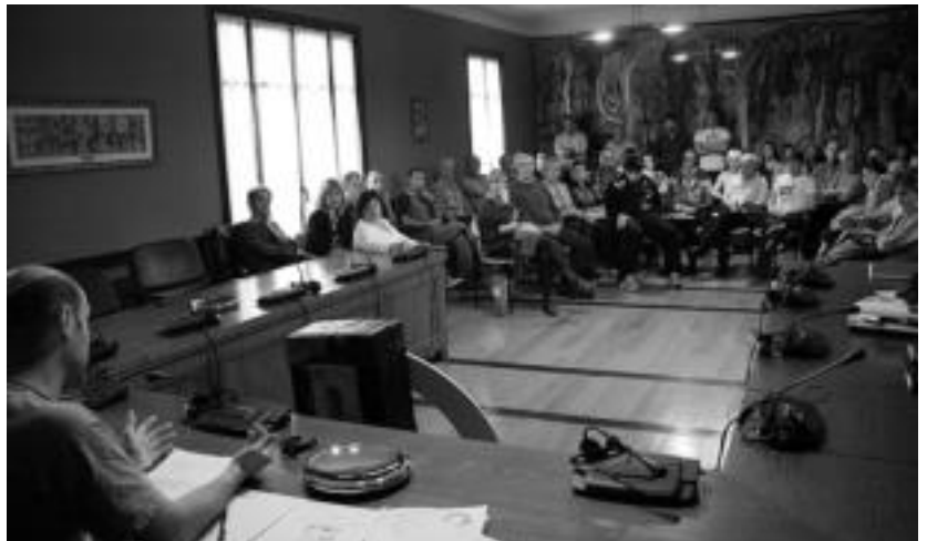
Ibarra udaletxeko batzar aretoan jende ugari elkartu zen astearte iluntzean. I.T.

Gaiak duen ikusminaren seinale, Ibarra udaletxeko batzar aretoa jendez beterik zegoen. Atez ateko gaikako bilketaren aurkako jarrera azaldu zuten askok, eta euren kezka jendaurrean adierazi zituzten. Halaber, Gipuzkoa Zero Zabor ekimeneko ki-deak ere baziren, ibararren zalantzak argitzera etorriak.