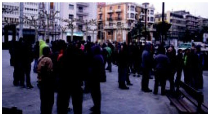
Alegiko Becker lantegian piketeek barrura sartu nahi izan zuten, lanean ari zirelako, baina ez zuten lortu. 07:30ean Trianguloan elkartu ziren Tolosako kaleak zeharkatzeko. E.M.