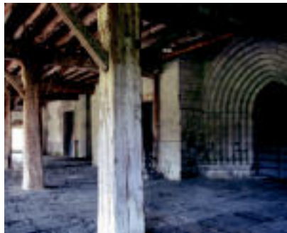
Tourseko Martin Deuna parrokiaren ataria eta Izotzalde auzoan dagoen iturria. I.G.L.