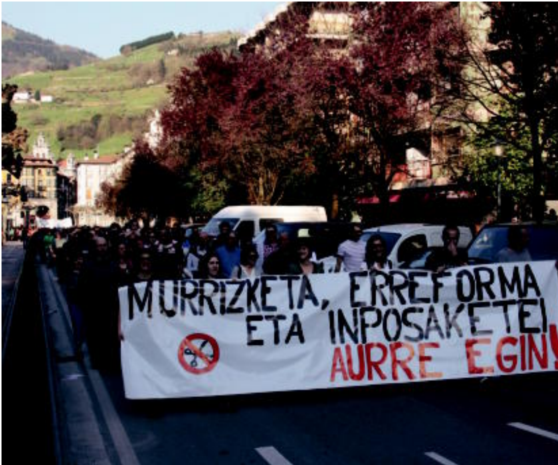
Atzo arratsaldean, sindikatuek eta eragileek deituta, eskualdeko manifestazio jendetsua egin zuten Tolosaldeko kaleetan, Trianguloatik abiatuta. i.g.L.

Ostirala, 2012ko martxoaren 30a. IX. urtea. 2.385. zenbakia. tolosaldea.hitza.info