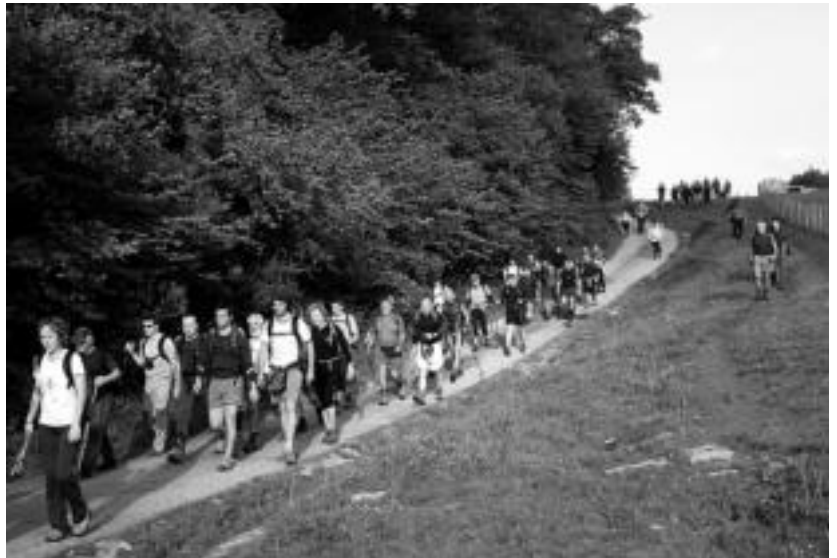
Askotariko ibilbidea da, eta ikuspegi zoragarriez gozatu ahal dute mendizaleek. HITZA

Antolatzaileek XIV orduko ibilaldia ez duela irabazlerik nabarmendu dute, «ez baita lasterketa, mendi txangoa baizik». Era berean, milaka lagun mendian ibiltzeak ingurugiroan eragina izan dezakeela ere azpimarratu dute, eta horregatik, mendizale guztiei mendiarekiko errespetua izan dezaten eskatzen diete.