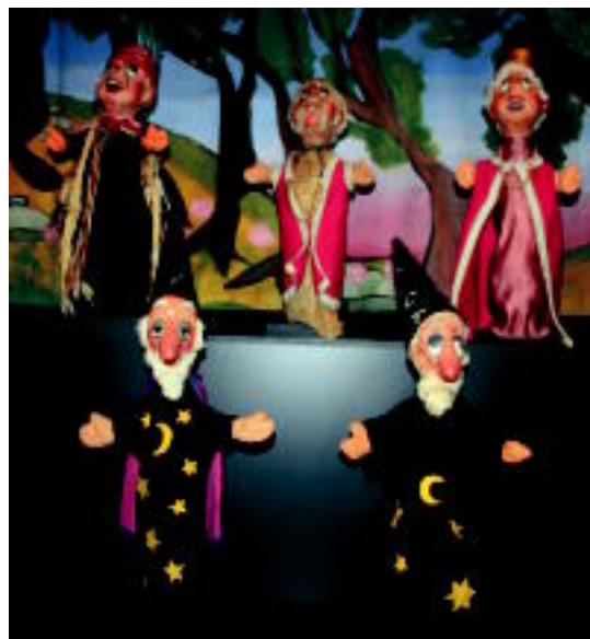
Iazko ospakizun egunean, Colorin eta bere lagunak erakusketa jarri zuten. HITZA

Jai eguna gauean bukatuko dute; 22:00etatik aurrera festa bat egingo du UNIMAK, Txotxongiloaren Nazioarteko Batasunak, Topic etxeko tabernan.