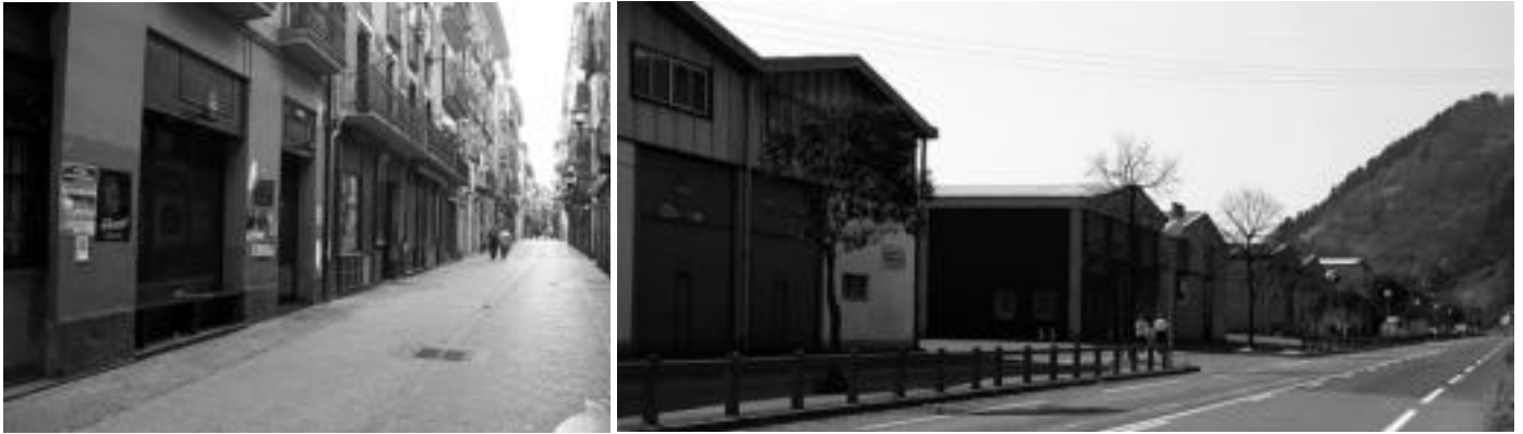
Tolosako kaleak hutsik geratu ziren; dena itxita egon zen. LURKIZU