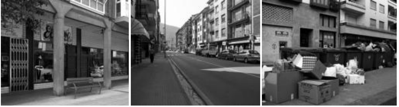
Ibarra eta Amasa-Villabonako saltokiek ez zituzten beraien ateak ireki; auto gutxi eta jendeak paseorako edo kirola egiteko probestu zuen eguna. Hondakinak ez zituzten bildu, atzo.E.M.