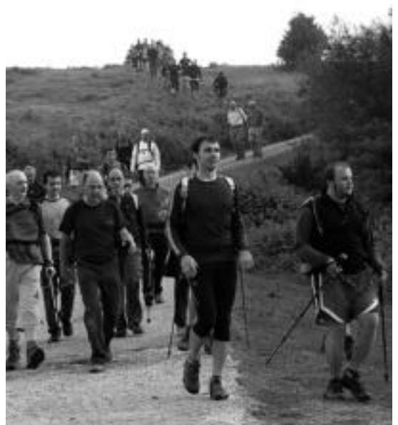
Milaka parte hartzaile izango dira aurten ere. HITZA