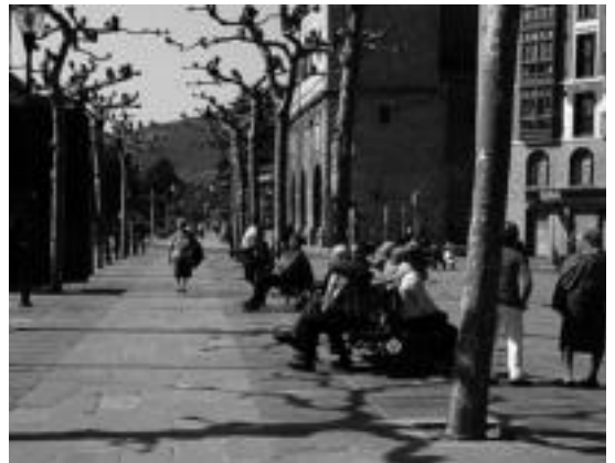
Kaleetako aulki eta parkeak izan ziren jendez bete zirenak.

Tere eta bere koadrila aspaldian hartu zuten erretiroa, baina arrazoi ugari ikusten dituzte grebarekin bat egiteko. «Ez da gauza handirik lortuko, baina behintzat zure desadostasuna adierazten duzu», azaldu dute. Izan ere, «urte askotan lortu duguna uste batean kendu digute». Horrek lehengora itzultzea esan nahi duela uste dute, eta horregatik beste garai batean lan egin izana eskertzen dute. «Gazteentzat, oso etorkizun zaila nabari dugu».