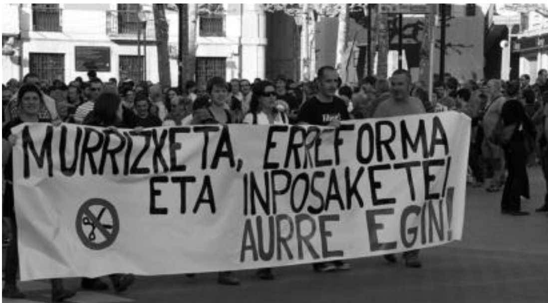
Arratsaldean Leitzan eta Tolosan egin zituzten eskualde mailako manifestazioak. Biak ala biak jendetsuak izan ziren. Irudian, Tolosakoa.