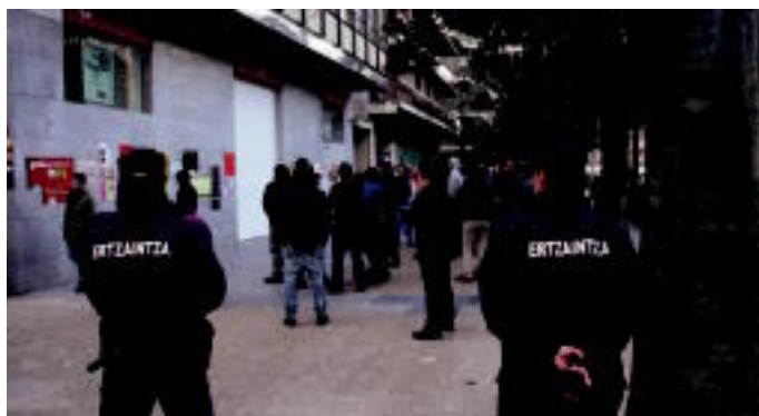
100 lagun inguruz osaturiko taldea aritu zen lantegietatik eta dendetatik igarotzen. Santander bankuaren parean geratu ziren piketeak, bertan lanean ari zirenen susmopean. I.T.