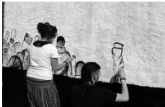
Murala margotzen aritu ziren gazteak irudian. I. GARCIA LANDA

Sindikatuaren aldarrikapen eta deialdiez gain, ordea, Leitzaldeko Bilgune Feministak emakumei zuzendutako deialdia egin zuen aurreko mantalak balkoietatik zintzilika jartzea proposatu zuten: «Etxe hau greban dagoenaren adierazle izateko egin dugu deialdia, eta emakumeok ere greban, kalean, gure eskubideen alde borrokan ariko gara». Bide beretik, Leitzan antolatutako mo-