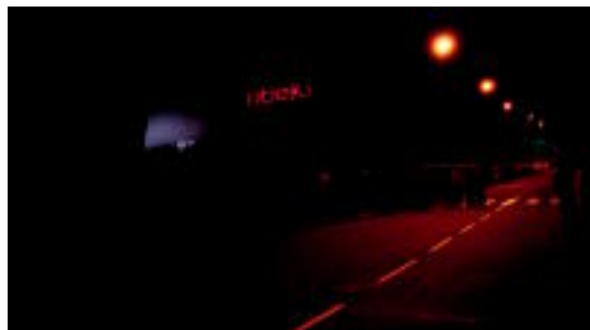
Lehen geldialdia Apatta Erreka Industrigunean egin zuten. I.T.