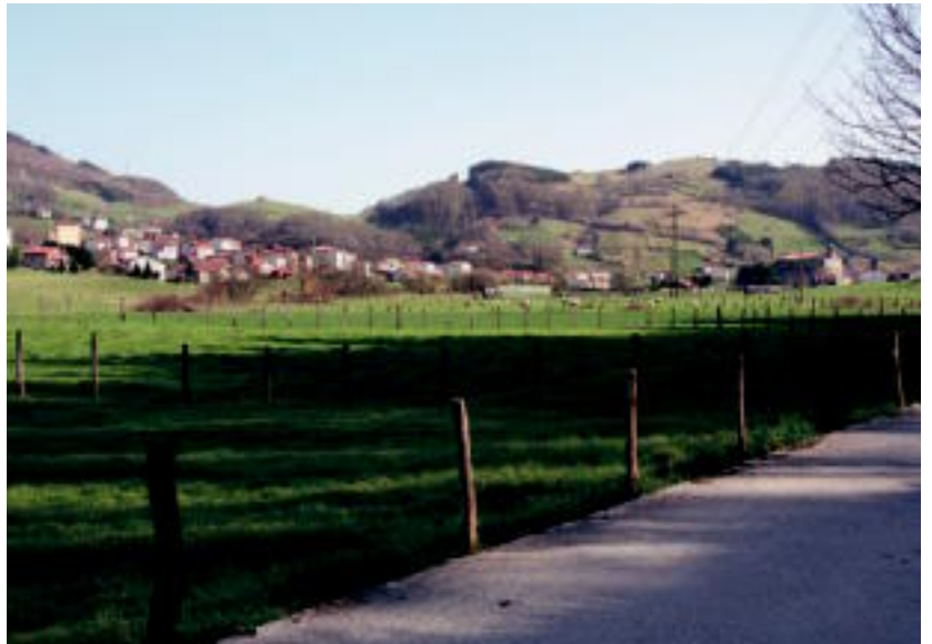
Ibiltarien begiek urrutira begiratzeko aukera dute, Berastegi zeharkatzerakoan. I.G.L.

Parrokiaren parera iritsita, ezkerreko bidea hartu behar da, Aiztunalde auzo aldera. Elizaren atzeko iturriak geldialdixoa egiteko aukera ematen du. Bidean