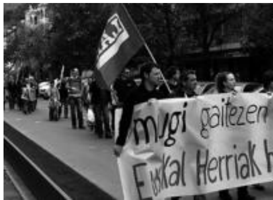
Lan erreformaren aurka giza katea egin zuten.

Kexu dira sindikatuek Eusko Jaurlaritzak ezartzen dituen zer-