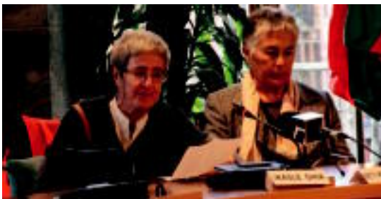
Bi ikaslek beren esperientziaren berri eman zuten, agerraldian. I. URKIZU

Orain arte Mugabek kudeatu du belaunaldien arteko lankidetzeta sustatzeko egitasmoa; 'Etxean Ondo' ere jarriko dute martxan 05