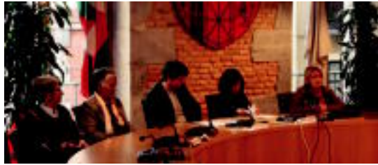
Herenegun aurkeztu zuten Esperientzia eskolako ikasturte berria. I. URKIZU

Ikasturte berria aurkeztearekin batera, eskola biziberritu nahi dutela azaldu zuen Mugabe elkarte arduradunak: «Jendea aktibo egotea nahi dugu, lehenengo ikasleak ikasle berriekin nahastuz». Mugabek kudeatuko duen azken ikasturtea izango da aurkeztu berri dutena, izan ere, Tolosako Beti Ikasten elkartearen ardura izango da aurrerantzean, esperientzia eskola.