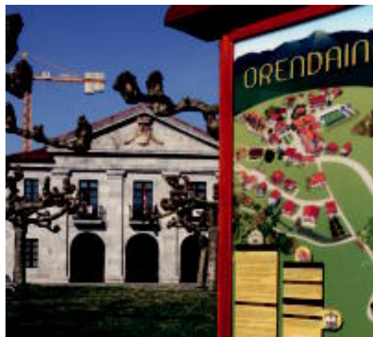
Orendaingo udaletxeak, zelai ederra du aurrean jolasteko. E. MAIZ