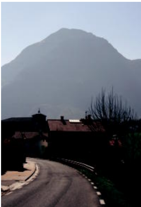
Abaltzisketa herriaren sarrera Orendain aldetik etorrita. E. MAIZ