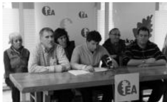
Eusko Alkartasuneko kideak, agerraldian.

Era berean, «gehiegizko etxebizitzak» nahiz lurperatzearen aurka azaldu dute euren burua: «Eusko Alkartasunak beti aurka-