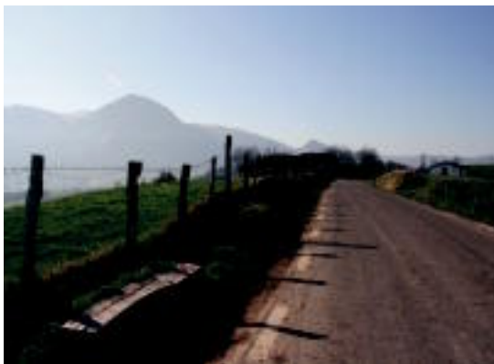
Ibilbidearen erdian, eserita, paisaia eta atsedenez gozatu daiteke. E. MAIZ