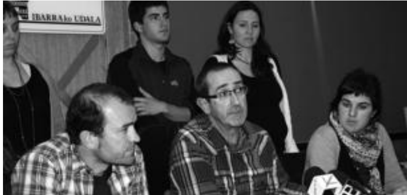
Pasa den urteko jaietan bezala, aurten ere sagardo dastaketa egingo dute Berastegin. M. UGARTEMENDIA

Peñagarikanok dioenez, «azken kontratua berritzean, 2009an, udaletxean beste zeregin batzuk ere eman zitzaizkion arkitektoari, eta oporren aipamena ere egiten zen kontratuan». 2010. urtean, arkitekto postua lehiaketa bi-