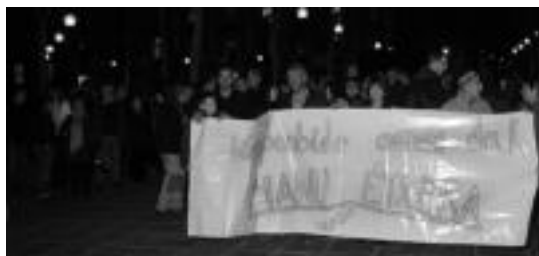
Trianguloa plazan ehun lagun inguru bildu ziren. I. GARCIALANDA

Honen harira, Trianguloan egindako elkarretaratzean, Espainiako eta Frantziako gober-