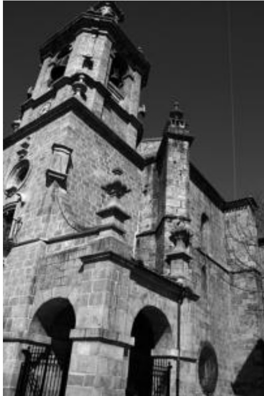
Ibarrako San Bartolome elizaren teiltatua konpondu dute.

Gotzaindegia kopuru horren %10 ordaintzeko konpromisoa hartu du. Ibarrako parrokiaren batzarrak azaldu duenez, «gisa horretako obrak egiteko Gipuzkoako Foru Aldundiak aurrekontuen %50eko laguntza eman izan du orain arte, baina aurtun, krisi ekonomikoa argudiatuta, ez du inolako laguntzarik emango».