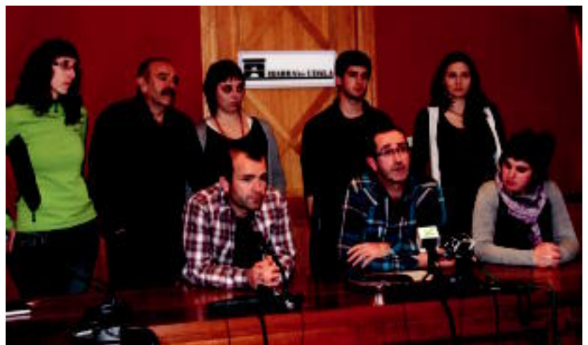
Ibarrako alkatea (erdian) eta zinegotziak, batzar aretoan, azalpenak ematen.