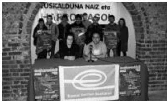
Villabonako aljibearen aurrean egin dute agerraldia EHEko kideek. IGL

Bide luzea dagoela egiteko esan dute EHEkoek: «(Zan ere, geuri dagokigu euskaraz bizitzeko bidea egitea; auzolanetik, bakoitzak bere horretan eta guztioz batera, bidea egin eta aldaketak eragin ditzakegu». Euskaraz bizitzeko hautua egitea eta euskarari lehentasuna ematea norbanatik hasi behar dela diote. «Guk emateaz gain, lehentasunezko estatusa behar du euskarak bere lurralde osoan. Horretarako behar