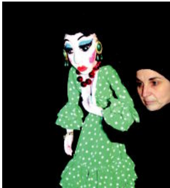
Luminando la noche ikuskizuneko parrupina. HITZA

Azkenik, ostiraleko jarduerekin amaitzeko, The Back Tracks