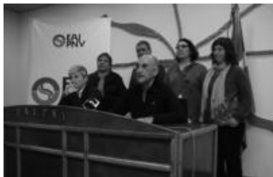
Tolosako EAJko kideek agerraldia egin zuten, atzo, Batzokian. I.G.L

tzat, 210 euro. Lau arrazatako elkarteek antolatu dute enkantea, Tolosako Udalaren eta Gipuzkoako Foru Aldundiaren laguntzarekin.