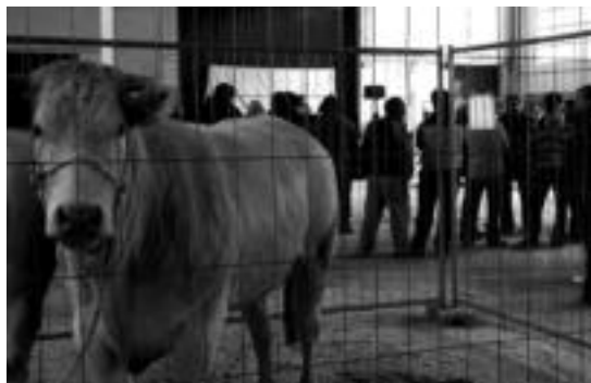
Tolosako ferialekuan egindako biga enkante bateko irudia.

Diru laguntzei dagokionez, frisoari arrazakoentzat 210 euro izan-