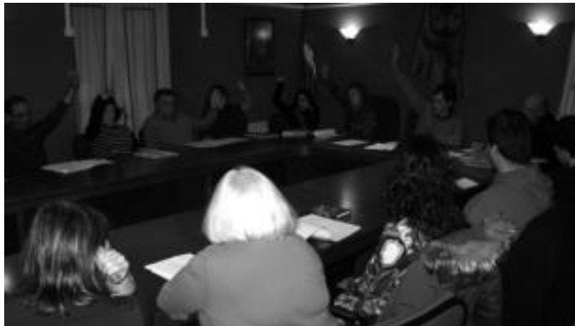
Bilduko zinegotziak atez atekoari aldeko bozka ematen, herenegun eguniko osoko bilkuran. IT.

Herenegun eguniko osoko bilkuran onartutakoaren arabera, Villabonako Udalak «ahalik eta gehien birziklatze aldera», emaitza onenak lortzen dituen hiri hondakinen bilketaren alde egiteko konpromisoa hartu du. Udalaren esanetan, «%80ko birziklatze maila lortzen ari den sistema bakarra atez ateko bilketa da», beraz, sistema honen aldeko apustua egin du. Era berean, udalak ahalik eta hondakin gutxien sortzeko azterketa abiatuko du, eta konpostatze kanpaina zabala egin asmo du herriko familien ar-