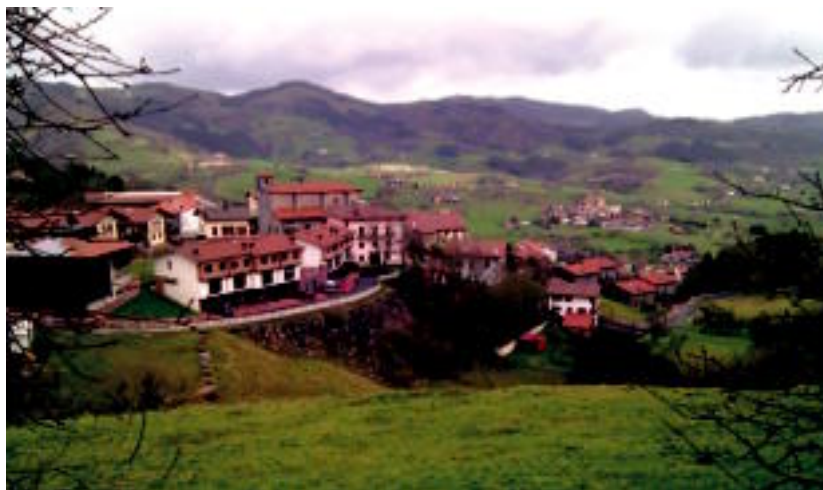
Larraulgo herrigunea, urrunean, aldiz, Asteasuko Elizmendi auzoa ikusten da. A. IMAZ

Kaxka beltzaren kontu jario korapilatsua entzuten da maldaren azken zatian, eta honek sagarondoan edo intxaurrendoen berrit ematen du. Ondorioz, baserriren bat ere ez da urrun izango. Zalantza maldaren amaieran argitzen da: Murgil jartzen du egurrezko geziak atzera begiratuz. Ibilbidea jarraitzeko, Larraul jartzen duen bidea hartu behar da,