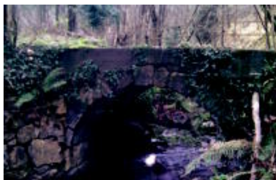
Egur-olako zubitoxoa zeharkatu behar da.

Ibilbidearekin aurrera jarraituz, Asteasura errepidetik jaitsi daiteke, Zilar kaletik sartuz eta Kale Berria zeharkatuz, autobus geltokira iristeko. Hemendik Villabona-Zizurkilera joan daiteke autobusez, bertan tren hartu eta itzulerako bideari egina dago. Autobusa hartu aurretik, ordea, Asteasu ezagutzea ezinbestekoa da, bere auzo eta guzti.