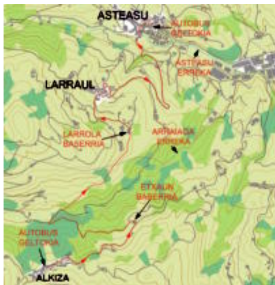
Alkiza, Larraul eta Asteasu lotzen dituen ibilbidearen planoak. HITZA