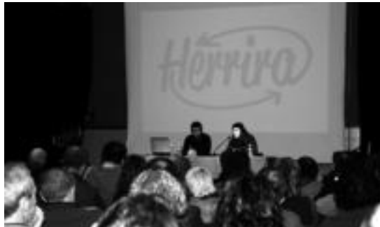
Pertsona asko elkartu zen aurkezpenean, asteazkenean. E. MAIZ

Gogora ekarri zuten urteetan, hau da, euskal preso eta iheslariak dauden momentutik beraien eskubideen aldeko «lan emankor eta oparoa» beti egon dela Euskal Herrian. Urte guzti horietan, «norbanako, elkarte edo mugimenduek» egin dute lan. Herrira ekimena lan hori ordezkatzera ez datorrela nabarmendu zuten. Azken bi urteetan, aukera berriak ireki dira, eta egoera politikoak ekarri duen testuinguru berrian sortu da mugimendua.