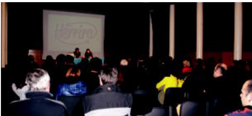
Jende ugari gerturatu zen herenegun, kultur etxeko areto nagusira.

Emakumearen Nazioarteko Egunaren harira hainbat ekitaldi antolatatu dituzte; Mulamboren brasildar festa ere izango da bihar o4