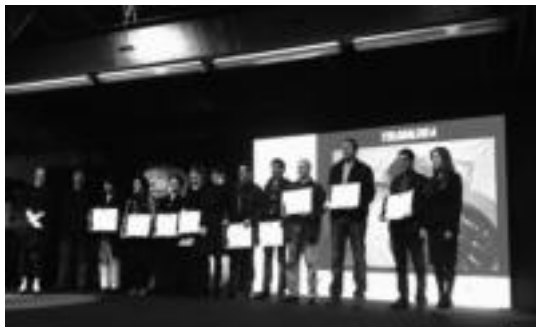
Samaniegoko Baigorri upategian jaso zituzten ziurtagiriak. HITZA

Informazio gehiago eskatzeko edo izena emateko Tolosaldea Garatzeneko enpresa sailarekin kontaktatu behar da, 943 654 501 telefono zenbakian, edota mezuek elektronikoz enpresa@tolosaldea.net helbidean.