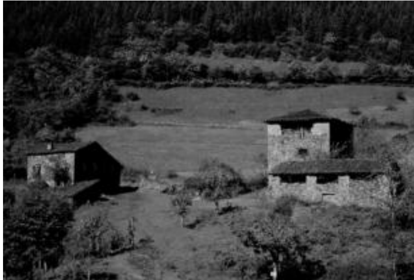
Iberoko lur sailako baserria eta dorrea, 80. hamarkadan. ALKE

Horrela, jabez aldatuz joan ziren Iberoko lurrak, 1892. urtean Leitzako Suteen Aurkako elkar-tearenak izatera pasa ziren arte. Baserritar ugari eta udala bera ziren elkar-tearen bazkide. Euren helburua istripu eta suteen aurre-