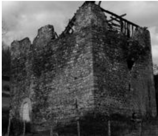
Iberoko dorrearen egungo egoera. J.M. BARRIOLA

an elkarri babes eman eta laguntzea izaten zen.