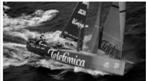
Telefonica ontzia, Zeelanda Berrirako bidean, atzo.

Auckland (Zeelanda Berria) da Volvo Ocean Race probaren laugarren etapako azken portua, eta milia gutxi geratzen zaizkie nabi-