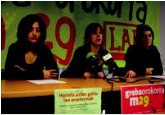
LAB sindikatuko ordezkariek, ezkerreko irudian, eta ELA sindikatuko ordezkariek, eskuineko irudian, lan erreformari buruzko agerraldietan. GOIERRIKOHITZA