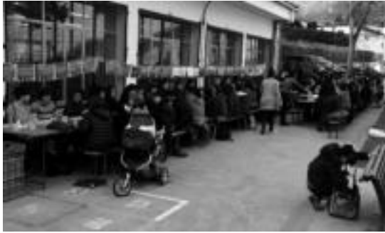
V. Topaketa Femisitek ia 600 lagun elkartu zituzten, Leitzan. A. IMAZ

Emakumeak protagonista dituen Aurrez Aurre ekimena etzi inauguratuko dute, Aranburu Jauregian, 19:00etan