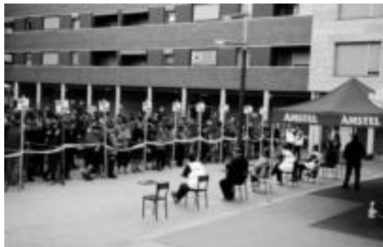
Aizkardiren Mendi Ibilaldia martxoan izango da. HITZA

Villabonako Aizkardi mendi taldeak 44. Mendi Ibilaldia antolatu du hilaren 25ean, igandean. Hamalau orduak egiteko asmoa duten mendizaleek, indarrak neurtzeko aukera polita izango dute beraz hila-beteko azken igandean horretan. Horretarako, ordea, aurrez izena eman beharra dago, eta Aizkarditik bi bide zabaldu dituzte: www.zirkuitua.com webgunea edo 649 71 71 82 telefono zenbakia. Azken honetara, 20:00etatik 22:00ak bitartean deitu behar da, eta astelehenetik ostirala bitartean.