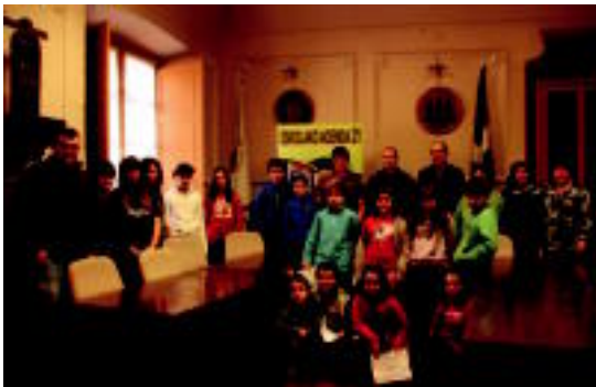
San Juan eskolako eta udaleko ordezkariak, udaletxeko batzar aretoan. E.M.

Alegiako ikastetxeak eta udalak hitzarmena sinatu dute; gazteak etorkizuneko eredia direnez, konpromisoa hartzea da helburua ◦2