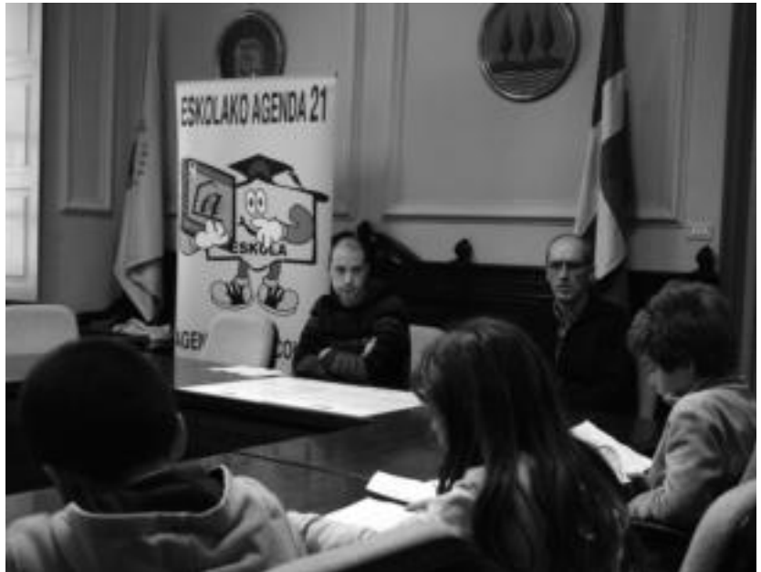
Ikasleek alkateari beren proposamen eta konpromisoak luzatu dizkiete. ENERTIZ MAIZ

KULTURA SAILAK DIRUZ LAGUNDUTAKO HEDABIDEA