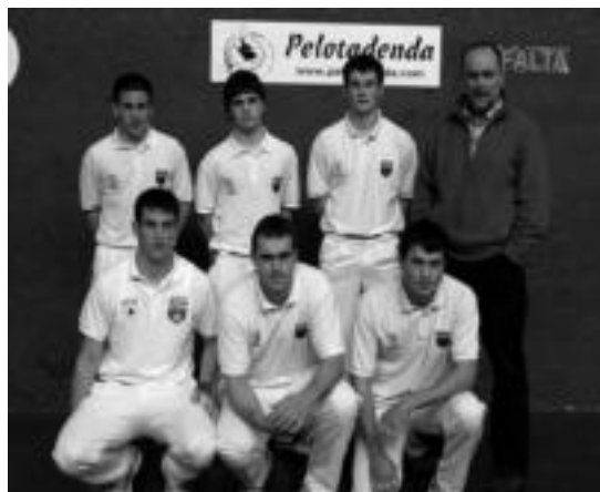
Aurrera Saiazeko pilotariak, IX. Berria Txapelketan. HITZA

IX. Berria Txapelketan Aurrera Saiazek finalerdietarako txartela lortu du, Huarte kanpoan utzita