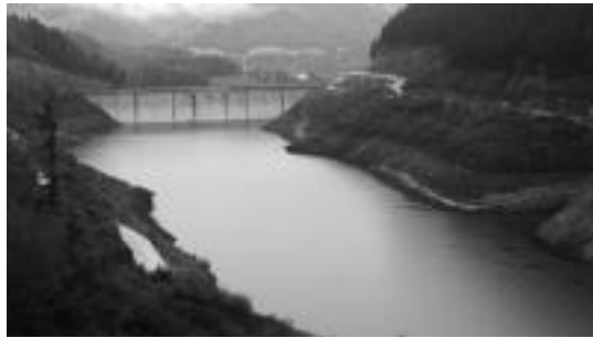
2011ko urriaren 19an zuen itxura: %22,65a zegoen beteta. E.MAIZ

Tolosaldeko 52.105 bizilaguni ematen dio ura Ibiurrek, eta Andoain herria ere sartzen da. 7.575.197 metro kubikoko edukie-