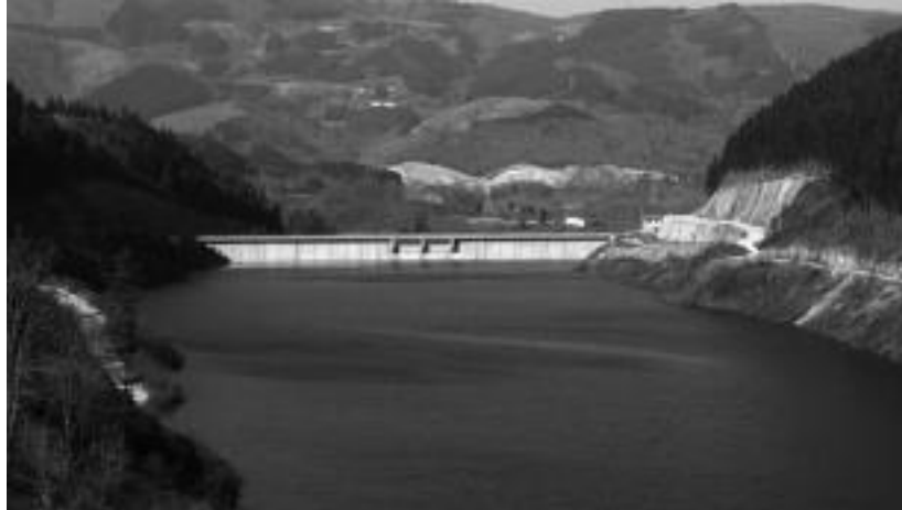
Ibiur urtegia, atzo, bere edukieraren %68,51an zegoen beteta.

2011ko urrian, Ibiur urtegia bere edukieraren %22,65an zegoen beteta, eta egoerak horrela jarraitzen bazuen, hiru hilabeteetarako baino ez zegoen ura. Hilabete gutxiren buruan, egoera erabat aldatu da, eta orain artean, inoiz