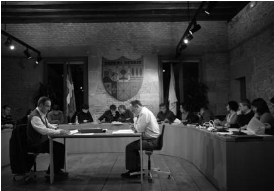
Guztira, sei mozio eztabaidatu zituzten zinegotziek, pasa den astearteko ohiko osoko bilkuran. I. URKIZU