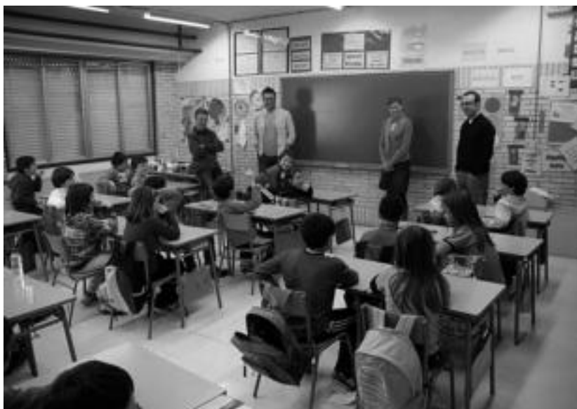
Cardiffetik etorritako irakasleek bisitak egin zituzten, atzo, ikastetxetara. Goiko irudian, Orixe institutuan, frantses ikasgaiaren saio batean. Beheko irudian, Laskorain ikastolako ingeles ikasgaiko saio batean.

horretatik, eta baita ikasteko zuek nola erakusten duzuen hemen euskara».