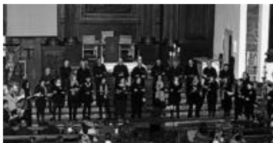
Txintxarri abesbatzaren kontzertua 20:00etan hasiko da. E.ARRAYET

Hamar bat kantu abestuko ditu Txintxarri abesbatzak Garbiñe Orbegozoren zuzendaritzapean. Mariaje Rekondo herritarrek pianoarekin lagunduko die.