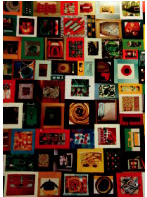
Artista tolosarrak collage teknika erabiltzen du bere lanetan.