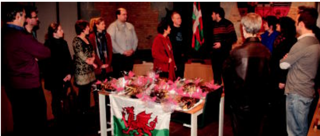
Cardiffko eta Tolosako Udaleko ordezkariak herenegun, udaletxeko batzar aretoan eginiko harreran.

Tomos Rees irakasle galesak «hizkuntzarekiko maitasuna sustatzerakoan» Euskal Herria eredu bezala duela adierazi du 03