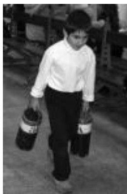
Tolosan, Gabonetan, txingekin. A.I.

Etxeko txikiak gozamenarako, Kiliklon txokoa izango da asteburuan, etzi eta igandean, Leitzako pilotalekuan. Puzgarriak, jolasak, musika, ikuskizunak, tailerrak... denetarik izango da, gurasoek eta gaztetxoek aspertzeko betarik izan ez dezaten.