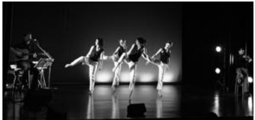
Nora ikuskizunaren aurreko emanaldi bateko irudia.