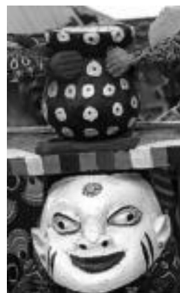
Beningo maskara bat. HITZA

Nigeriako eta Beningo (Afrika) maskara berezi batzuen bilduma pribatua da. Maskarek gainera papnira artikulatuak dituzte, eta zenbait zeremoniatan erabiltzen dituzte.