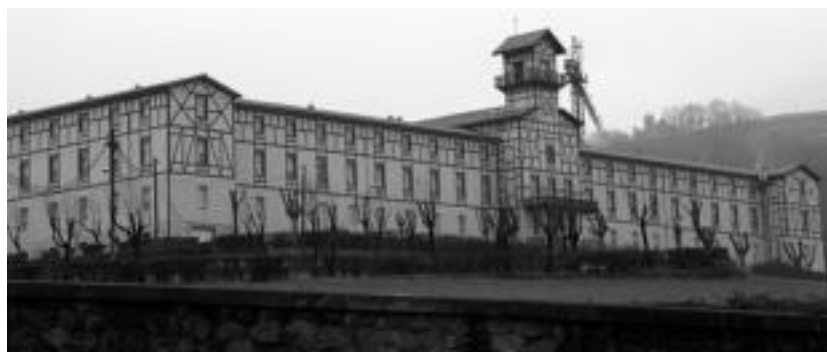
Iurreamendi egoitza izen bereko muinoan dago. E. EZEIZA

POLITIKA › Tolosako ezker abertzaleak batzarra egingo du, bihar, osteguna, 20:00etan, udaletxeko batzar aretoan. Ber- tan, egungo egoera politikoa eta 2012rako ildo politikoa azaldu eta eztabaidatuko dira.