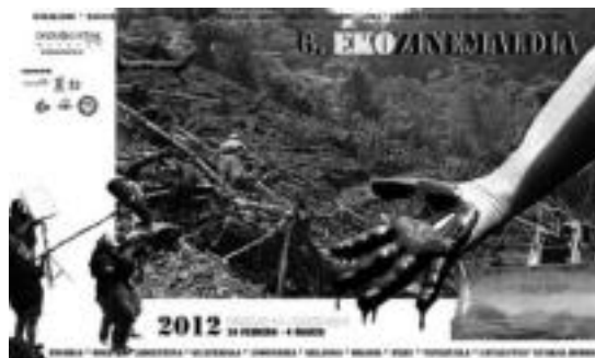
Aurtengo Ekozinemaldiaren kartela. HITZA

Bilduk errauskailurik ez duela nahi esan du, «ez Tolosan, ez Zubietan, ez beste inon ere». Koalizioak azaldu duenez, «pertsontzat eta ingurumenarentzat kaltegarriak izateaz gain, mugatuak diren lehengaien kudeaketa arduragabea dakarte, 'erabili eta bota' erueda, etorkizun eraginkorrerako eta arduratsugar baten aurkakoa dena». Tolosako Bilduk, azkenik, esan du «sinesmen osoa» duela herritarrengan eta pertsonengan, eta «konfiantza osoa» du, «gaurtik hasita, tolosarrok ere hobeto egingo dugula orain arte nahikoa izan ez dena».