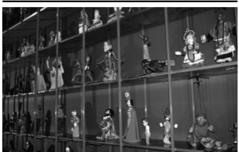
Topic zentrorra sarrera doan izango dute laguneren klubeko txartela eskuratzen dutenek. I. LURKIZU