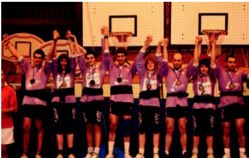
Munduko txapelketa irabazi duen Ibarako talde mistoa, podiumean. HITZA

Asteartea, 2012ko otsailaren 28a. IX. urtea. 2.369. zenbakia. tolosaldea.hitza.info