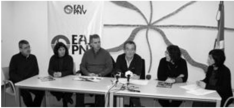
Tolosako EAJren sei zinegotzik eman dute prentsaurrekoa. I. GARCIA