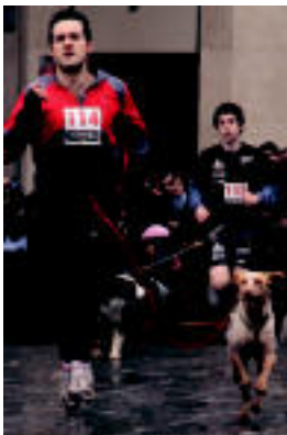
Herri lasterketako hainbat irudi. R.C.