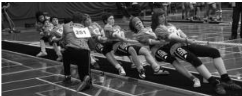
Ibarra 26 tiratzaileekin joan zen Eskoziara, pisu desberdinetan parte hartzeko asmoz. HITZA