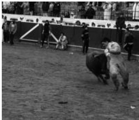
Pattar zezenean korrikaldi politak ikusi ziren atzokoan. Gaupasaz zeudenak eta egunari hasiera eman ziotenak elkartu ziren zezen plazan, jai giroan. A. IMAZ