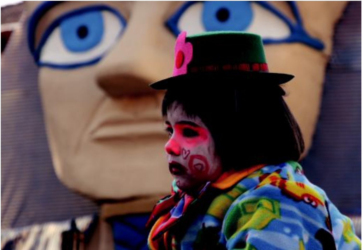
Atzo ere jendez bete ziren kaleak, batez ere, San Frantzisko pasealekua, eta mozorro eta karroza asko ikusi ahal izan ziren egun osoan zehar. I. TERRADILLOS

Asteazkena, 2012ko otsailaren 22a. IX. urtea. 2.367. zenbakia. tolosaldea.hitza.info