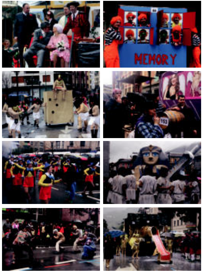
Tamaina, estilo eta kolore guztiakako karroza eta konpartak ikusteko aukera izan zen; aterkien artean ikusi behar izan ziren aurtengorako prestatuko ikuskizunak. E. MAIZ / E. MAIZ