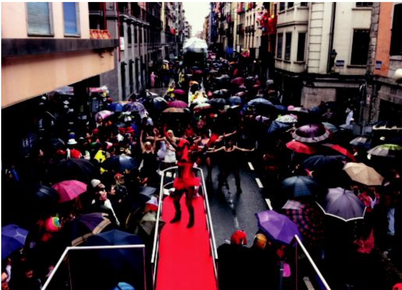
Euriak jaiarekin bat egin zuen atzokoan, hala eta guztiz ere, kaleak jendez bete ziren. Irudian 'Vasconia Secret'-en desfilea. I.TERRADILLOS

Astelehena, 2012ko otsailaren 20a. IX. urtea. 2.365. zenbakia. tolosaldea.hitza.info