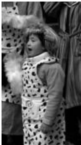
Haurrak ere inauterizale. I. URKIZU

Bi festa egun aurretik ditu oraindik Tolosak, eta urte osoko sormenaz gozatzeko garaia da.