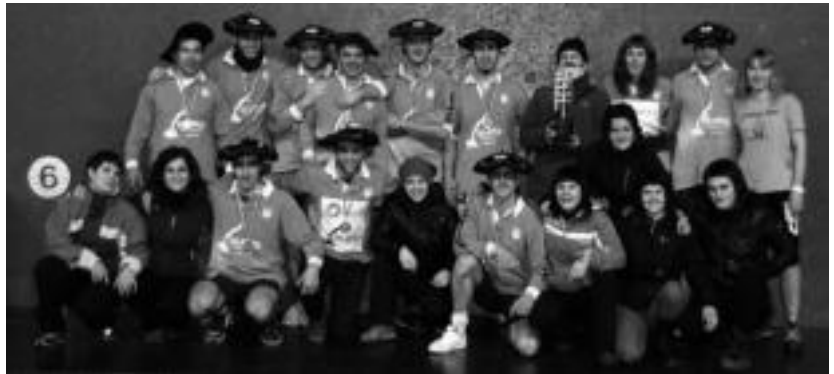
Ibarra sokatira taldeko gizon eta emakumeak Durangon, 640 kilotan lortutako txapela ospatzen.

Munduko txapelketa bat jokatzeko aukerak, bere gastuak ere izaten ditun. Sokatiratik ez direnez bizi, bidaia eta egonaldia finantzatzeko, ibartarrek ate ugari jo behar izan dituzte. Eskoziako txapelketara joateko, urte guztian zehar aritu dira dirua biltzen: txosnak jarriz edo poltsikotik ordainduz. Ibarrak udalaren eta Kirolgiren ekarpena ere izan dutela diote taldeko arduradunek.