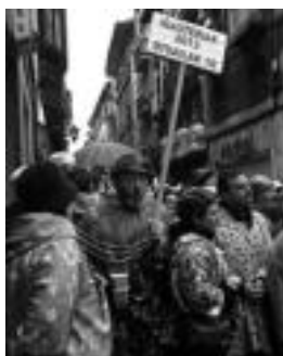
Bakoitzak bere inauteria bizi du. I.U.