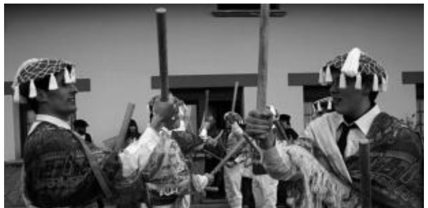
Dotore jantzita, umorez eskaini zizkietan dantzak baserritarrei. I.T.

Tolosaldeko eta Leitzaldeko HITZAn jarrita Gipuzkoako beste 4 Hitzetan DOAN