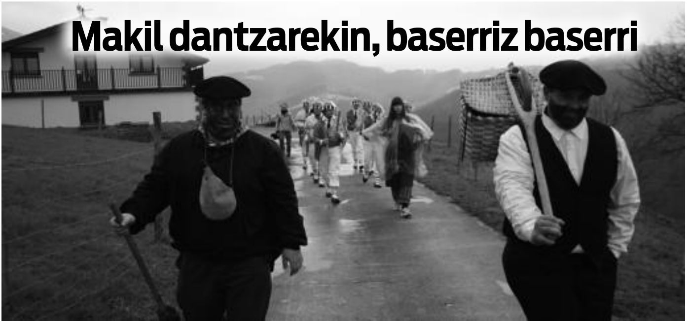
Nagusia eta saskia daramana aurretik, eta atzean soinu-jolea eta txantxoak Sasietako baserrietan zehar, atzo. I.TERRADILLOS

Abaltzisketako baserrietan izan dira txantxoak, urtero legez; gaur Amezketako talaiak ariko dira