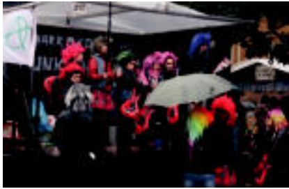
Haur, gazte eta heldu, guztiak ibili ziren kalean gora eta behera prestatuko ikuskizunak eskainitzen. E. MAIZ