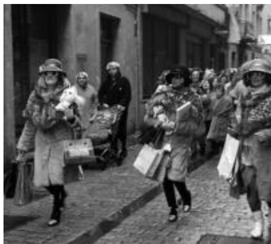
Luxuzko arroparekin hasi zuten batzuk Zaldunita. I. URKIZU