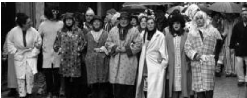
Ehunka lagun jaiki ziren Dianan salto egitera. I. URKIZU