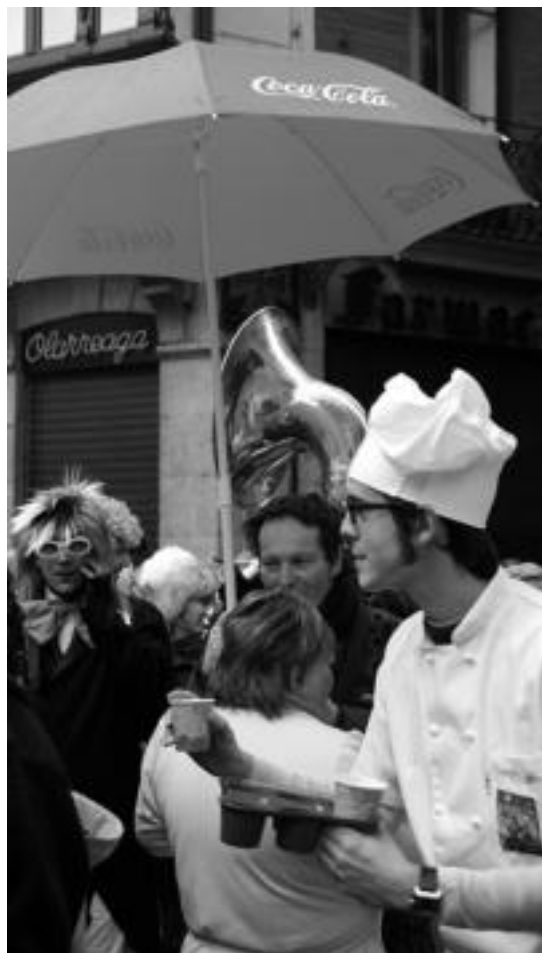
Inauterizaleei salda banatu zieten sukaldariz mozerrotuta. I. URKIZU