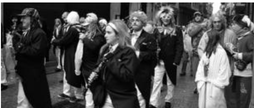
Tolosako musika bandako kideek ere mozerrotuta hasten dute Zaldunita. I.U.