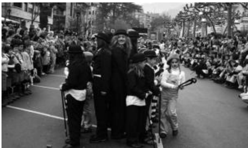
Kazkabarra taldekoak Charles Chaplinez irten ziren, pasa den urtean.