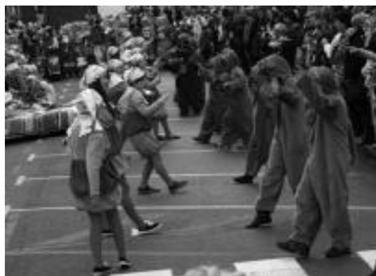
Ttenttek taldekoak, pasa den urtean, panpinez jantzita. ASIERIMAZ