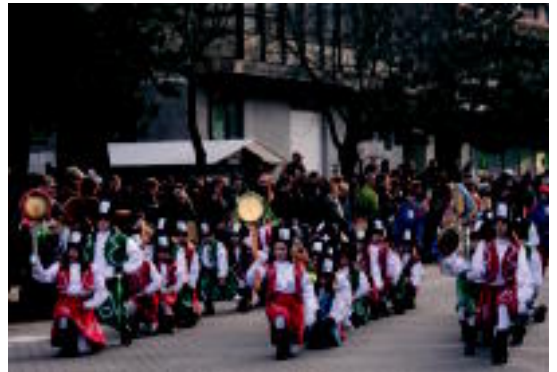
Kosakoz jantzita danborrada hasieran joan ziren neskak. I. URKIZU