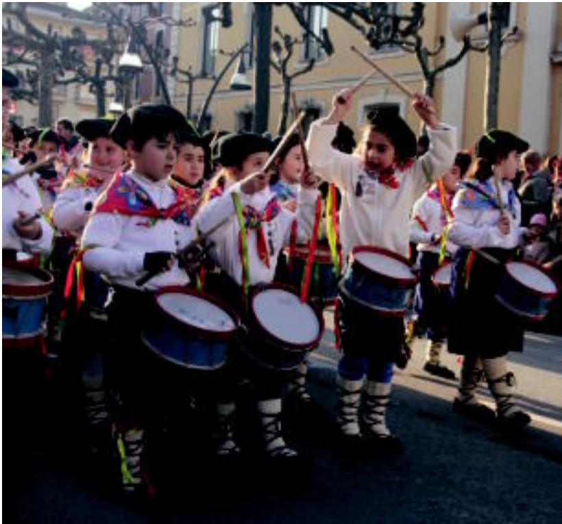
500 hurrek parte hartu zuten Aiz Orratz-Veletaren 50. danborradan. I. URKIZU