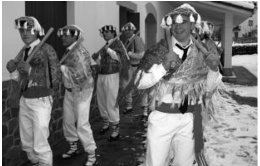
Abaltzisketako txantxoak makil dantza egiten. NL

Bai batean zein bestean, inauteriak heldu direla iragartzen duten makil hotsak izaten dira protagonista.