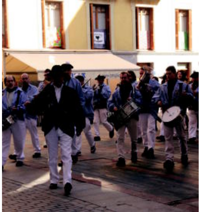
Erraldoi eta buruhandiak kalez kale ibili ziren Zaldunita bezperako goiza girotuz, eta baita Kabi Alai elkarteko txaranga ere. I. URKIZU