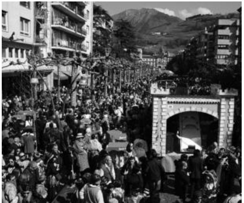
Jendez beteko da San Frantzisko pasealekua, urtero legez. A. MAZ

Arratsaldean ere txistularien eta txarangen doinuak izango dira entzungai. Horrez gain, zezen festa izango da zezen plazan. Iluntzean, Berdura plazara mugituko da festa, bertan dantzaldia izango baita txarangen doinuen erritmoa. Eta gauean ere horiek izango dira giroa alaituko dutenak.