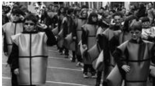
Txiribitu taldekoak Tetris jolaseko piezez mozo-rotu ziren iaz. R. CALVO