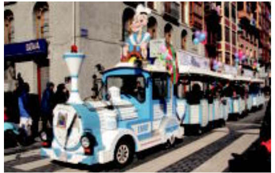
Txu-txu trenea goizean ere itzulika ibili zen. I. URKIZU