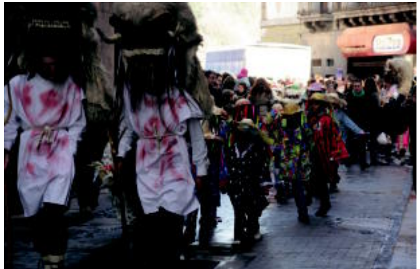
300 neska-mutilek parte hartu zuten Udaberriren inauterietako dantzari txikian. I. URKIZU

Dantzari txikiekin zihoazen txistulari nahiz trikitilari, eta dultzaineroekin batera, Kabi Alai-eko txarangaren inaute kantuak ere entzungai izan ziren, 12:00ak aldean kalejiran irten baitziren elkartetik.