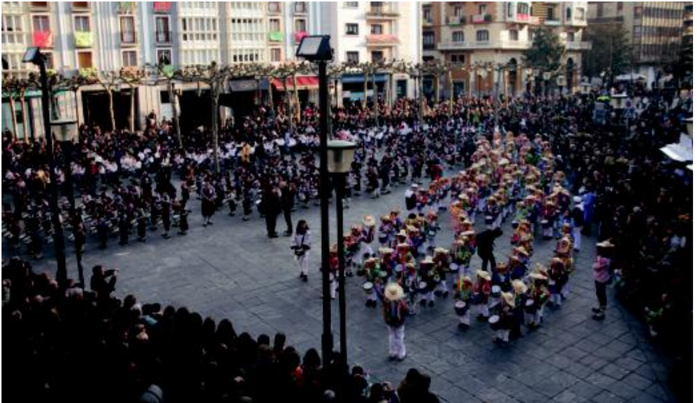
500 bat ume atera dira haur danborradan. Eguraldi onak lagunduta jende asko izan da ekitaldia ikusten, eta jendetza bildu da danborradaren bueltan. LURKIZU

Igandea, 2012ko otsailaren 19a. IX. urtea. 2.364. zenbakia. tolosaldea.hitza.info