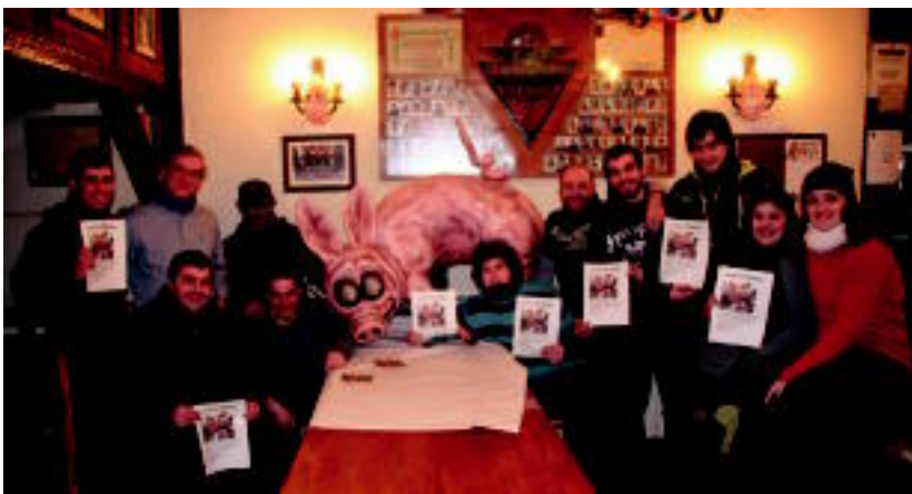
Sortu berri duten konpartsako kideetako batzuk, ekimenaren berri eman aurretik. I. GARCIA

Auzoko lanen inguruan hitz egiteko Tolosako Udalak sortutako partaidetza taldeak ia ez duela ezer erabakiko salatu du ◻3