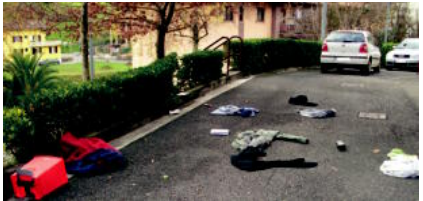
Zizurkilgo adingabeen zentroaren atarian ateratako argazkiak.