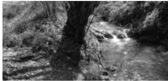
Erreka ikusiko da bidean pasatzerakoan. HITZA

Ibilbidea, bedaiotarrek eginiko eskaera baten ondoren gauzatzen ari den proiektua da. Tolosako Udalarai aurkeztu zizkioten beraien asmoak, eta onartu egin zitzaizkien. Lehen zatia egina badute ere, bigarren zatia falta da. Hala ere, 2012. urte bitartean burutzea espero dute.