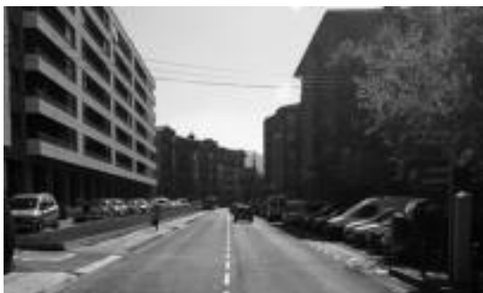
Lurperatzea irudian ikusten den tokian egingo lukete. I. GARCIA

Horiek horrela, lantaldeko kideek bizilagun arruntak direla nabarmendu nahi izan dute: «Gure ekimenak ez daude politikara bideratuta, bizilagun arruntak gara, bakoitzak bere ogibidea du eta gure eskubideak defendatzeko lanean ari gara». Partaide-tzaren alde egon daitezkeela diote, baina «ez eskubide batzuen urraketen gainetik». Zentzu ho-