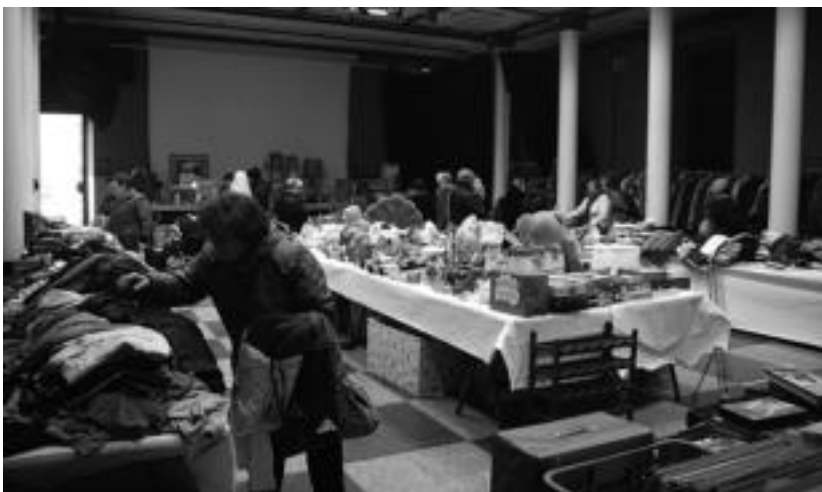
Antolatzaileek merkatu txikian jende ugari izan dela nabarmendu dute. R. CALVO