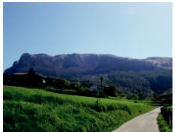
Herrigunera doan bidea ikusi daiteke irudian.

Lehen zatia egin dute jada eta orain landaretzaren inguruko informazio panelak jarriko dituzte ibilbidean zehar ◻6