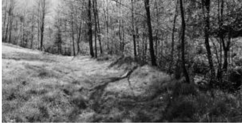
Harri xehea bota dute herri bidea berreskuratzeko; bota aurreko irudia da.

Bigarren zatian, ibilbideak berak eskaintzen duen ingurua ezaugarazi nahi dute. «Ibilbidearen lehen zatian dagoen erreka eza-