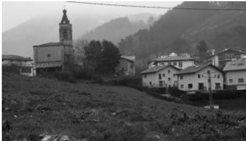
Altzo Muñoko etxeen ondoko belazean eraikiko lirateke; oraindik zein aldetatik hasi zehaztea falta da. E. MAIZ

Halaber, osoko bilkuran onartutako ordenantza hogeita hamar eguneko epean jendaurreko