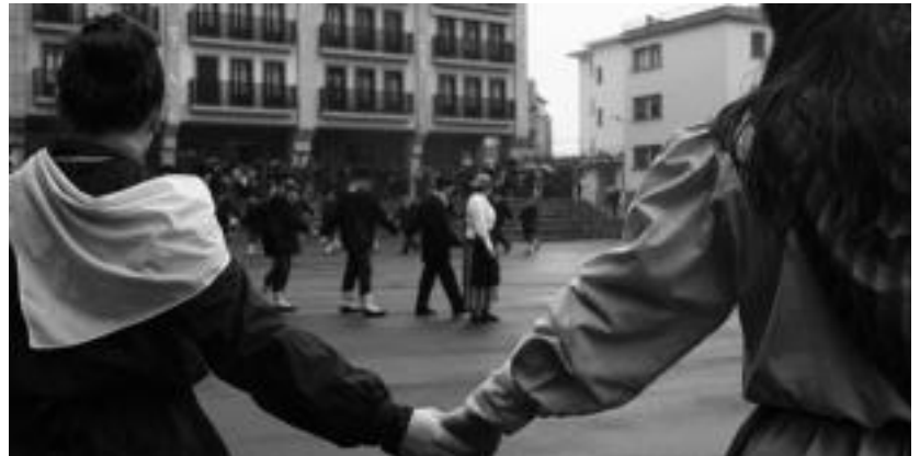
Egurdiko dantza saio guztia eurpean egin behar izan zuten dantzariak, iaz. E. MAIZ

Iaz eurpean busti-busti eginda egin behar izan zuten dantza, ea aurtengoaen eurriak festa ez duen zapuzten. Eguraldi hotzak jarraitzen badu ere, txistuaren erritmoa dantza eginez tenperatura baxuei aurre egingo diote anoetarrek.