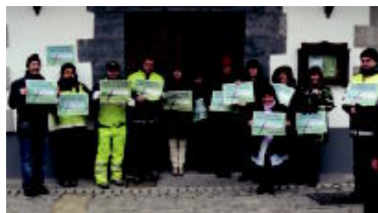
Iurako Udaleko langileek bat egin zuten lau orduko greba deialdiarekin.

«Jasotako erantzunak murrizketan kontra borrokan jarraitzeko indarra ematen digu eta horretan jarraituko dugu», esan zuten sindikatuak.