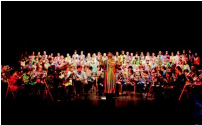
Tolosako Eduardo Mokoroa udal musika eskolako kontzertua emango du bihar Leidorren.