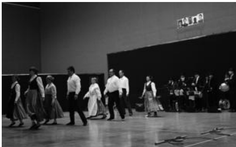
Lizartzako dantzarien saioaz gozatu ahal izan zuten iragan larunbatean herritarrek. I. TERRADILLOS

Bihar eta etzi ospatuko dituzte inauteriak, baina etzikoa izango da egun handia. Herri afaria eta ondorengo festa dira ekitaldi nagusiak. Badirudi herritarrek festarako irrikaz daudela, afarian, esaterako, 114 lagun izango baitira. Antolatzaileek antolakuntzan herritarrek eskaintako laguntza eskertu nahi izan dute.