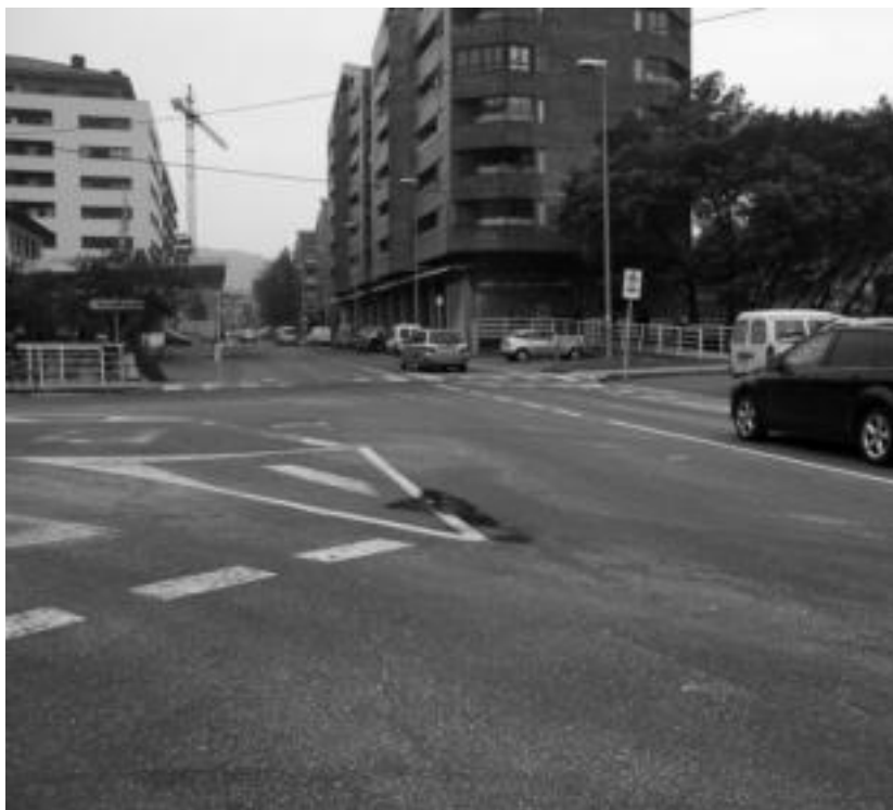
Egun Arriaran zerbitzugunearen ondoan dagoen bidegurutzea; biribilgunea horren parean aurreikusten da. I. GARCIA

Oiarbidek gaineratu duenez, «sarrera berri honi esker tolosarrak zein Tolosara sartzen direnek N-1 errepidearekin lotura egokiagoa izango dute». Ildo bereetik, Jokin Azkue Tolosako EAJK zinegotziak bere alderdiaren lana nabarmendu du: «EAJKren lana esker, aldundiak biribilgune hori egitea lortu dugu. Proiektua