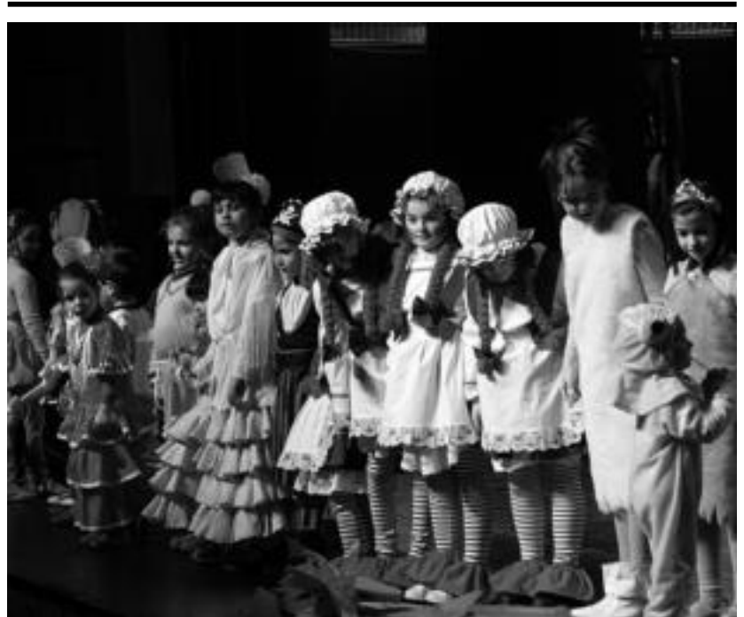
Mozorro lehiaketako sariak ere haur jaialdian banatuko dituzte.

Manipulados Araxes lantokiko langilea eta Euskal Herria Sozialistako kidea.