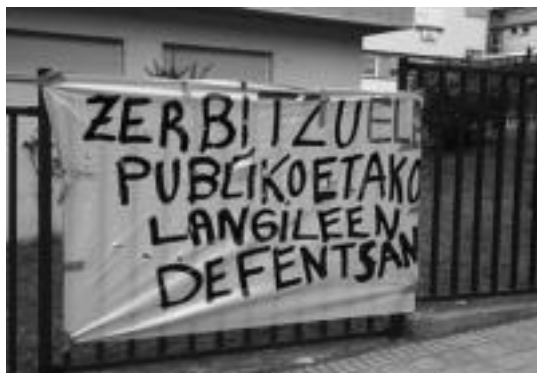
Samaniego ikastetxean zintzilikatu duten kartela.

Tolosaldeko udal ugaritan egingo dute lanuztea, eta baita ikastetxeetan ere. Tolosako Samaniego ikastetxearen kasuan, irakasleen %40k egin du bat deialdiarekin, beraz, bertako ordezkariak geletan ezingo dela ohiko funtzionamendua bermatu adierazi dute. Hori bai, Haur Txokoa, garraio zerbitzua, Lagumbusa eta jangelak ohikotasunez jarraituko dira. Osasun zentroen kasuan, ez dute bozketa orokorrik egin, eta norbere esku dago, beraz, lanuztearekin bat egitea.