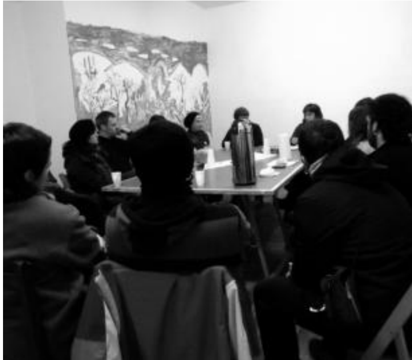
Iragan ostiralean egin zuten ekimenaren aurkezpena Leitzan.