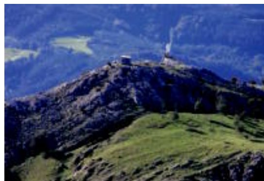
Izarraitz mendiguneko irudia. HITZA

bat, taberna eta lotarako lekua eskaintzen dituen, beraz, nahi dutenek ere asteburua igarotzeko aukera izango dute.