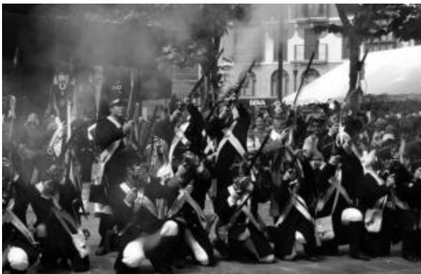
Ekainaren 12an ospatu zuten iaz, Tolosako I. alardea. I. URKIZU