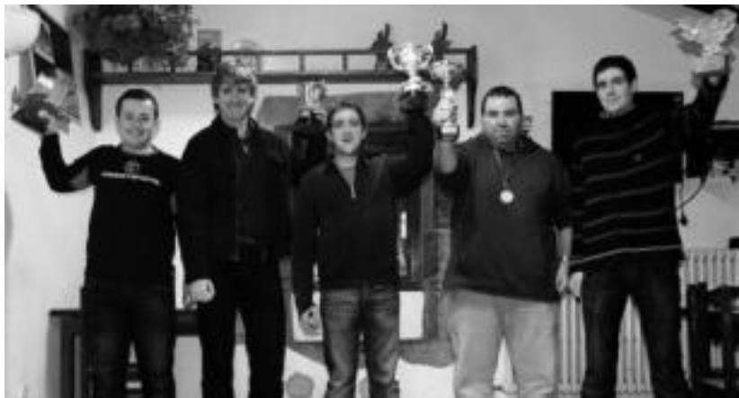
Leitzaundi taldea ariko da igandean, Leitzako saioan. NAFARROAKO BERTSOZALE ELKARTEA

Orain arte lau saio izan dira; Etxarri Aranatzan, Iruritan, Donezteben, Lesakan eta Elizondon. Finala martxoaren 31n izango da, Leitza, eta bertan hiru talde izango dira lehian.