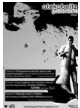
Otsailako kartela. HITZA

patriarkalarekin amaitzeko bide ona» hartua dute, eta euren proiektua «babezuago» sentitzen dute. Egun bizi dugun egoeraz, berriaz, «feministen arteko akordioa eta lankidetzeta inoiz baino garrantzitsuagoa» dela diote, «gure eskubideen behin betiko aitortza lortzeko abagune ezin hobea baita oraingoa». Egungo egoeraz, eta aurrera begira eman beharreko pausoez eztabaidatzeko aukera polita izango dute ekimena antolatutako hiru egunetan, baina emakumeek soilik. Izan ere, iluntzeko ekitaldiak eta igande eguerdiko ekitaldi nagusia baino ez dira izango emakumezko nahiz gizonzkoentzat. «Garrantzitsua iruditzen zaigu emakumeak soilik elkartzea, eskuz esku eraiki ditzakegun alternatibek gugandik sortuak izan behar baitute».