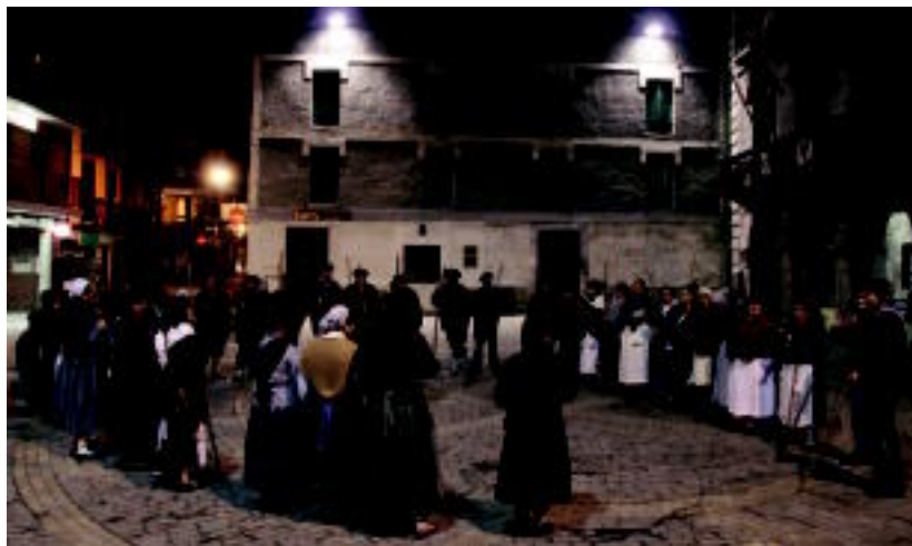
18:00etan hasita, Txintxarri abesbatza eta Zazpi Astoren Gainean bertso eskolakoak elkarrekin ibiliko dira. T. GOMEZ

Eguraldi iragarpenak betetzen badira, oinetako eta eskularru onak jantzi, eta eztaerriak ongi berotuta ater beharko dira kalera,