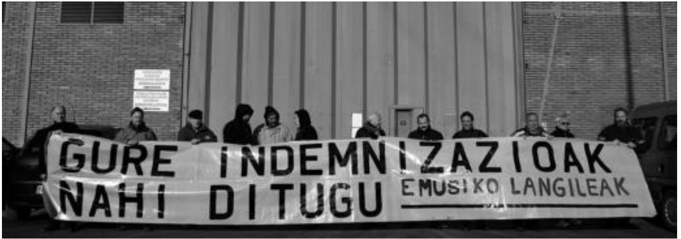
Irurako Emusi zenaren aurrean elkartzen dira bertako langile ohiak astelehenetan, asteazkenetan eta ostiraletan, elkarretaratzean.