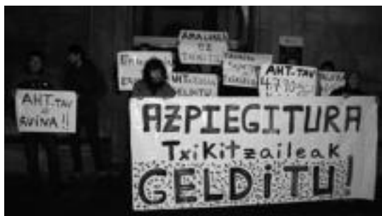
AHT Gelditu elkarlanak elkarretaratzea egin zuen udaletxearen aurrean.