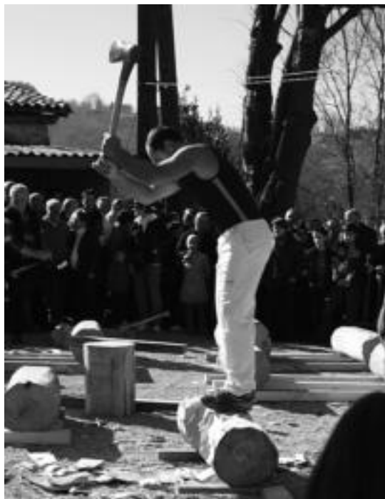
Urtero bezala, aizkolariak izango dira igande eguerdian. I. URKIZU

Bihar izango da egunik nabarmenena, meza nagusiarekin eta bertako produktuen bedeinkapenarekin