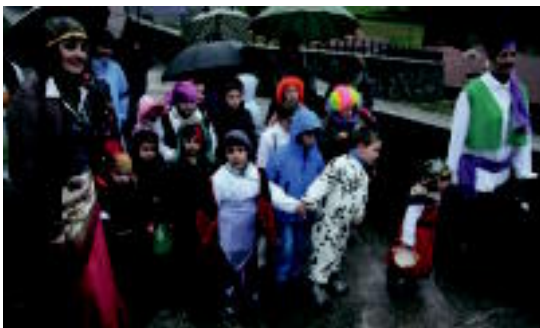
Txikienek, urtero bezala, mozorrotuen desfilean parte hartu zuten. I. GARCIA