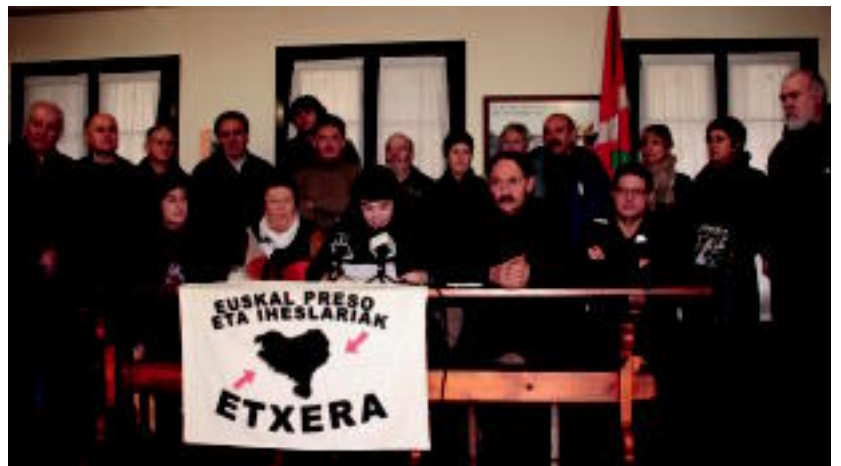
Odriozolaren askatasuna eskatu dute bere lagunek, Egin Dezagun Bideak eta Lizardi kultur elkarteak. I.GARCIA

Kalean egon behar zuela salatu dute, tolosarrak espetxean 24 urte bete dituen egunean 2