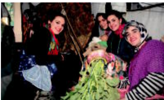
Ijitoak gurdiaekin mugitu ziren kalez kale. I. GARCIA