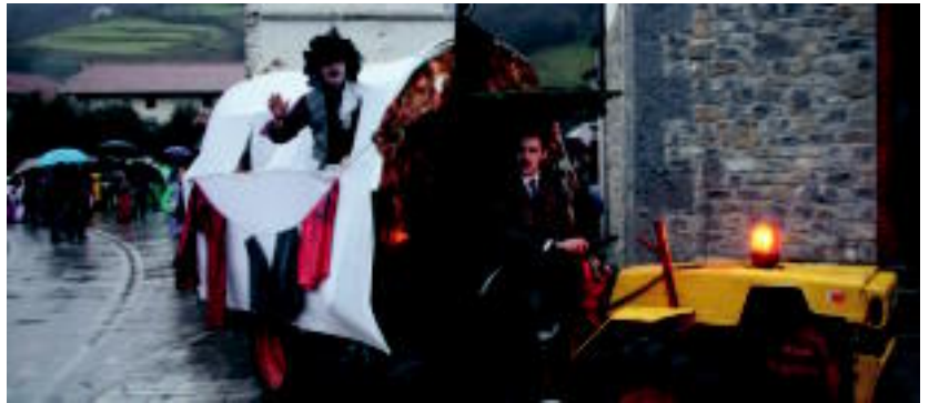
Goiko argazkian, Larrea elkartearen egindako bertso bazkariaren une bat. Azpikoan, mozorrotuen desfilea. HITZA