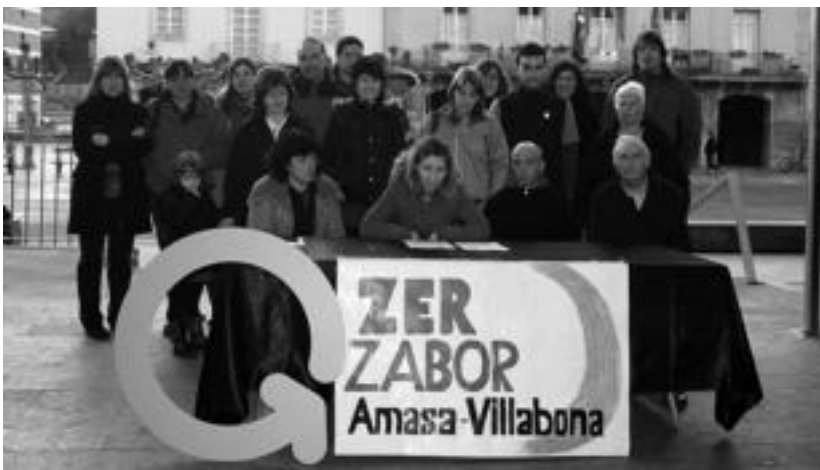
Hainbat herritarrek Amasa-Villabonako Zero Zabor taldea Berdura plazan aurkeztu zuten, ostiralean. E. MAIZ