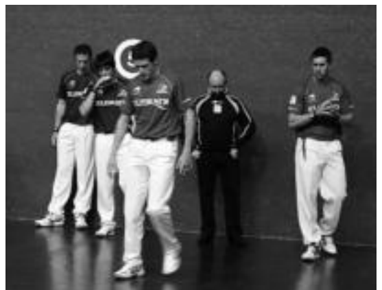
Olazabal aresoarrak Beotibarren jokatu zuen txapelketako parida, atzo. A.I.

Volvo Ocean Race lasterketaren hirugarren etapa Chinako Sanya hirian amaituko da. Malacako itsasartetik bertara segurtasun eremu baten barruan joango dira, 15 itsas milia-ko zabaleran. Honek zailtasun gehiago ekarriko dituela azaldu dute Telefonica ontzitik, maniobra ugari egin beharko baitituzte: «Buruari dezente eragin behar izan diogu bide zuzenean zein zen erabakitzerako orduan, lehen aipatu bezala, faktore guztiak hartu behar izan ditugu kontuan. Lehia gogorra aurreikusten dugu, eta gelditzen diren itsas milia guztietan gogotik lan egin beharko dugu».