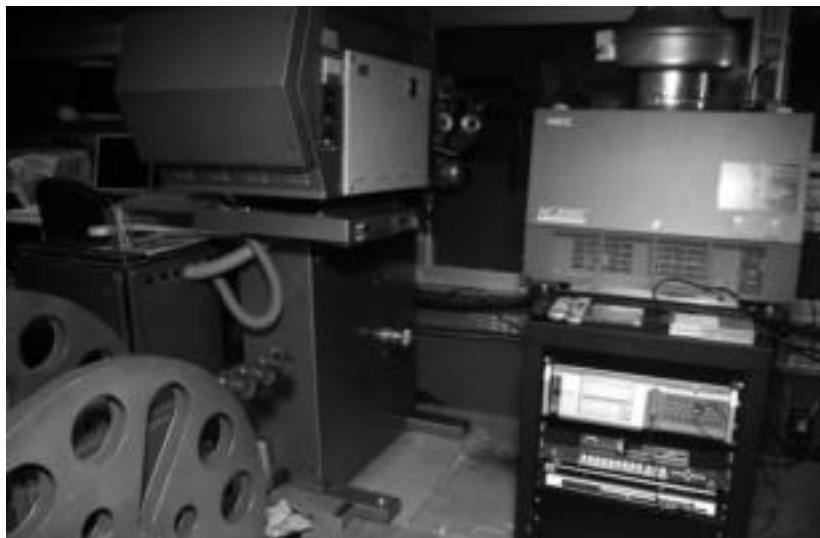
Elektronen, 35 mm-ko proiektorea, eta, eskuinean, proiektore digitala. I. GARCIA

Ekipamendu berriak eskainiko dituen hobekuntzak ere zerrendatu ditu udalak. Batetik, programatzerakoan aukera zabalagoa izatea, «askatasuna eta ziurtasuna irabaziz filmak kontratatzeke». Aldaketa ohiko programazioke atal guztien onurarako izango dela azaldu du: zine foruma, haur saioak eta asteburuko zine komertziala. «Honen adierazgarri izango da proiektorearen estreinaldirako prestatutako egitaraua», gaineratu du udalak. Proiektorearen kalitatearen aldetik, batez ere emanaldi digitalen soi-