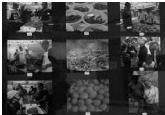
300 argazki inguru jarri dituzte ikusgai kultur etxean. HITZA