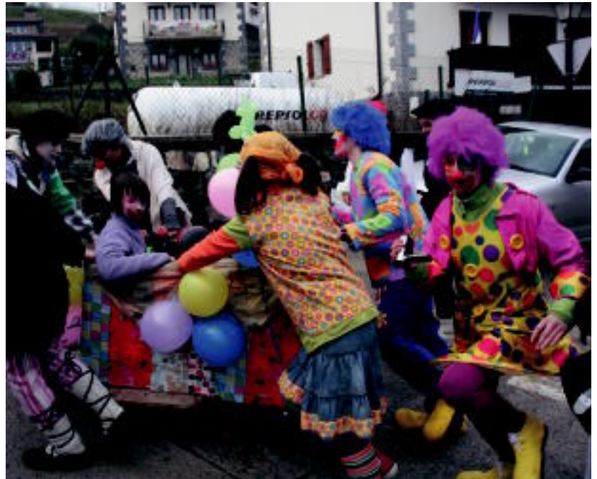
Pasa den urteko inauterietan, herritar batzuk pailazoz moztorrotu ziren. IMANOL GARCIA