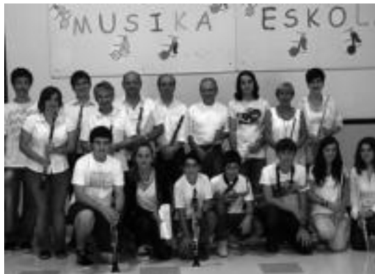
Musika eskolako haizezko instrumentuen ikasleak. HITZA

Egitarau oparoa izango dute entzuleek. Bonbardino laukoteak The Sreuous life joko dute hasieran. Ondoren, egurrek eta tronpetek Pavana eta Gallarda obra eskainiko dute. Tronboi laukoteak Rag-time dance joko dute. Gero, tronpa, bonbardinoak eta tuba ariko dira. The high school cadets obrarekin. Tronboi taldeak The beau ideal march joko du, eta ondoren, flautak, oboeak, klarineteak eta saxoak Suite 4 (Re-m) eskainiko dute. Tronboi laukoteak A breeze from Alabama joko du. Bukatzeko, ikasle guztiak batera Le gamin de Paris obra eskainiko dute.