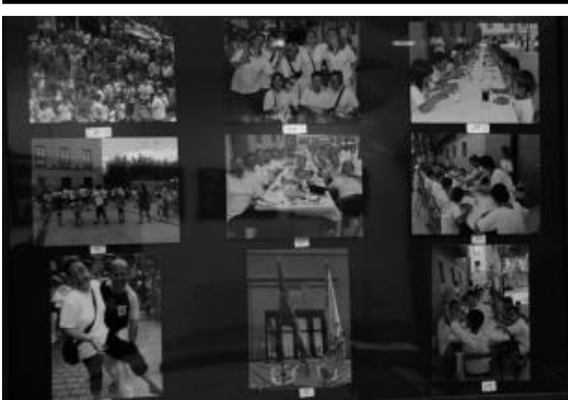
San Bartolome jaietako ekitaldi guztietako mementoak ikus daitezke erakusketan.