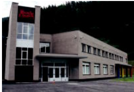
Irurako ikastola 2008an inauguratu zuten. HITZA

Etorkizunari begira, erronka handiak dituzte Tolosaldeko ikastolek, bailarako erreferente izaten jarraitzeko ahaleginetan. Ikusmirari erantzun ahal izateko, instalazioak egokitzeko eta hornitzeko inbertsioak egin nahi dituzte. Pedagogia mailan berriz, material eta egitasmo berritzaileak garatu nahi dituzte, irakaskuntzaren kalitatea areagotuz. Eta hori guztia lortzeko, helburu bateratuak, ilusioa, inplikazioa eta elkarren arteko lankidetzak dituzte.