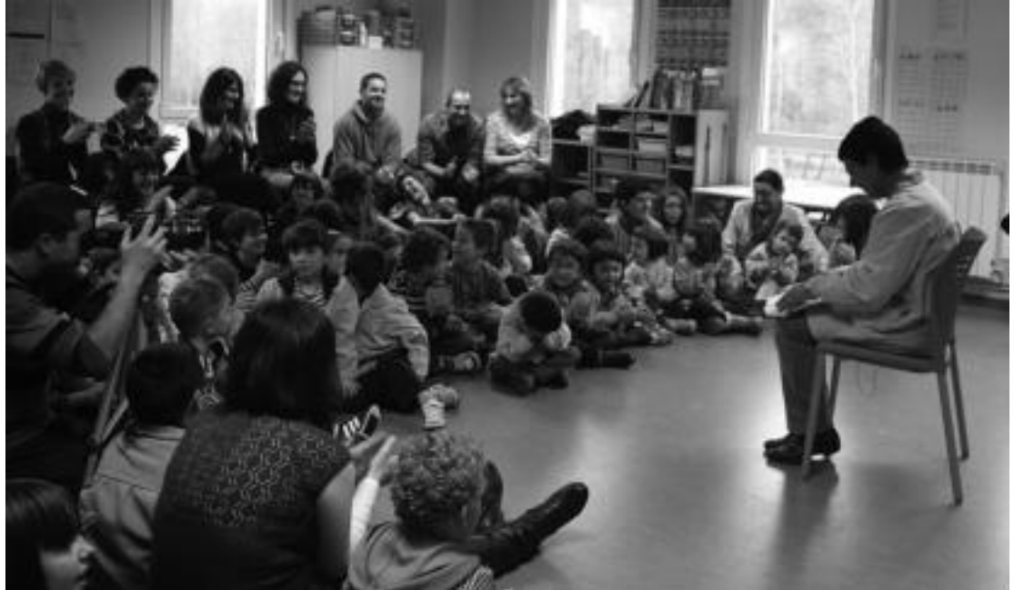
Ikaztegiatetako Herri Eskolan astelehenean egin zuten grabaketa; Maria irakasleak ipuina kontatu zien guztiei. Ikasle eta irakasleekin batera, ikasle ohiak, guraso elkartekoak eta udal ordezkariak izan ziren. E. MAIZ

Era berean, beraien egoeraren berri eman nahi dute. Pasa den urteko ekainean, Abaltzisketako Txalburu eskolari hartu zion lekukoa Larraulek.