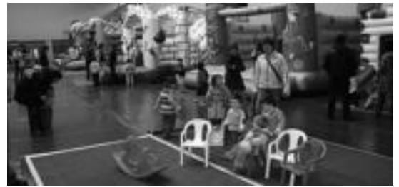
Urtero bezala, haurrentzat puzgarriak jarriko dituzte larunbatean. HITZA