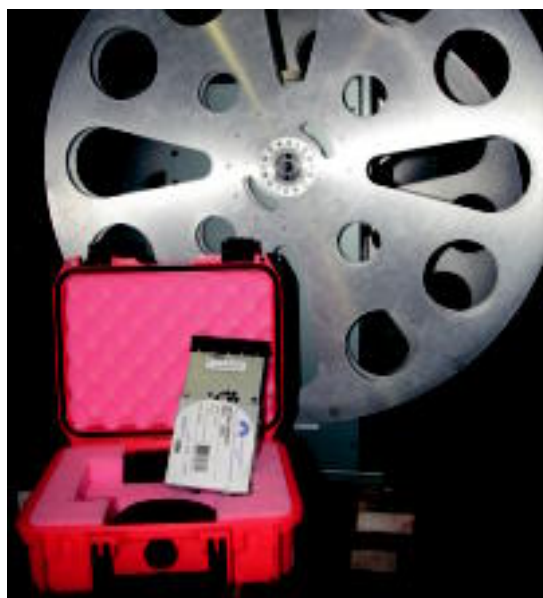
Film digitala duen disko gogorra, eta bere atzean, ohiko bobina. I. GARCIA

Egunotan ari dira estreinatzen proiektore berria Tolosako zinema aretoan 03