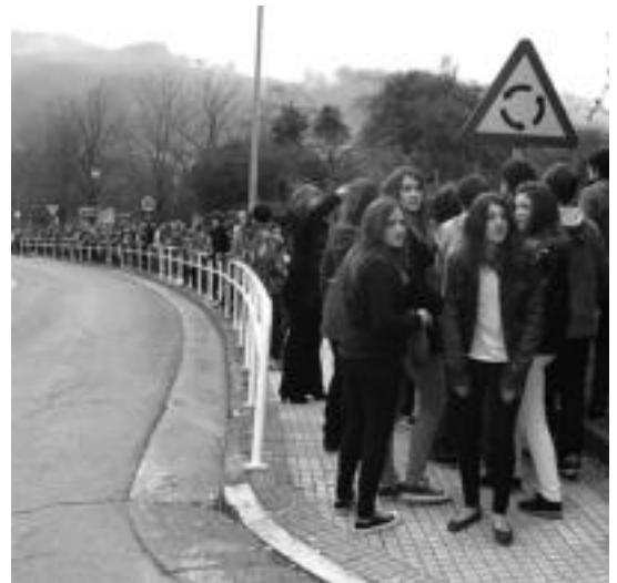
Usabaletik Sakramentinoetaraino osatu zuten giza-katea, atzo.

Azaldegik azaldu zuenez, duela bi aste izan zuten Lodosako ikastolaren egoeraren berri. Honen aurrean, ikasle zaharrenek zerbait egin zitekeela pentsatu zuten: «Oso triste da Nafarroako ikasleek duten egoera. Euskararen erabilera erabat mugatua den toki batek tristura handia ematen du». Horrela beraz, batxilergoko gazteak aritu dira, ikasle gazteenei Lodosako ikastolaren egoera azaltzen: «Harrituta geratu dira, eta haserre. Laguntzeko beharra sentitu dute».