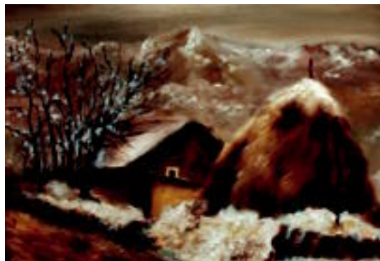
Erakusketan ikusgai dauden zenbait margolan.