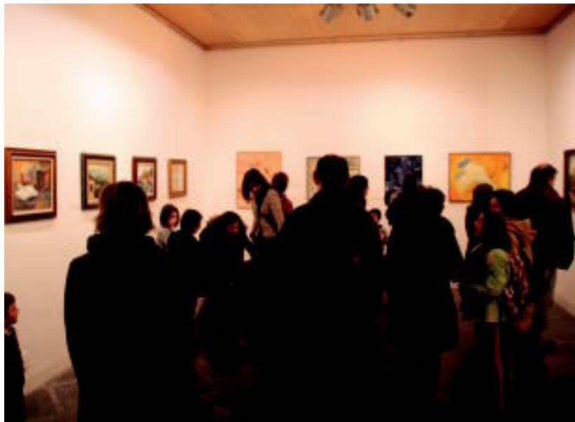
Jende ugari izan zen herenegun arratsaldean egindako inaugurazio ekitaldian. I. GARCIA

Horrelako ekimen bat aurrera eramateko motibazioa «garrantzitsua» dela esan du pintura irakasleak, eta «ilusio handiz» egindakoa izan dela gaineratu du. Ikasleez gain, Colmenero berak ere hainbat koadro zintzilikatu ditu. Hainbat teknika erabili dituzte: akuarela, pastela, itzalak, egur margoak, olio eta espatula.