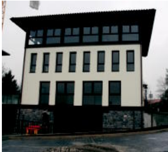
Eraikinaren atzeko aldetik haur eskolarako sarrera jarri dute.