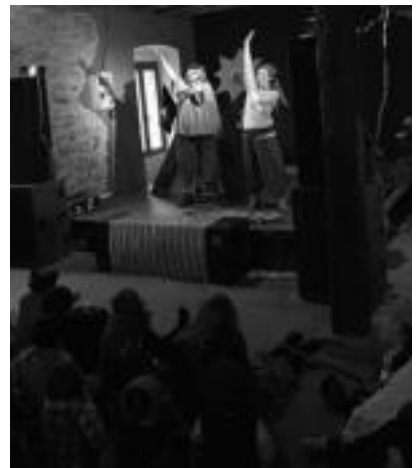
Ilgandean jende ugari izan zen gurdien kalejira ikusten. Gaztetxoek ederki igaro zuten antzerkian.

Tolosaldeko eta Leitzaldeko HITZAn jarrita Gipuzkoako beste 4 Hitzetan DOAN