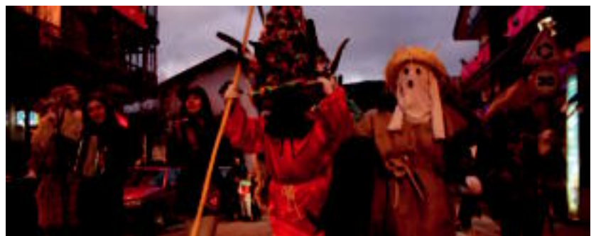
Jende ugari gerturatu zen atzo arratsaldean, atsauren kalejira ikustera. I.TERRADILLOS

Leitzako Inauteriak atsauren kalejirarekin bukatu dira eta antolatzaileek «jendetsuak» izan direla diote; etzi hasiko dira Aresoko jaiak 07