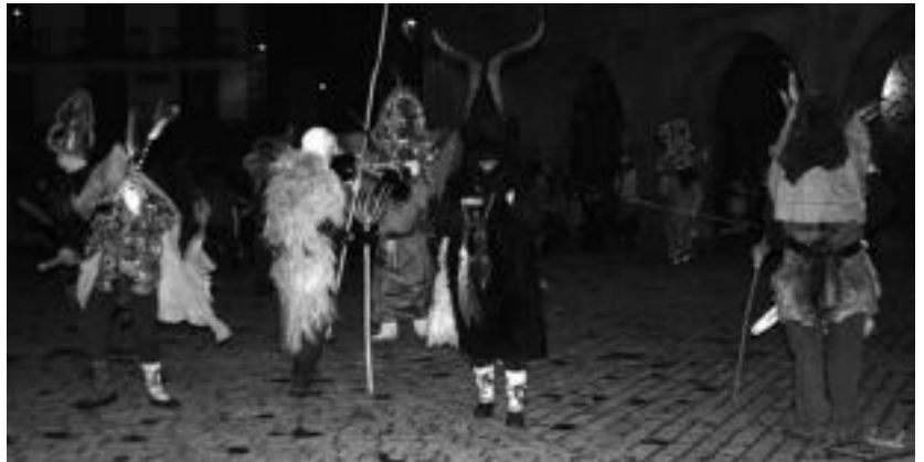
Dantza saioa egin zuten atsaureek plazan herriar ugariaren begiradapean. I.TERRADILLOS

Leitzarren bizilagunen Inauterietarako ez da gehiegi itxaron behar. Etzi arratsaldean botako dute Areson jaien hasiera iragaritzen duen suziria, eta hiru egunetan zehar festa giroak ez du etenik izango.