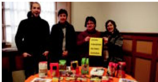
Udaleko eta eskolako ordezkariak, zenbait produktuekin.

Honako kontuetan sartu daiteke dirua: Kutxako 2101 00 6722 0011180866 eta La Caixako 2100 17 5868 0200077750.