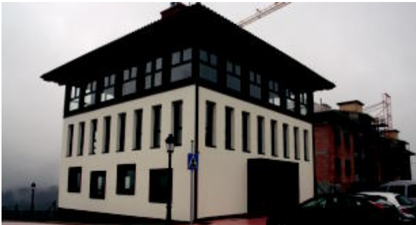
Erabilera anitzeko eraikinaren ondoan egiten ari diren etxebizitzak urte amaierarako bukatu nahi dituzte. E.MAZ

Barrutik hornitzeko diru laguntza eskaeraren erantzunaren zain dago udala; momentuz adinekoek izango duten tokia eta spinning gela egokitu dituzte, eta gainerakoa adostu egin beharko dutela dio alkateak 05