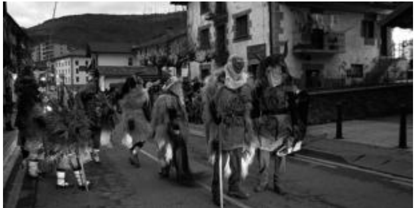
Plazarako bidea saltoka, zarata artean eta maskuriarekin herriarrak izutuaz egin zuten. I.TERRADILLOS