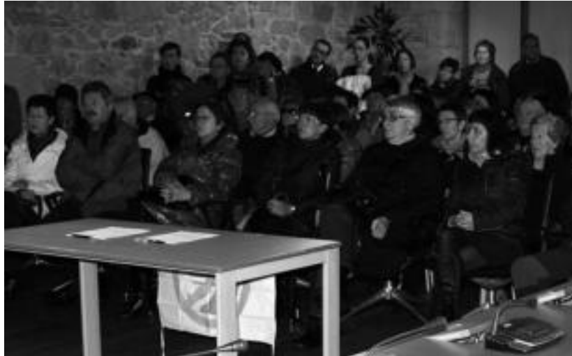
Batzar aretoa bete egin zen joan den larunbateko batzarrean. A.MAZ

Invizak, Asuncion klinika kudeatzen duen enpresak, pasa den abenduaren 14an honen inguru-