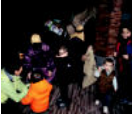
Tolosaldeko plazan Errege Magoen laguntzaileak egon dira. A. Imaz

Berdura plazan. Herriko haurrak, txantxo-txantxo, bertan gertatu zuten euren gutunarekin. Bertan, opari zerrenda luzea zuten idatzirik batzuk, besteek, ez hainbeste txantxoekin, baita gutxiak zer nahiz zuten argi zekiten. Orain Melxor, Baltasar eta Gasparen txantxo izango da. Laguntzaileen eskutik gutunak jasoko dituzte, eta ondoren banatzen hasiko dira. Villabonara Amasatik harrera jaitziko dira, 18:00etan. Herriko plazan, opariak eta gozokiak banatuko dituzte haurren artean, eta itzulera bitan, herritar barrena itzulia emango dute Villabonara gutriak agurtzeko.