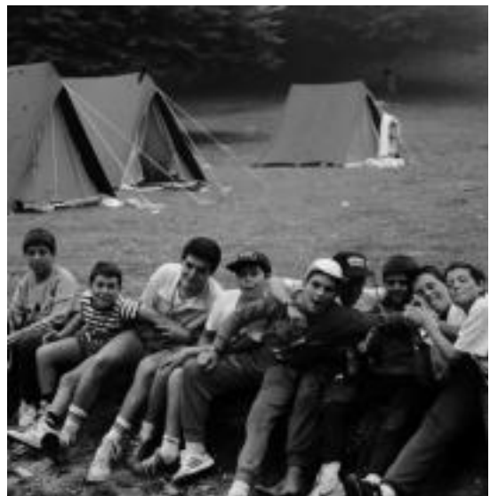
Helburu berak ditu taldeak sortu zenez geroztik. HITZA