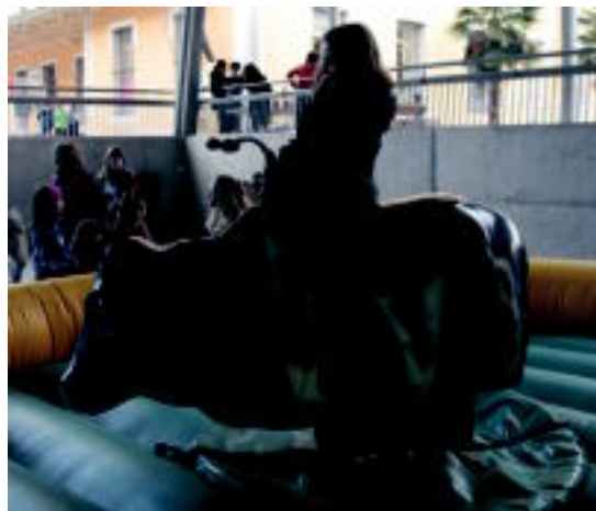
Ekitaldi ugari egin zituzten atzo arratsaldean. I. GARCIA

Tolosako aisialdi taldeak erakusketa, DVD proiektzioa eta argazki lehiaketa antolatu ditu, besteak beste, datozen hilabeteetarako; maiatzean Kirikiño eguna ere egingo du 02