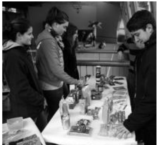
Gaztetxoentzat festa izan zen atzo. I. GARCIA