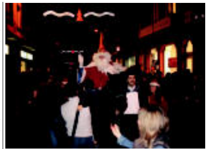
Errege Magoen ibilbidean herritar ugari elkartu zen Iaz Tolosan. ANEL ALDICO

• 19:00etan. Errege Magoak herriko plazara iritsiko dira Urdinain mendiko Etxon-beni baseritik. Plazan, Olenzero eta jaitzuta biziduna egingo dira, eta Erregeek eskaintzak egingo dituzte bertan. Berastegiko haurrak ere berdin egingo dute, talo, gaztaina, baraki eta abarrek. Ondoren Baltasar, Mel-