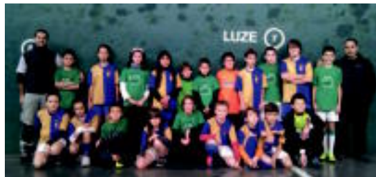
Ikaztegieta eta Abaltzisketako taldekideak. E. MAIZ

Era berean, aurtengoa eredu hartuta datozen urteetan ere herri txikien arteko partidak antolatzeko nahia azaldu dute.