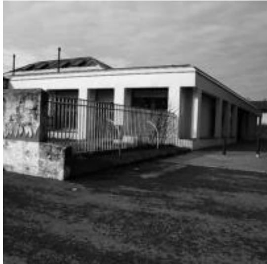
Zerbitzu publikoak bere horretan mantenduko ditu Udalak. A. IMAZ

barruan egingo diren obrak. Batetik, Amazabal auzoan urbanizazio lanak egingo dituzte, eta 779.560 euroko kostua izango dute. Eta, bestetik, ETAP edo Edateko Ura Tratatze Estazioa egingo dute, 652.543 euroko kostuarekin. «Europako legediaren arabera, 2020. urterako deposituan sartu aurretik urak tratatua egon behar du; guk une egokia dela orain ikusi dugu, eta diru laguntza batzuk ere zehaztuta ditugunez, aurrera egitea erabaki dugu», dio Leitzako alkateak.