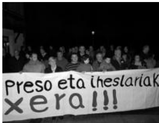
Altzon, urteko azken egunean egin zuten elkarretaratzea. HITZA