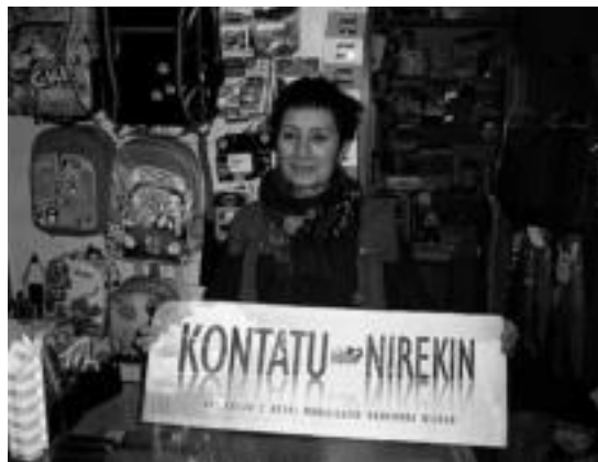
Villabonako Basajaun dendak ere atxikimendua eman du. HITZA