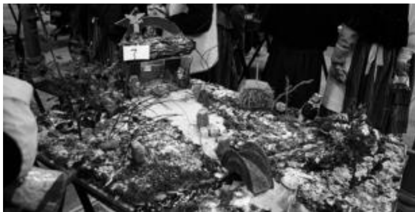
Mota askotako jaiotzak aurkezten dituzte parte hartzaileek. HITZA

Beste puntuetako batean, hotsari aurre egiteko larrialdiko bizilekua etxerik gabekoentzat programa martxan jartzea onartu du udal gobernuak. Iaz ere onartu zen programa hori. Programa martxan jarriko da baldin eta gaueko tenperatura 5º zentigradotik beherakoa izango dela aurreikusten bada eta Abegi beteta badago.