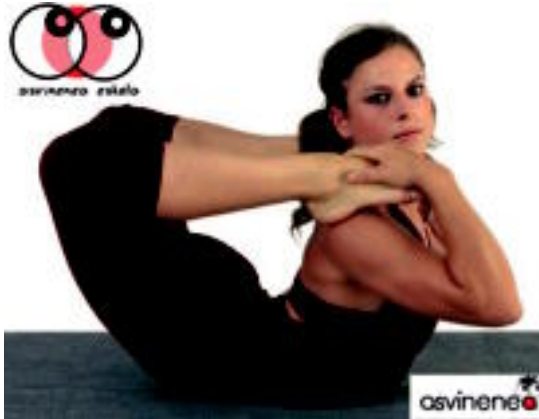
Pertsona bakoitzak bere gaitasunaren arabera egingo ditu ariketak. HITZA

Egun osoko saioa izango da, 10:00etatik 13:00etara, eta 16:00etatik 20:00etara. Ikastaroaren kostua 50 euro izango da, eta Asvineneako bazkide izanez gero, 45 euro ordaindu beharko da. Adin eta maila guztietako pertsoneri zuzendutako ikastaroa prestatu dute. Norberak bere gorputza ezagutuko du, eta bakoitzak