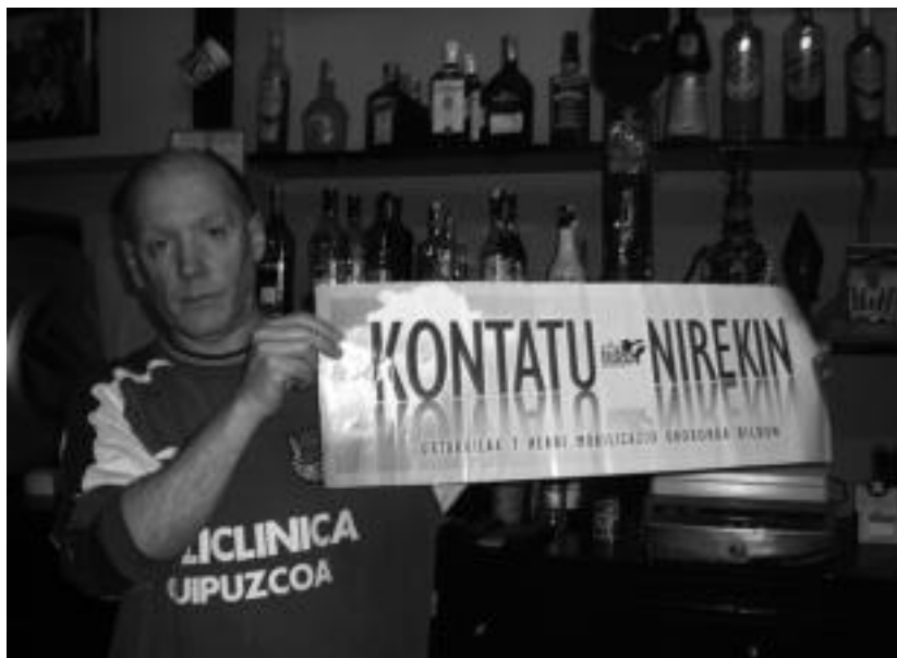
Villabonako Rainbow tabernako jabea 'Nirekin kontatu' ekimenarekin bat egiten. HITZA

Urtezahar gauean euskal preso eta iheslarien aldeko elkarretaratzea egin zuten Altzon. Bertan, 40 lagun elkartziren. Euskal preso- en eskubideak aldarrikatu zituzten elkarretaratzean, Euskal Herriratzeara eskatuz. Bilboko manifestazioarekin ere bat egin zuten altzotarrek.