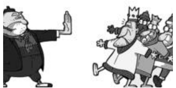
Bai Euskal Herriaririk ekimena babesteko atera duen irudia.

Gogorren hitz egin dutenak Leitzako Derecha Navarra y Española alderdiko kideak izan dira. Erabakia bertan behera ez baldin bada gelditzen, DNEko kideek, erregez jantzi eta herri guztietan aurkezteko asmoa azaldu dute.