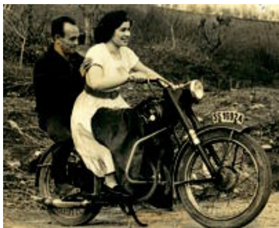
Era askotako argazkiak ikusteko aukera izango da erakusketan. HITZA

Auzotar guztiak gonbidatu nahitu dituzte prestatu duten era