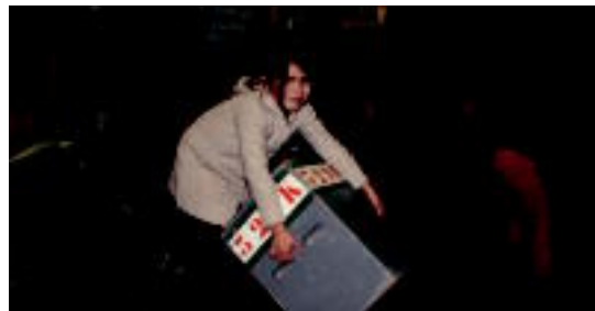
Tolosako Zerkausion 2 eta 12 urte bitarteko haurrentzako jokoak daude. A.I.

Eguberrietako jai egunak igarotzeko, gazteenek hamaika joko dituzte eskuragarri Bearzana frontoian eta Zerkausion 04