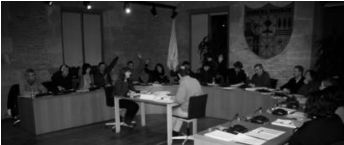
Bilduko eta Aralarreko zinegotziek aurrekontu proposamenari baiezkua eman zioten unea. I. GARCIA