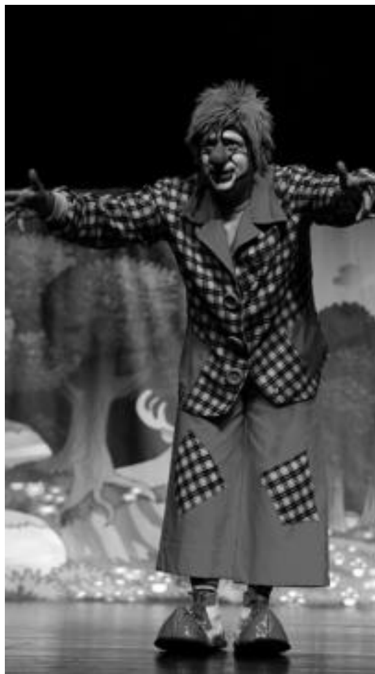
Beste hainbat lagunekin batera aritzen da Poxpolo, oholtzan. HITZA

Bestela ere aktore lanetan aritzen da Galarza, baina gauza batek bestearekin zerikusirik ez duela dio: «Gure inguruan amets