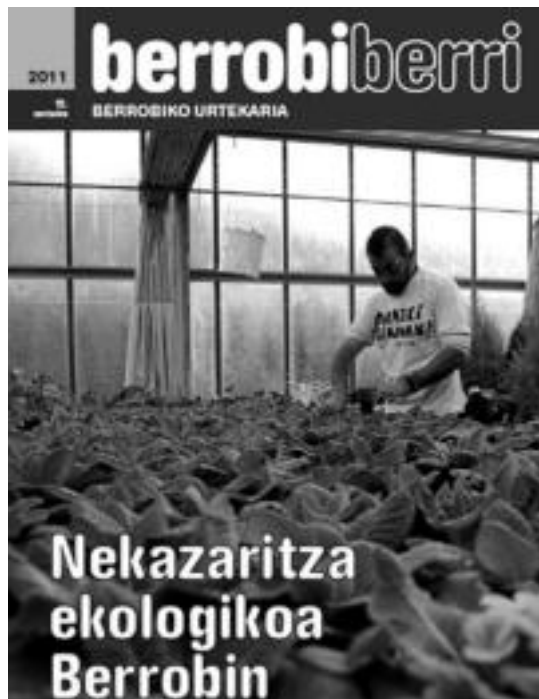
Hamabigarren 'Berrobi Berri' aldizkariaren azala.

Berrobin bada txakolina egiten duen baserri bat, eta bertako jabeari elkarrizketa egin diote. Hala, ber, 40 urteren ostean bere atea itxi dituen herriko dendako arduradunen hitzak ere jaso dituzte. Udaleko bi udal taldeen proiektuak