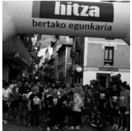
Alegian iaz antolatatu zuten lehen San Silbestre Krosoa.

Berastegin, Alegian, Tolosan eta Villabona-Zizurkilen sari banaketa ekitaldiak egingo dituzte lasterketaren amaieran. Parte hartzaileen artean opariak ere banatuko dituzte. Lizartzaren kasuan, korrikalari guztien saria txokolate beroa izango da.