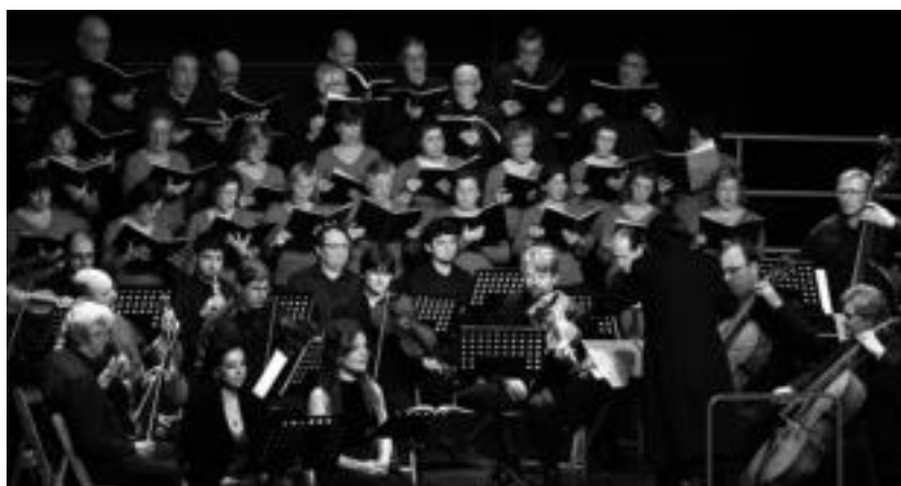
Tolosako Orfeoia urtero ospatzen du Eguberrietako kontzertua. HITZA