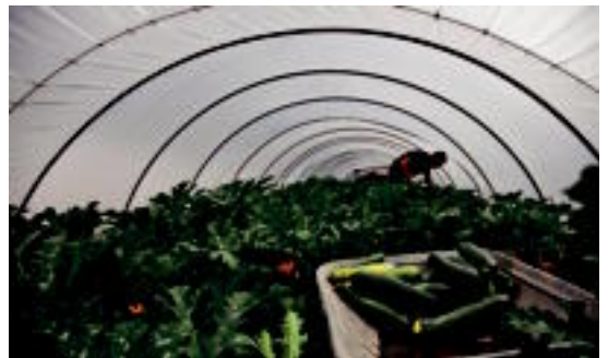
Ibarra Montes baserriko negutian barazkiak biltzen ari dira.

Urtarrilaren 21a bitartean egongo da ikusgai Aranburu jauregian, 17:30etik 20:30era, astelehen eta jai egunetan izan ezik.