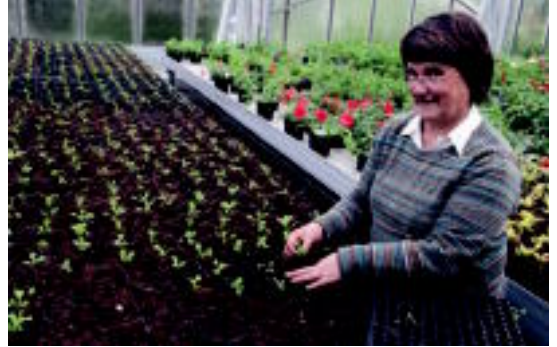
Berrobiko Teileri baserrian, loreekin lanean. HITZA