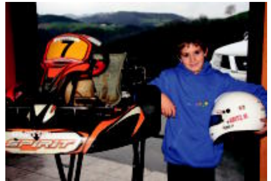
Murua gaztetxoa bere kart autoa ondoan duela. E.MAIZ

Hamar urteko abaltzisketarrak Euskadiko Kart Txapelketako hirugarren postua eskuratu du, bere estreinako denboraldian ◊4