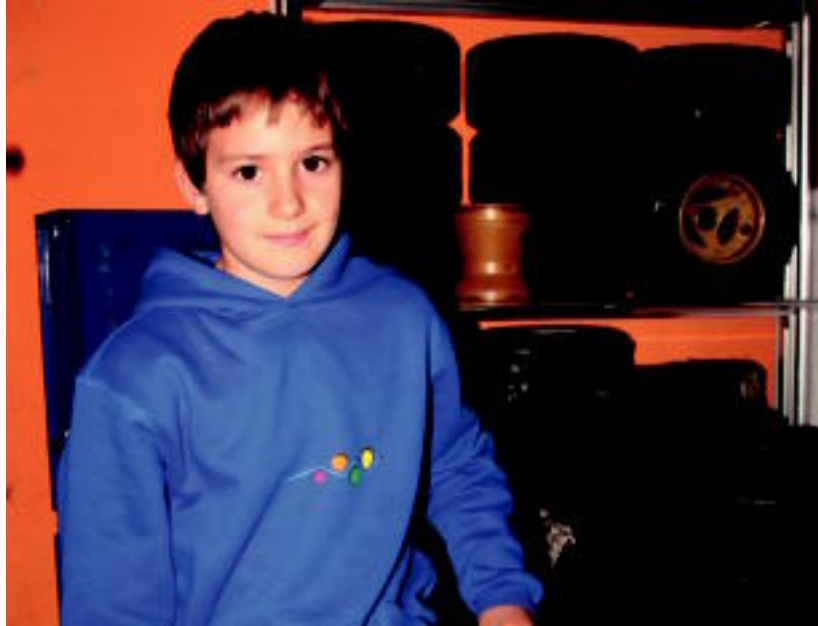
Lasterketa bakoitzean kart autoari lau gurgpilek berriak jarri behar izaten dizkiote. E. MAIZ

Emaitza onak ikusita, berotu egin ziren, eta kart berria erosi zuten, lasterketetan parte hartzeko.