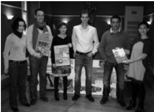
Haurrentzako I. Gabon Parkea antolatuta dute Villabonan.