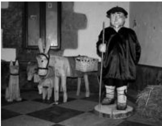
Abaltzisketan udaletxeko arkupetan jarri dute Olentzero. E. MAIZ