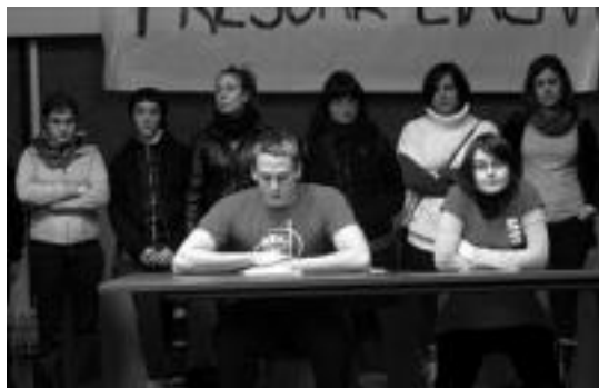
Gazteek mobilizazioen berri eman zuten prentsaurrekoan. I. URKIZU

Eguberrietan izango diren mobilizazioen berri astelehen iluntzean eman zuten hainbat gaztek, prentsaurreko batean. Bertan «gatazkaren ondorioak zuzenki