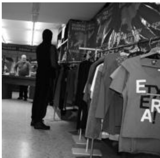
Tolosako Korreo kalean aurkitzen da Elkartasun Denda. A. IMAZ

Tolosan, azken urteetako ohi-turari jarraituz, Tolosako Preso eta Iheslarien Lagunek Elkartasun Denda zabaldu dute Korreo kalean. Urtarrilaren 7ra arte egongo da zabalik, eta besteak beste, opariak erosteko aukera dago bertan. Dendaren arduradunaren esanetan, «elkartasuna eman eta dispertsioaren gastuei aurre egiteko, eta laguntza ekonomikoa lantzeko modu ezin hobea da bertan erosketak egitea».