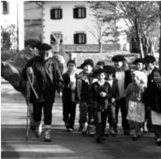
Haurrekin egoteko eskolara egingo die bisita Olentzerok, Altzon. HITZA