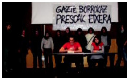
Gazteek eman zuten prentsaurrekoaren une bat. I. URKIZU

«Gazte indarrez, presoak etxera ekarri arte», ez dutela deskantsurik hartuko diote, eta dei egin dute mobilizazioetan parte hartzeko ◊ 3