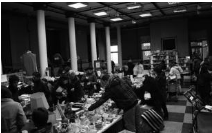
Hamaseigarrenez antolatuko du aurten Laskorain ikastolak, Merkatu Txikia. HITZA