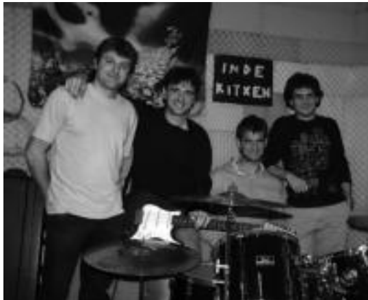
Inde Kitxen taldearen agur kontzertua izango da gaur, Bonberenean. EZEZEA