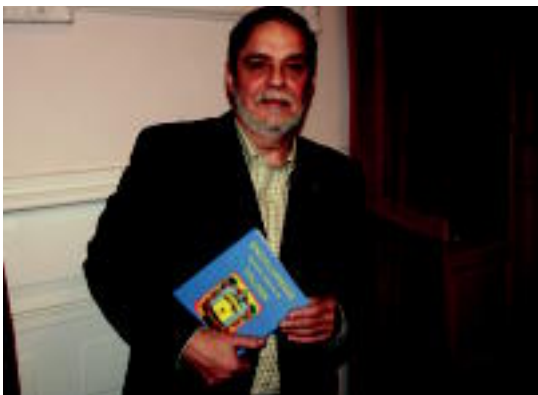
Herenegun aurkeztu zuen Telleriak, bere azken argitalpena. I. GARCIA

Mikel Gotzon Telleriak idatzi du 'Enciclopedia General Básica de Tolosa'; hainbat bitxikeria bildu ditu idazleak ◊4