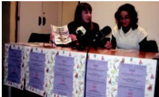
Atzo egin zuten Truke Eguneako aurkezpena, kultur etxean. A. IMAZ

10:00etan hasiko da truke azoka. Bertan parte hartu nahi duenak bere materiala eraman beharko du. Mahaiak egongo dira materiala erakusgai jartzeko. Noski, dirua ezingo da erabili, beraz, zerbait eskuratu nahi duenak,