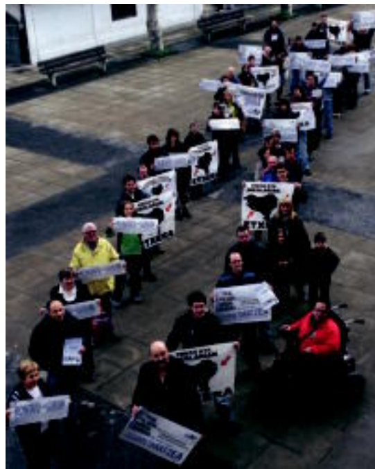
Eragile eta norbanakoak elkartu ziren babesa adierazteko. HITZA