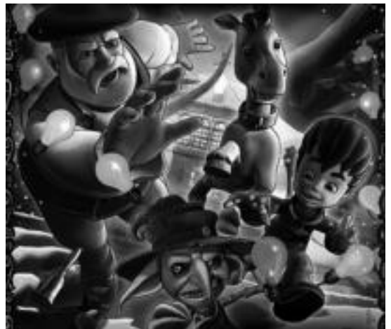
Olentzero eta Iratxoen Jauntxo filmeko irudi bat.

Pertsonaia berria, Iratxo, gaiztoetan gaiztoena da, eta Olentzerorekin batera hainbat istorio eta abentura biziko ditu, haurrei esfortzuaren, erantzukizunaren, adiskidetasunaren eta itxaropenaren inguruan hausnartzeko aukera zabalduz.