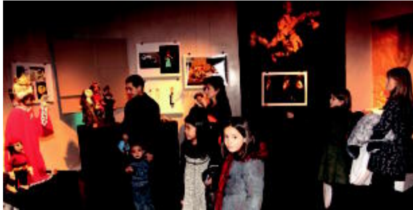
Suitzar txotxongiloen erakusketan egin dituzten bisita gidatuetakoa bat. HITZA

Azaroaren 26ean hasi, eta abenduaren 4ean amaitu zen 29. Nazioarteko Txotxongilo Jaialdia. 21 konpainiak parte hartu dute, eta 84 saio izan dira. Krisia dela eta, inoiz baino gutxiago izan dira. Hala ere, «ikuskizunak, ezberdinek eta kalitate handikoak izan