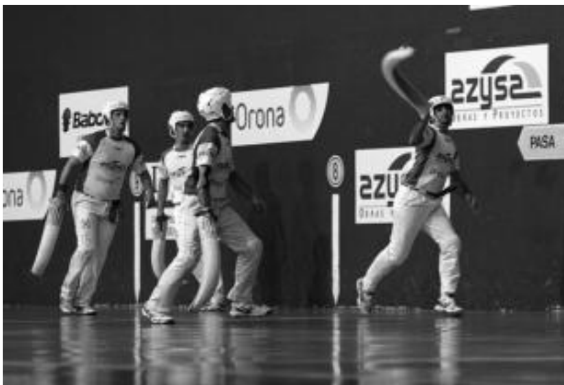
Zeberio II.ak eta Ionek Matxin III.a eta Urrutiaren aurka jokaturako finalaurrekoaren une bat. EUSKAL JAI BERRI