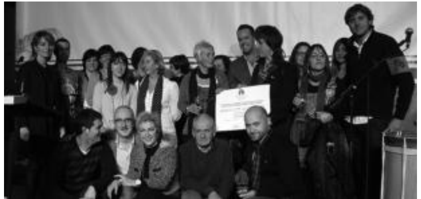
Sarituek udal eta merkatarien ordezkarekin batera Gipuzkoako Merkataritza Ganberan. HITZA

Hala ere, ez dute esperantzirik gaituzten, merkatari eta ostalari txikiak ohituta daudelako zerumugan laino beltzak ikusten.