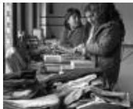
lazko azokako irudia. EZEIZA

Abenduaren 16, 17 eta 18an jarriko dute bildutako materiala salgai. Jasotzen duten dirua Etiopiar Wukro herrira bidaliko dute, urtero bezala.