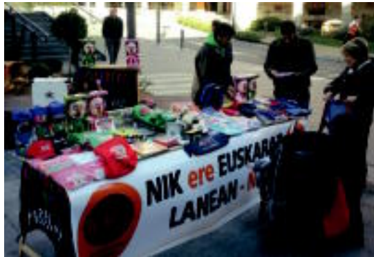
'Salmenta euskaraz' lantaldearen postua. HITZA

Banaiz Bagara Elkarateak, bezaz, hainbat eragileren laguntza izan du, NEL proiektuaren barruan kokatzen den Salmenta euskaraz ekimena aurrera ateratzeko. Postuan egongo den lantaldea, aldiz, sei euskara ikasle eta lau monitore euskaldunek osatuko dute.