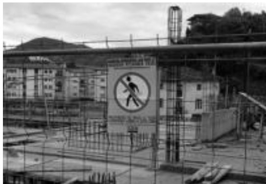
LABek kartelak itsatsi ditu obretan. HITZA

Ekintza honekin, herrialdeko hitzarmena betetzen ez dela eta patronalak, Adegik, hitzarmena «bahiturik eta blokeo egoeran» duela salatu nahi izan dute. Era berean, salaketa konkretu bat egin nahi duen langileari bidea erraztu nahi diete, eurekin harremanetan jartzeko bidea eskainiz,