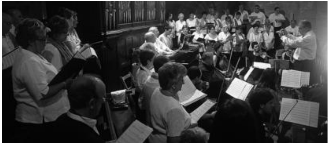
Gaur egun, 90 kidek osatzen dute Santa Maria parrokiako musika kaperak.