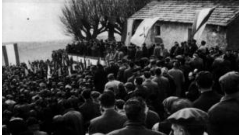
ETAk Izaskungo ermitatik bandera frankistak kendu ondoren, frankistek desagrabio ekitaldia antolatu zuten.