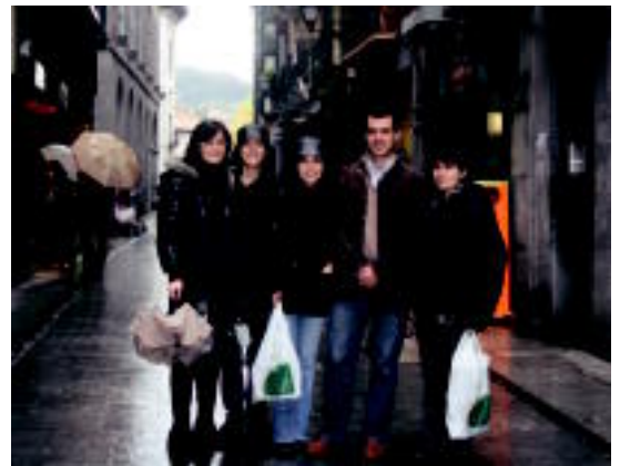
Zenbait turista, atzo, Tolosako kaleetan. M. UGARTEMENDIA

Tolosako Txuleta Festa da zubian arrakasta gehien izaten ari dena; hori baliatuz, hainbat merkatarik dendak ireki zituzten atzo 4-5