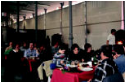
Atzoko Txuleta Festako bazkarian 200 lagun inguru izan ziren; datozen egunetan ere jende asko espero dute.

Aurtengo zubia oso luzea da, eta jendearen gehiengoak aste osoan jai egin beharrenean, «jategun solteko» hartu dituzte Tolosaldea Tour-ekoen arabera. Hala ere, turismo bulegoek «aurrera urtebetako dituzak behar izango» espero dute, nahiz eta badiotzen zenbait landaketan «erreserbak nahiko mantsu» doazela.