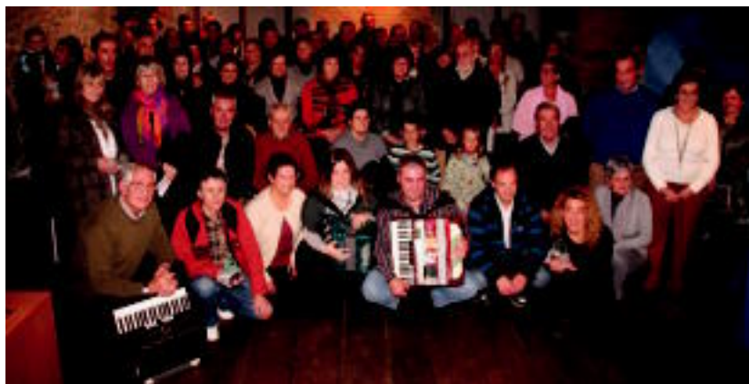
Galtzaundi euskara taldeak Tolosako udaletxearen batzar aretoan banatu zituen aipamen bereziak.