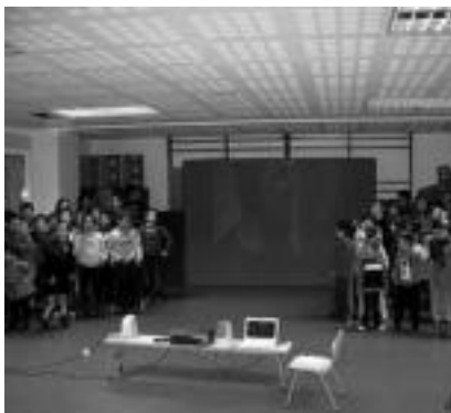
Eskolan haurrek festa egin zuten eta baita liburu trukea ere. Euskal abestiek giro-tutako afaria izan zen. E. MAIZ