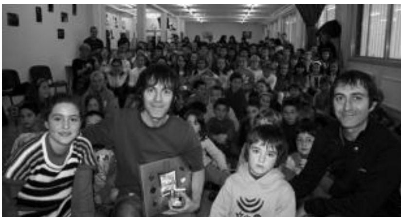
Ibarrako Uzturpe Ikastolan Ubeda anaiak izan ziren.