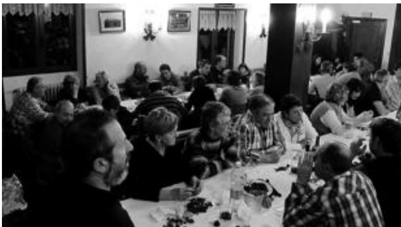
Orendainen hitzaldi-tailerraren ostean, gaztaina jatea egin zuten Eltxo elkartearen. Kantuan ere aritu ziren. HITZA