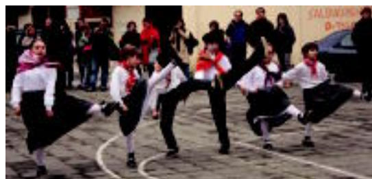
Dantzari txikiek Alegian egindako saioetako bat.

Bartzelonako Mimaia taldeak Tolosako egonaldia baliatu du lan berria sortzeko 5