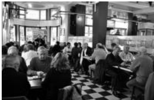
Fronton kafetegian egin zuten Mintzodromoa. HITZA