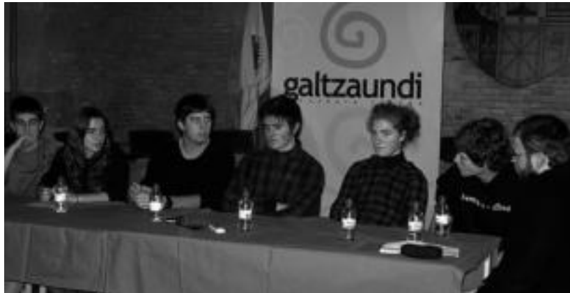
Hiru ikastetxeetako ikasleen ordezkariak euskararen inguruko mahai inguruan egin zuten. E.MAIZ

Bestetik, hiru ikastetxeetako ikasleekin mahai ingurua egin zuten. Bertan, euskararen inguruan hizketan aritu ziren: erabilpena, kultura eta proposamenak izan zituzten hizketa gai. Aurretik, ordea, eskolatan landu zituzten gaiak. Bina ordezkari izan ziren, eta euskararen erabilerari dagokionean, euskara erabiltzen dutela diote, bai eskolan eta baita etxean ere. Salbuespena familian euskaraz ez dakien bat dagoen legoke. Eskolaz kanpoko jardueretan, ordea, gaztele-