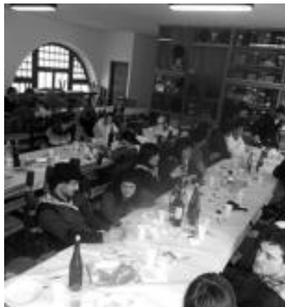
Aresoko herritarrek, talo tailerra eta bazkaria izan zituzten besteak beste. HITZA