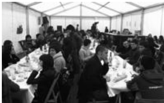
Gazteek antolatuta, larunbatean, bazkaria egin zuten. I.TERRADILLOS

raz gaizki hitz egiten duenari ez zuzentzea erabaki dute. Euskal jaien eta gaztetxearen beharra ikusi dute, eta baita bereaiek inplikatu eta gauzak sortzeko beharra ere, beti udala edo erakundeak izan gabe.