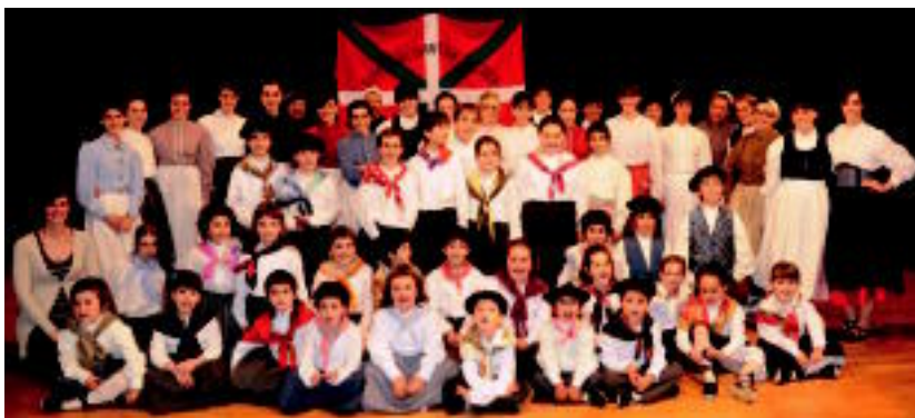
Sutarri Dantza Taldeak antolatzen du Dantzari Txiki Eguna. HITZA