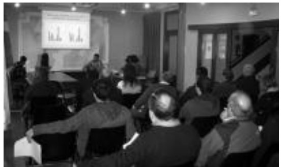
Udalak herritarrekin batzarra egin zuen azaroaren 26an. HITZA

Aurrekontu parte hartzaileen inguruko hurrengo bilera abenduaren 12an, 19:00etan, izango da. Bertan, herriko eragile eta herritar guztien ekarpen eta proposamenak eztabaidatuko dira. Ondorioz, udalak anoetar guztiak gonbidatu ditu batzar honetan parte hartzera.