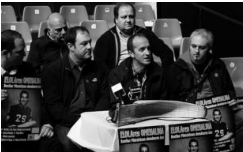
Omenaldiaren aurkezpena ere Beotibar Frontoian izan zen. I. URKIZU