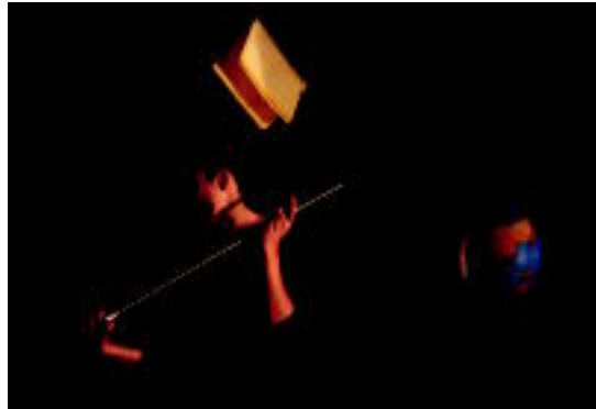
Titirijain, atzo, Sufoel taldearen No tengas miedo obraren une bat. I. GARCIA

■ Tolosa. Titirijai jaialdiaren barruan, gaur, 18:00etan, kultur etxean, Txotxongilo Taldearen Elurrezko panpina ; 18:30ean, Euskal Herria plazan, Alauda Teatrotan Puppet Circus ; 22:30ean, Topic zentroan, Os-karren Viajeros al tren . Bihar, 13:00etan, Euskal Herria plazan, Alauda Teatrotan Puppet Circus ; 17:00etan, kultur etxean, La Gaviota taldearen Pascual Patroicio y sus muñecos ; 18:30ean, Topic zentroan, Pro Rodopiren Basura por ciruelas ;