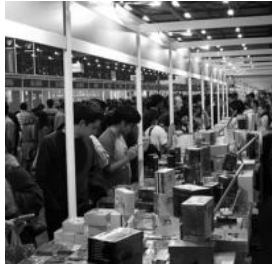
Euskaltzalez beteko da azoka etzitik datorren ostegunera bitarte.

Euskal Herria Sozialistako ki-deak Artekaleko 68an izango dira. Aldizkari aleak eta liburuak emango dituzte. James Connolly marxista irlandarraren Klase zapalduak Irlandaren historian da aurtengo argitaratu duten liburua. Horrez gain, eman dituzten hitzaldien bilduma DVDan ere jarriko dute eskura.