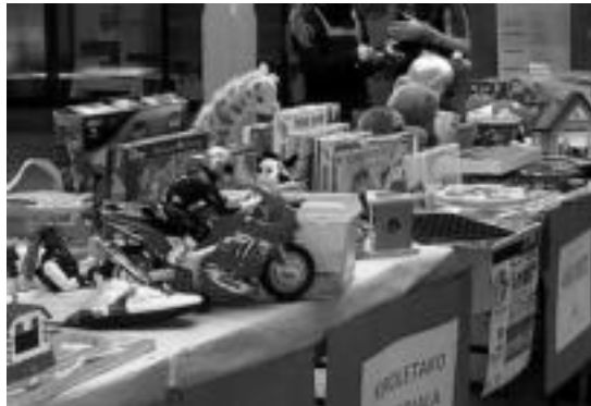
Jokoak, jostailuak eta ipuinak trukatzeko aukera egongo da. HITZA

Azokara eramane daitezkeen jostailuak honakoak izango dira, antolatzaileek azaldu dutenez: «Ezugarri eta adin guztietako