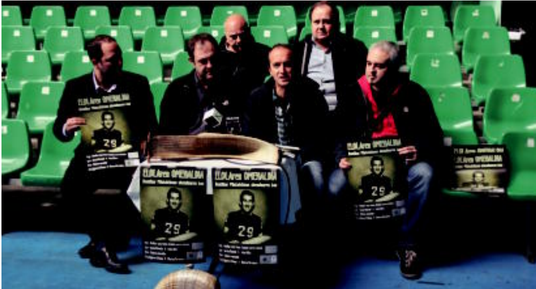
Pilota arloko erakundeekin batera, Villabona eta Tolosako udalek ere omenaldian parte hartuko dute. ITZEA URKIZU

Ostirala, 2011ko abenduaren 2a. VIII. urtea. 2.318. zenbakia. tolosaldea.hitza.info