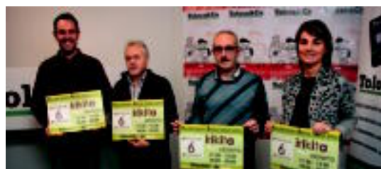
Atzo egin zuten merkatariek kanpainaren aurkezpena. I. GARCIA

Etzi hasiko da 46. Euskal Liburu eta Disko Azoka; eskualdekoen lan ugari izango dira 07