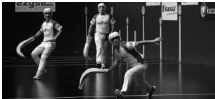
Zeberio II.a eta Ion, aurrean, eta hauei begira Urrutia. Azken honek ez zuen bere egunik onena izan. MAIALEN ANDRES

10. Liher Etxeberria (Villabona) 01:58:04