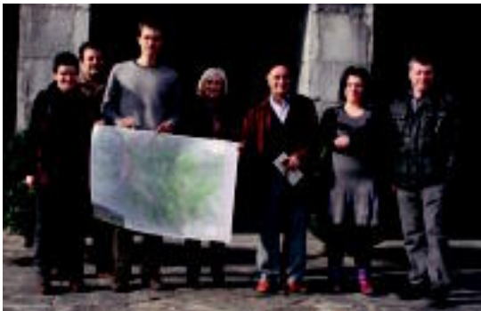
Etxeetara iritsiko da datozen egunetan, mapa toponimikoa. A. IMAZ

2009an hasi ziren Amasa-Villabonako garai bateko leku izenak berreskuratzeko lanean 02