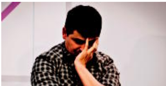
Irazu Tolosako saioan, pentsakor. GPUNTUA

Herenegun lortu zuen txartela Tolosan, Usabalen, izandako saioan; kiroldegia lepo bete zen