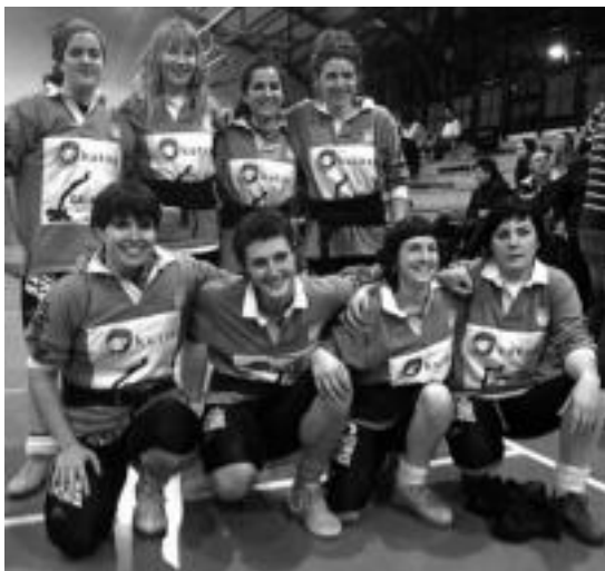
Ibarrako nesken bi taldeak, tiraldien amaieran.