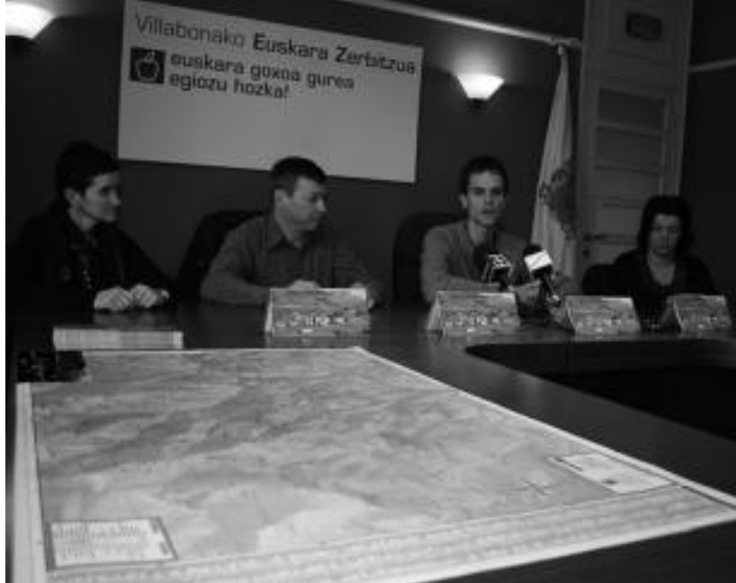
Villabonako Udala atzo hasi zen mapa toponimikoa herritarren artean banatzen.

Mapa toponimikoa osatzearen helburu nagusia, «herriko izen hauen erabilera sustatzea» da Azkueren hitzetan. Horrela belau-