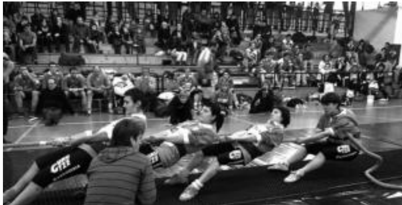
Belabieta kiroldegian jende ugari elkartu zen etxeko lau taldeak ikusteko asmoz. A. IMAZ

Mutiletan bi multzo egin zituzten, guztira 14 talde aritu baitziren lehian. A multzoan, Ibarra A zegoen, eta B multzoan Ibarra B. Ibarra A bi faboritoen atzetik gelditu zen, hau da, hirugarren pos-