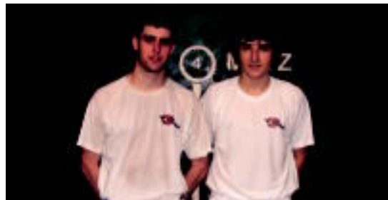
Esnaolak eta Urretabizkaia jokatu dute nagusien finala.

Bihar arratsaldean, Tolosako, Bidegoianeko eta Alzoko frontoietan izango dira partidak.