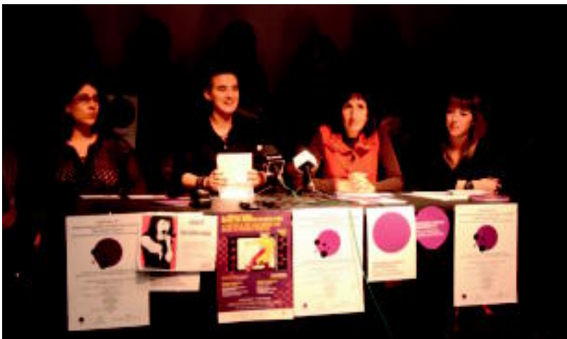
Tolosako Berdintasun sailak eta herriko hainbat emakume artistek beren ekimena aurkeztu zuten. I. LURKIZU

Tolosako Udaleko Berdintasun sailak Musika Eskolaren atzeko tren geltokia argiztatu eta margotuko dute, «kalea eta gaua» emakumeena ere badela aldarrikatzeko 2-3