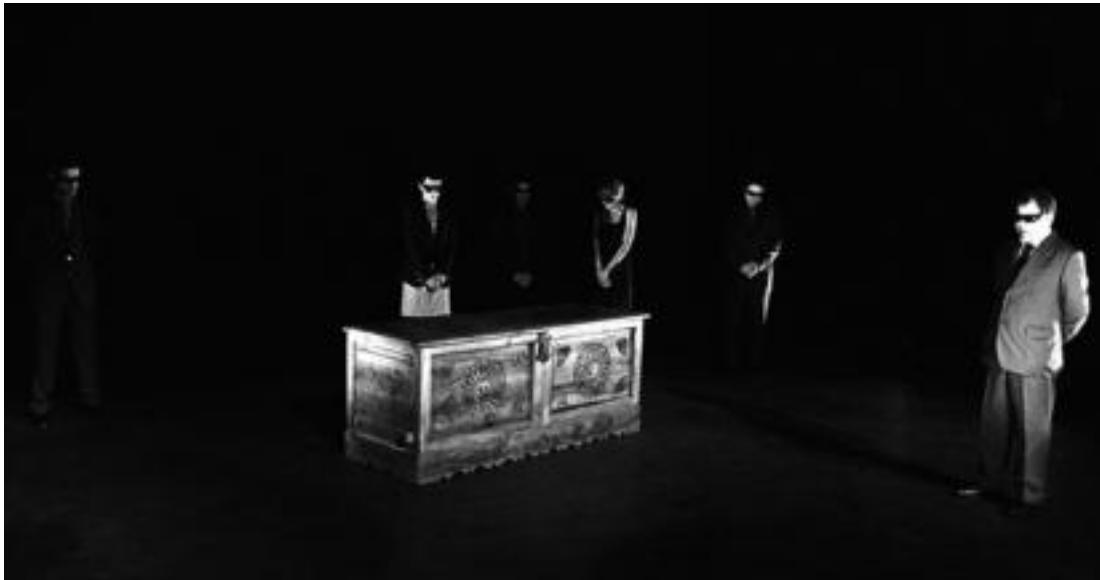
'Errautsak' antzezlaneko une bat: Hodeiren hilxutxaren ondoan bere lagunak. WWW.ERRAUTSAK.COM

Villabonako Gurea antzokian, gaur, 'Errautsak' antzezlan ikusteko aukera egongo da 22:30ean; urtebeteko ibilbidearen ondoren, azkenaurreko emanaldia gure eskualdean eskainiko dute.