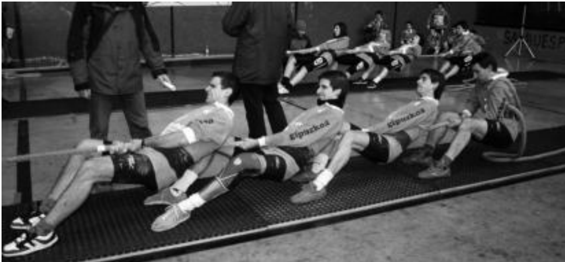
Euskal Herriko Txapelketako saio batean, mutilen taldea, iragan urteko abenduan. ASIERIMAZ

Ibarrako sokatira taldeko neskek eta mutilek bihar ekingo diote Euskal Herriko Goma Gaineko Sokatira Txapelketari; etxean izango da lehen jardunaldia, 17:00etatik aurrera, Belabietan.