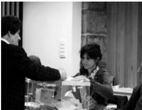
Amezketan herritar bat bere bozka ematen. AMETS ZABALA