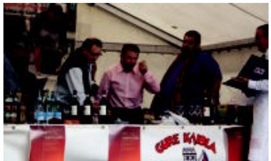
Larunbateko Babarrun Ekoizleen irabazleak eta epai mahaiko kideak, eta hereneguneko Lehiaketa Gastronomikoko irudi bat. R. CALVO-A. ZABALA

baita 1999. urtean ere. 2002. urtean hirugarren izan zen, eta 2005ean eta 2008an, bigarren. Irabazleak esandakoaren arabera, hala ere, ez du inongo sekreturik: «Ondo zaintzea, besterik ez, ez dago sekreturik. Mimatu eta lan egin, horixe. Aurtengo uzta hobea izan dela esan behar dut».