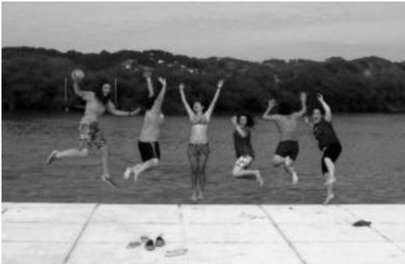
Uda honetan Gazte Topagunekoak Txingudiko badiara joan ziren. HITZA