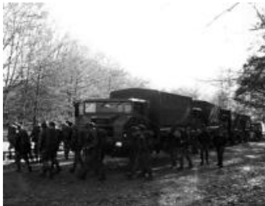
Soldaduak kamioietatik irteten, pasa den astean.

ren, baina uste dugu egun bakarreko kontua izan zela».