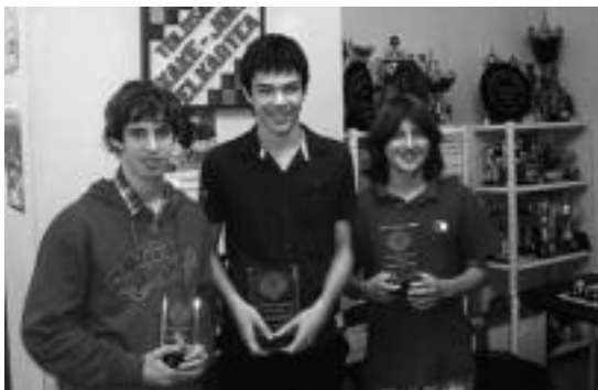
Irudian, txapelketako lehen hiru sailkatuak. HITZA

Xake azkar erara jokatu dute, bost minutuko partidekin. Jokatu nahi duenak Urdiña Txiki elkartean bertan eman beharko du izena, txapelketa hasi baino hamabost minutu lehenago. Txapelketa, 10:00etan hasiko da.