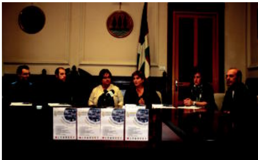
Alegiako udaleko eta musika eskoletako ordezkariak prentsaurreko batean aurkeztu zuten jaiak. M. UGARTEMENDIA

Hitzaldira joaten diren gurasoek, umeak ondoko gelan uzteko aukera izango dute; hauek DBH-ko ikasleek zainduko dituzte. Zerbitzu hau jaso nahi dutenek, guraso guztiei banatutako oharra bete eta eskolara bidali beharko dute.