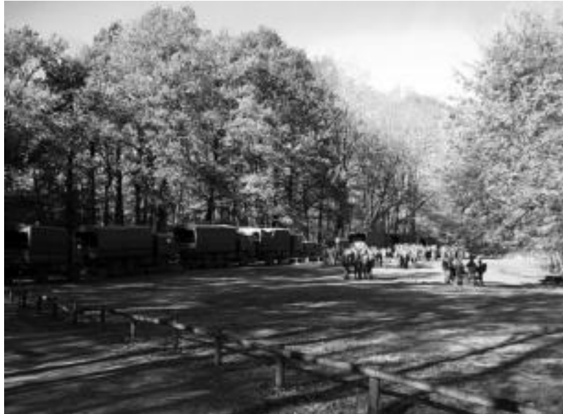
50 soldadu inguru elkartu ziren Leitzalarreko Ixkibarko zonaldean. HITZA

Maniobra hauen iraupenez ez du daturik Leitzako alkateak: «Herritar hauek pasa den asteko asteazkenean ikusi zituzten militarrek, eta gu egun horretan bertan joan ginen, beraz, ez dakigu egun gehiagotan ere aritu ote zi-