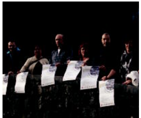
Alegian egin zuten jaiaren aurkezpena, atzo. M. UGARTEMENDIA

Seiehun bat ikasle bilduko dira Alegian; jaiaren aurkezpena 11:30ean izango bada ere, lehenago ere izango dira ekitaldiak, piano gunea, kasu ◦5