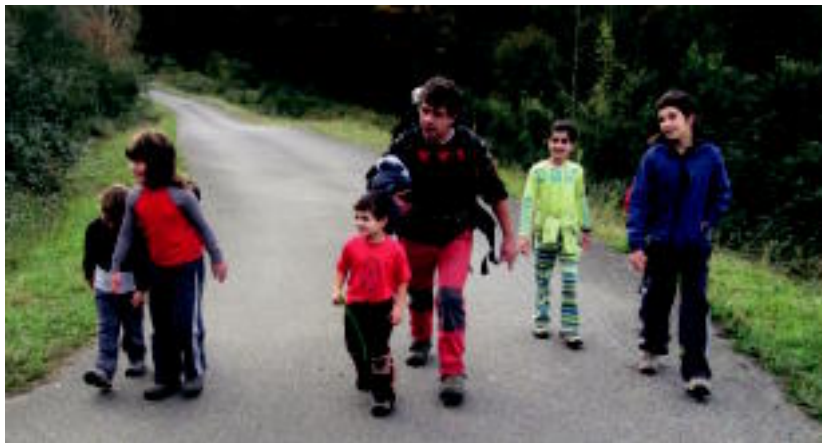
Asteasun, azken urteetan bezala, adin guztietako herritarrentzat prestatu dute Mendi Astea ibilaldia.

Aizkardiko kideek, Sagainekoek bezala, Mendi Astea egitaraua osatzerako garaian, udalaren laguntza izan dute.