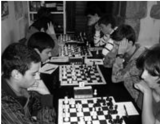
Gipuzkoa osoko jokalariek parte hartu zuten. HITZA