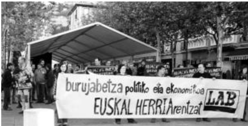
Agerraldiaren ondoren, elkarretaratzea egin zuten Trianguloa plazan. I. URKIZU