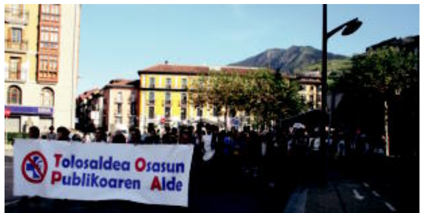
Ehunka lagun elkartu ziren manifestazioan larunbatean, Tolosako kaleetan. A. IMAZ

Larunbateko mobilizazioari amaiera emateko, herritarrek mobilizatzen jarraitu behar dutela aldarrikatu zuten osasun publikoaren aldeko plataformatik.