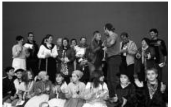
13:00ean sari banaketa izan zen. M. UGARTEMENDIA