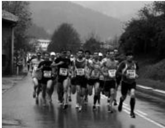
Larunbat arratsaldeko herri kroseko une bat.