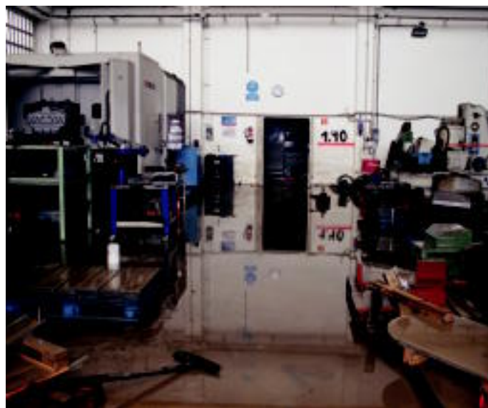
Zizurkilen izan zituzten arazoak ikusi daitezke lehen irudian, eta beste argazkian, Tolosako Usabal inguruan dagoen enpresa batetara ere atzo, ura sartu zela ikusi daiteke. A. ETXANIZ-AJMAZ