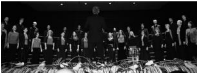
Goian, KUP abesbatza euskalduna. Beheran, Svenska Kammarkören abesbatza irabazlea. I. URKIZU