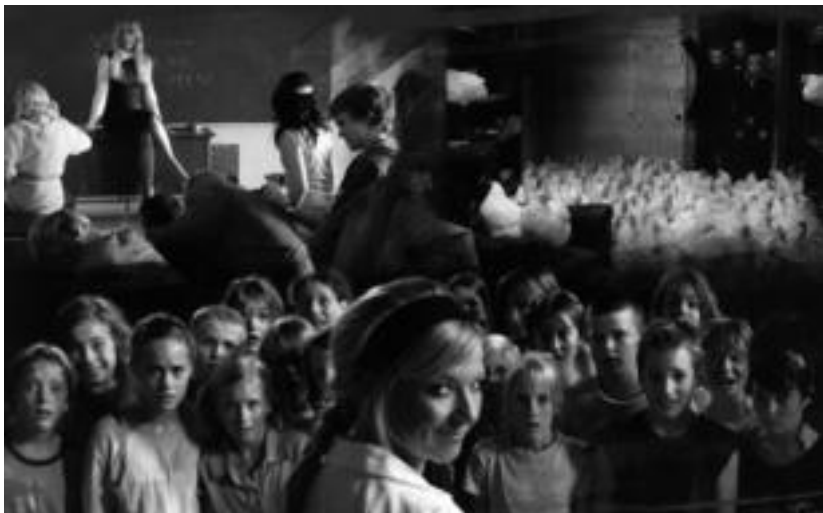
'Ordezko andereñoa' igandean ikusi ahal izango da Leidorren. HITZA