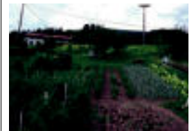
Lehiaketarako baratze bat. HITZA

■ Goizean. Azoka Eguna. Herriko produktuak eskuragai: barazki, gazta, ezti, eskulanak... ■ 13:00. Gazta Lehiaketa, Ahari, Ardi eta Bildots Lehiaketa, Postu Lehiaketa, Argazki Lehiaketa, eta Baratze Lehiaketako sari-banaketa. ■ 18:00. Talo jatea, goizean lehiaketan parte hartutako gaztak dastatuz, ardo eta sagardoren laguntzarekin.