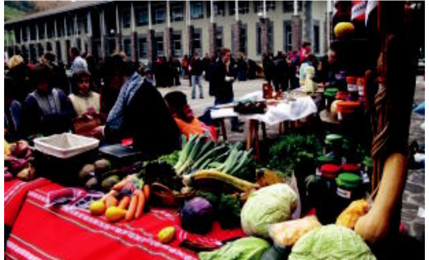
Azaroaren 13an izango da urte honetako Azoka Eguna. Urtero bezala, izango da zer ikusia Berastegin. ILL

Udalak herritar oro animatzen du kultur ekitaldien aitzakian herritarrek elkartzera.