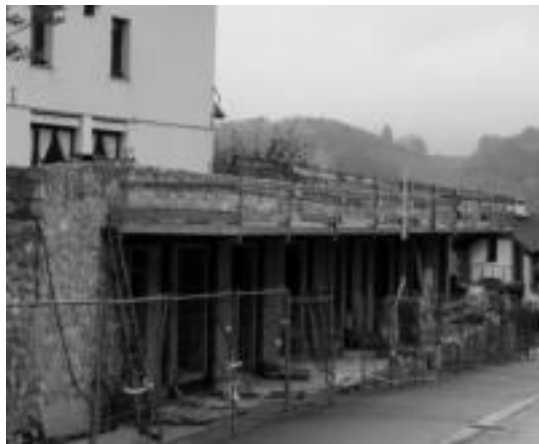
Goiko zatian plaza txiki bat eta haur parkea jarriko dituzte. E. MAIZ

osoa ez da herritarren erabilerrarako izango, eta bi bulego prestatu dituzte alokairuan jartzeko. Lokal beharreen dagoen edonork, alokairuan hartzeko aukera izango du. Alkateak argitu duenez, honela, udalarentzat diru iturria izango da. Eta eraikinaren errentagarritasuna ahalbideratuko du. Tolosaldea Garatzen bidez, maizterrak aurkitzen ahaleginduko direla adierazi du.