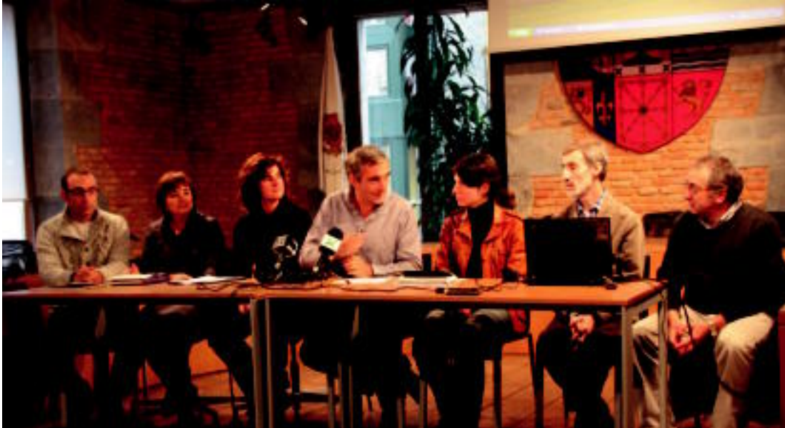
Laskorain ikastolako, Berritzeguneko, Tolosako Udaleko eta Orixe institutuko ordezkariak, egindako agerraldian. L. URKIZU