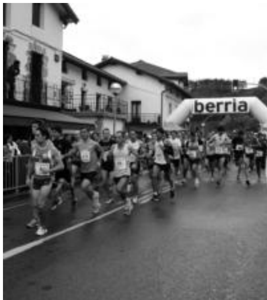
Iaz, lasterkariak irteeran. E. MAIZ

Pintxoak parte hartzaileentzat Ezaguna den moduan, Ikaztegiako Herrigintza elkarteak, lasterketan parte hartzen duten guztiarentzat pintxoak eta edatekoa prestatzen ditu. Nahiz eta eguna eta ordutegia aldatu, mantendu egingo dute elkarteak kideek ohi-