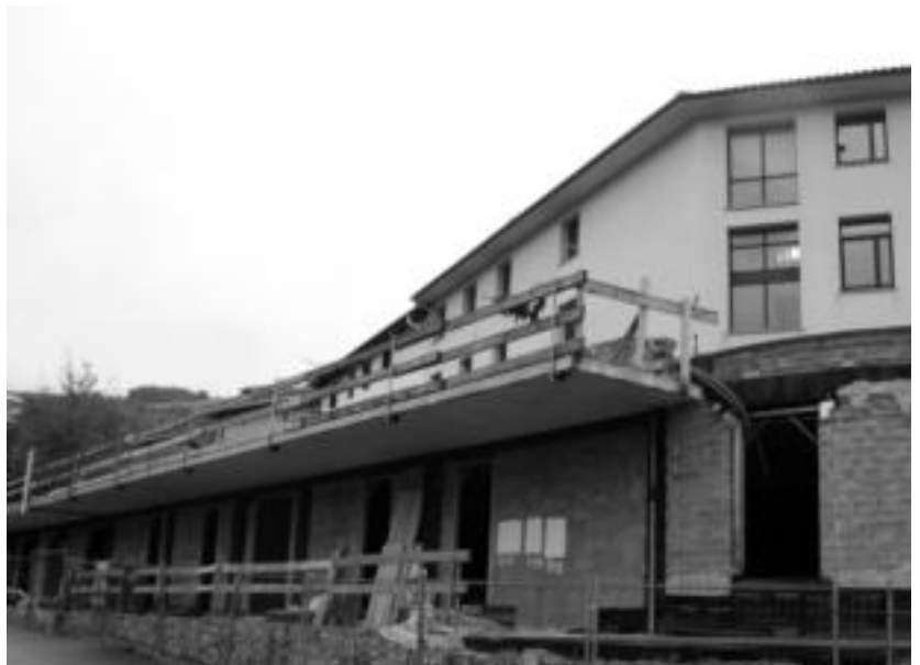
Udaletxearen atzeko lur zatia kendu dute, erabilera ezberdinetarako izango diren gelak egiteko. E. MAIZ

Eraikina egiteko prestatu duten eremua zabala da, eta honez gain, bi gela alokairuan jartzeko izango dira. Beraz, eraikuntza