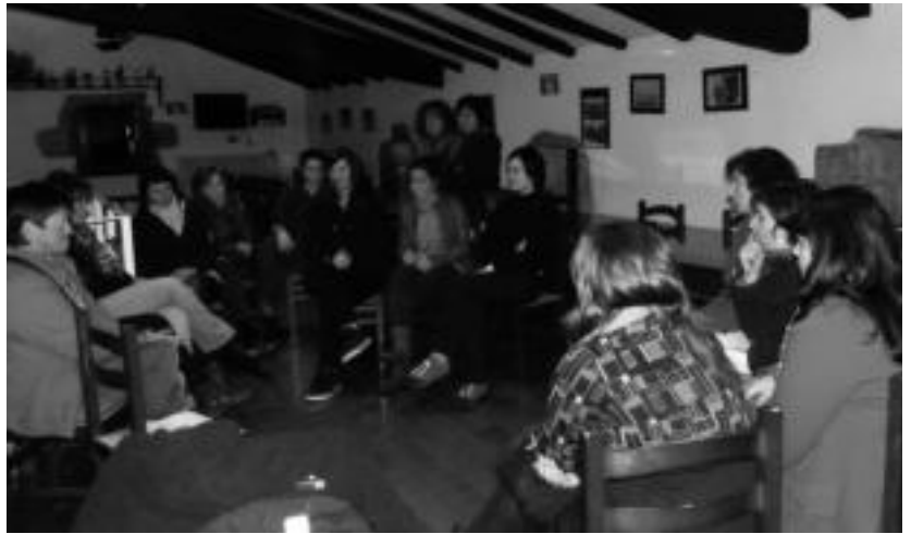
Pasa den ostiralean egin zuten herri batzarra emakumeen kontratazioen inguruan hitz egiteko. HITZA

POLITIKA | Ezker abertzaleak batzarra deitu ditu gaurko, Alegian eta Tolosan. Egungo egoera politikoaz eta azaroaren 20ko hauteskundeez eztabaiatuko dute. Tolosako batzarri dagokionean, kultur etxean izango da, 20:00etan hasita. Alegiakoa, berriz, 19:00etan hasiko da, eta udaletxean izango da. Ezker abertzaleak herritar guztiak animatzen ditu batzarretan parte hartzea, izan ere, beraiek dioten bezala, «bizi dugun momentu politikoak hala eskatzen du, duen garrantziagatik».