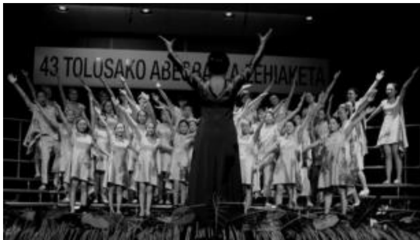
Txinako Guangzhou Children's Palace Choir-ek irabazi du Haur Abesbatzako lehen saria. A. IMAZ

Ukrainiako Orey Chamber Choir izan da 43. Abesbatza Lehiaketako talde izarra. Guztira lau sari irabazi dituzte ukrainarrek, baina oraindik ezin izango dituzte etxera eraman kopa eta txapela guztiak, Tolosan jarraitzeko asmoa baitute. Sari Nagusia, Ikuslearen Saria eta Ahots Nahastuetako bi sariak jaso dituen abesbatza ikusi nahi duenak, hilaren 3an, bihar aukera paregabea edukiko du Tolosako Santa Klara elizan. 19:30ean hasiko den kontzertuan, Ukrainako taldeko ahots eder eta landuek, musika ortodoxoa zer den erakutsiko dute. Kiniela gehienetan Oreya abesbatza nagusi zenez, atzoko sari banaketa ekitaldian, ikusleek txalo zaparradak eskaini zizkien. Ukrainiarrek euren aldetik, agur abestiak edertasunez kantatu zituzten.