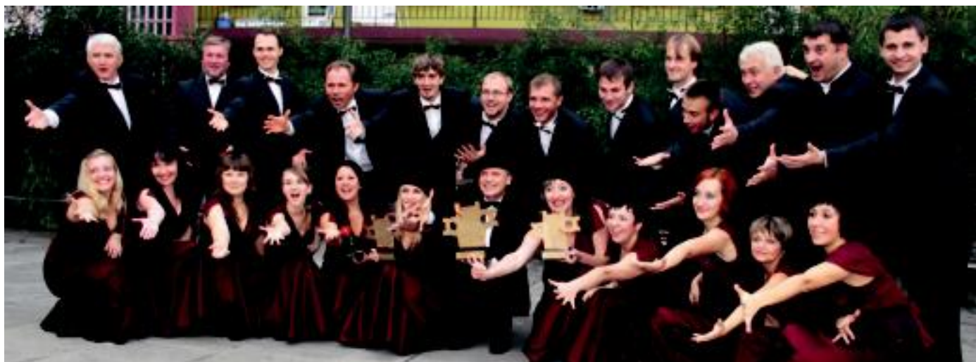
Ukrainako abesbatza oso gustura azaldu zen atzo goizean, sari banaketa ekitaldian. Irabazleek bihar bertan beste emanaldi bat eskainiko dute Santa Klara elizan, 19:30etik aurrera. A. IMAZ

Euskal Herriko ordezkari bakarra, Errenteriako Landarbaso abesbatza, ahots nahasien polifonia saileko hirugarren saria eskuratu du Tolosako txapelketan o2-3