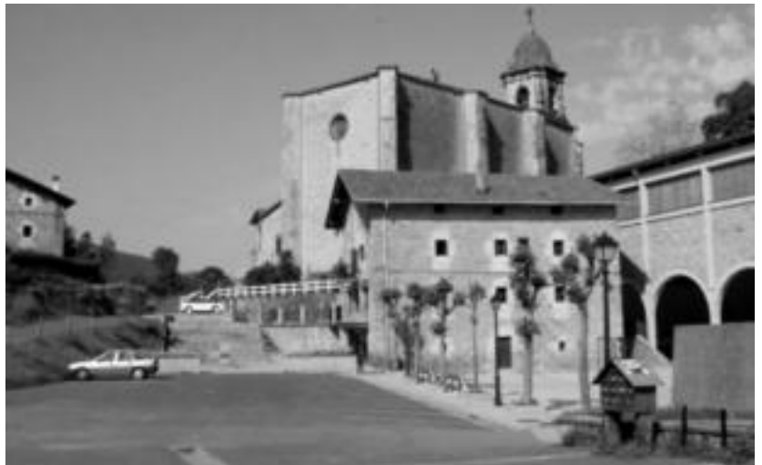
Gazteluko plazaren ondoan eraikiko dituzte sei etxebizitzak. HITZA

Eskaera orriarekin eta baldintzak egiaztatzeko dokumentazioarekin batera, aurkeztu beharreko guztia udaletxeko idazkariak zehaztuko du.