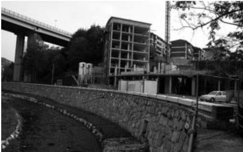
2010eko urrian zozketatu zituzten Igarondoko babes ofizialeko etxebizitzak. A. IMAZ