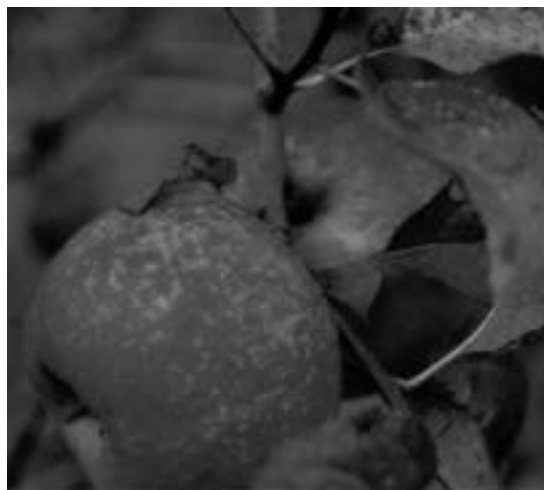
Aurtengo Argazki Rallyan parte hartu duen argazkietako bat. HITZA

Antolatzaileak «oso gustura» azaldu dira rallyak beste behin izan duen parte hartzearekin; «beste urteetako kopurua errepi-