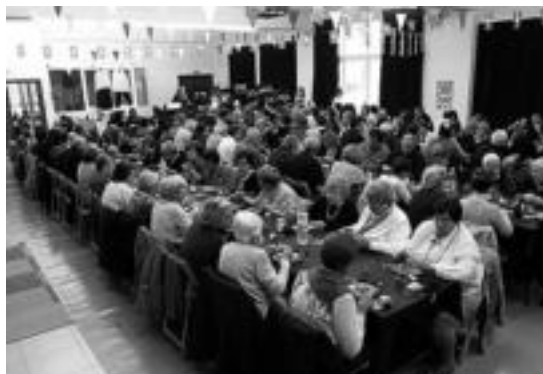
Iazko Txintxarri Eguneko bazkarian jende asko elkartu zen.

Iazko urtea berezia izan zen abesbatzarentzat, ekitaldietan herritarren parte hartzea sekula baino handiagoa izan baitzen. Aurten ere ipiritu horri eutsi