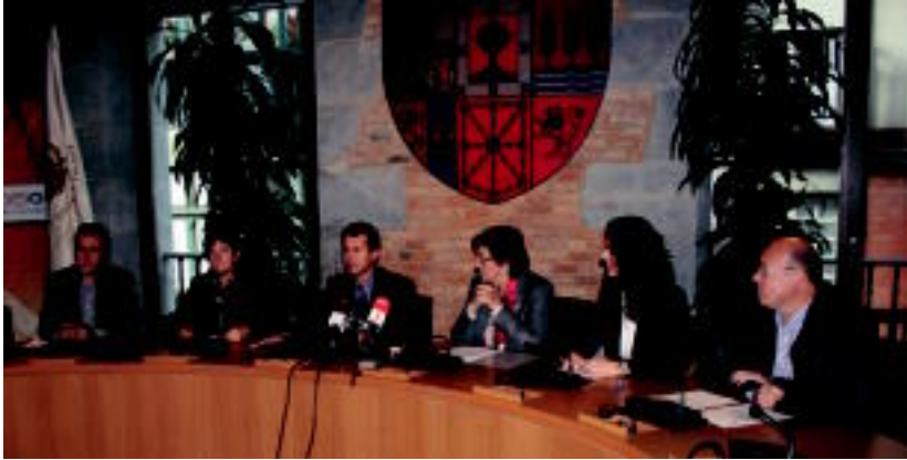
Duela urte bete sinatu zuten hitzarmena. I. TERRADILLOS