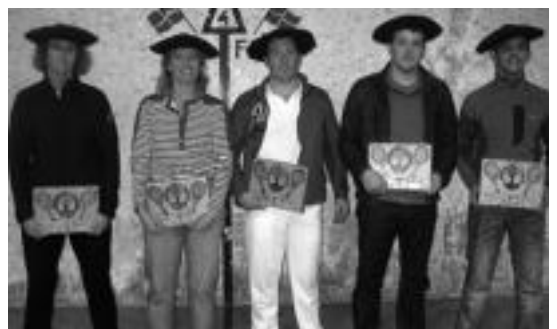
Pasa den urteko txapelketako irabazleak. HITZA

Irabazlearen izena jakiteko, baina, azaroaren 13ra arte itxarotzen beharko da. Epaimahaiak Azoka Berezia egiteko den egunean emango du argazki ederrenaren egilearen izenaren berri.