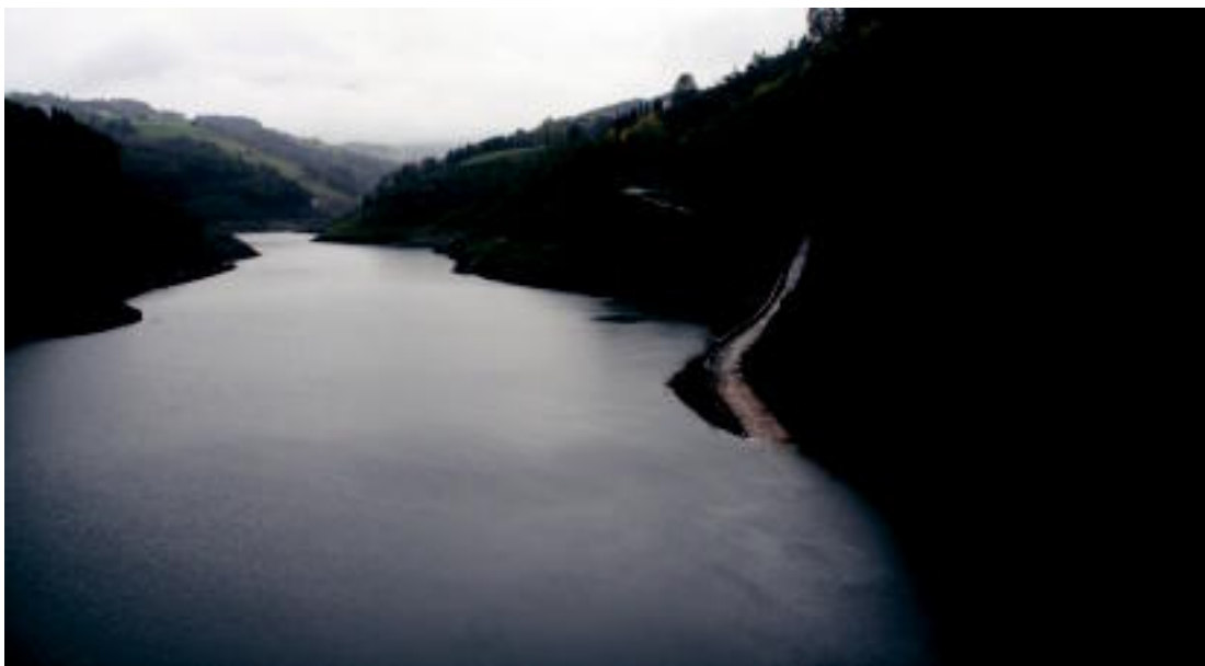
Atzo itxura hau zuen Ibiurko urtegiak; euria egin arren herenegun baino ur gutxiago zuen. E.MAIZ

Tolosako Kasinoren Mikologia Jardunaldien barruan, hitzaldia eskainiko du gaur, 20:00etan, Idiakez jauregian; Euskal Herrian 50 barrengorri edo 'agaricus' mota bildu dituztela dio ◦2