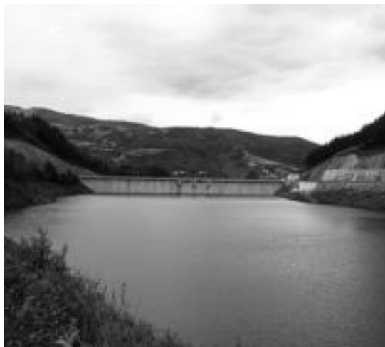
2010eko ekainaren 10ean ateratako argazkia da. E. MAIZ

Bigarren urtez, urtea lehor doala azpimarratu du, eta gainera euri gutxi egin du. Honen ondorio garbia, urtegiaren gero eta ur gutxiago dagoela da. Dagoeneko,