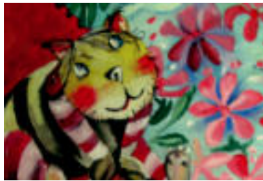
Era eta estilo guztietako koadroak marrazten ditu; erakusketan dauden guztiak olio pinturaz margotuta daude. E.MAIZ