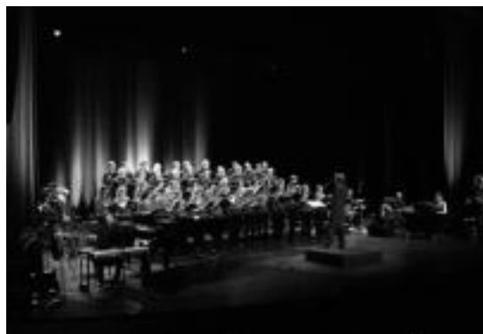
Tolosako Orfeoia Bruselan eman zuten emanaldian.

Ekitaldia amaitzeko, Lopez le- hendakariak harrera jaia eskani- zien Wolubilisen Bruselan bizi di- ren euskaldunei eta ordezkaritza- politikoei. «Oso elkartze hunkiga- rria izan zen, giro adeitsu eta her- rrikoian eta protokoloz gabe», esan dute Orfeoikoek. «Une zirra- ragarriak bizi izan ziren, inguru kuttunean, eta Orfeoikoekin ba- rera hainbat eta hainbat abesti kantatu zituzten modu jator eta espontaneoan, bildutako jendea- ren eskariz».