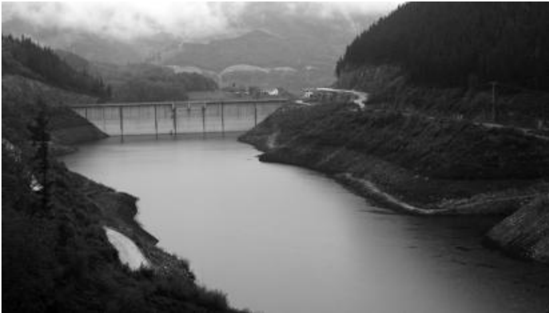
Atzo Ibiurko urtegiak zuen itxura da ikusten dena. Atzo euria egin bazuen ere, udaz geroztik ur maila asko jaitsi da.