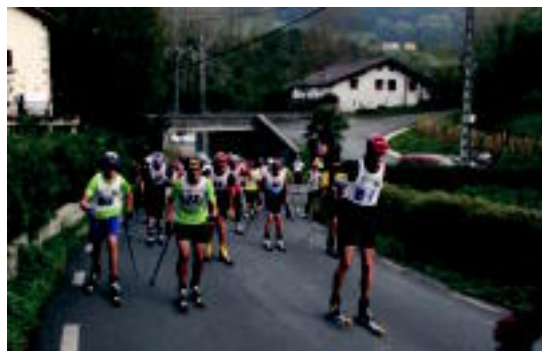
laz ere parte hartzaile ugari hartu zuten parte lasterketan. I. TERRADILLOS

Liga barruan kokatu behar da, puntuak lortu ahal dira eta, eta ondorioz, Gipuzkoa osokoak ez ezik, Nafarroa, Aragoi, Cantabria eta Madrilko partaideak espero dituzte Alpino Uzturre elkarteko kideek.