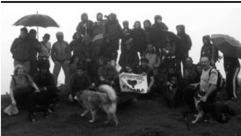
Ibarratik Gaztelura egin zuten mendi irteera apirillean. Zikiro jatea egin zuten hura amaitzean. ASIERIMAZ