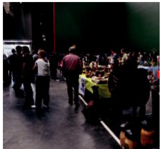
Postu asko jarri zituzten Zizurkilgo Azoka Berezian. s.gomez

Jende asko izan zen azokan egon ziren 50 postuak bisitatzen, igandean zehar; Kantu Jirakoek giroa alaitu zuten euskal abestiekin o4