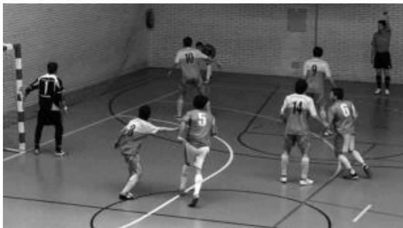
Hiru puntuak lortu ez arren «jokorik onena» erakutsi dutela diote Laskorainekoek.