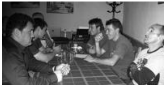
Kantabriko tabernan elkartu ziren ostiral iluntzean. R.C.

Bi harri jasotzaileak berriz elkartuko dira desafioaren baldintzak itxi, eta eguna jartzeko, baina 2012. urtean izango da hori.