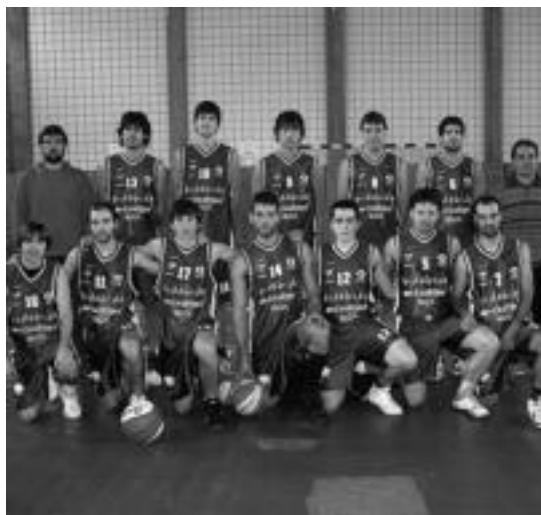
Bide Bide Ibiza taldea ligako lehen postuan dago. HITZA

Zumarraga izan zen azkena 73 plaza eta 8 zinta egin zituelarik. 608 kilo pisatu zuen taldeak.