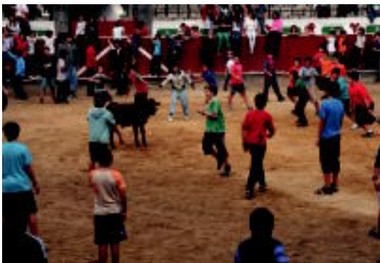
Gazte asko hurbildu ziren atzokoan zezen plazara. I. URKIZU

Babarrun jatea, toka txapelketa eta zezentxoak izan zituzten atzo, Tolosako auzoan 02