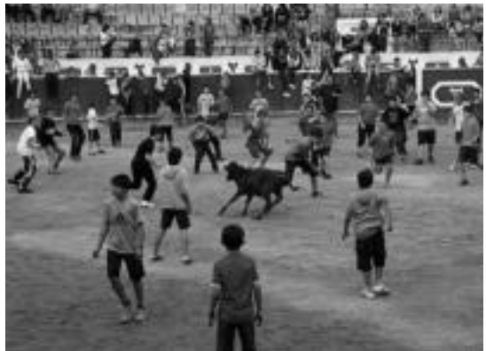
Gaztetxo asko bertaratu ziren zezentxoetara. LURKIZU