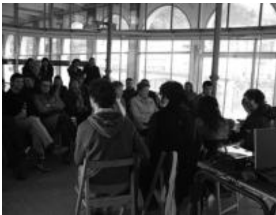
Lehen kontsumo taldea sortu zeneko bilera, Zerkausion. R. CALVO

Bileraren ondoren parte hartzeko interesa dutenek, han bertan izena emateko aukera izango dute.