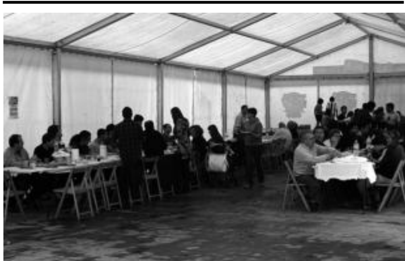
50 lagun bildu ziren babarrun jatean. LURKIZU

Tolosako Amnistiarekin Aldeko Mugimendua.