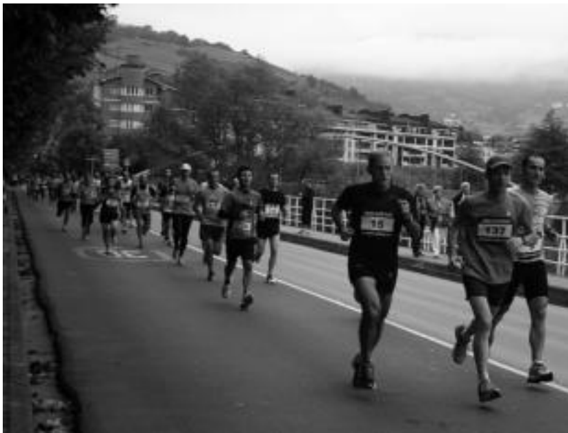
10 kilometroak egiteko eguraldi ona izan zuten parte hartzaileek. E. MAIZ