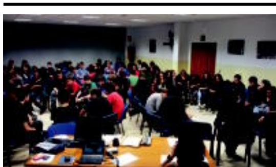
Tolosaldea Institutuan bildu ziren atzo gazteak. HITZA

HITZAK ez du bere gain hartzen egunkarian adierazitako esan-nen eta iritzien erantzukizunik.