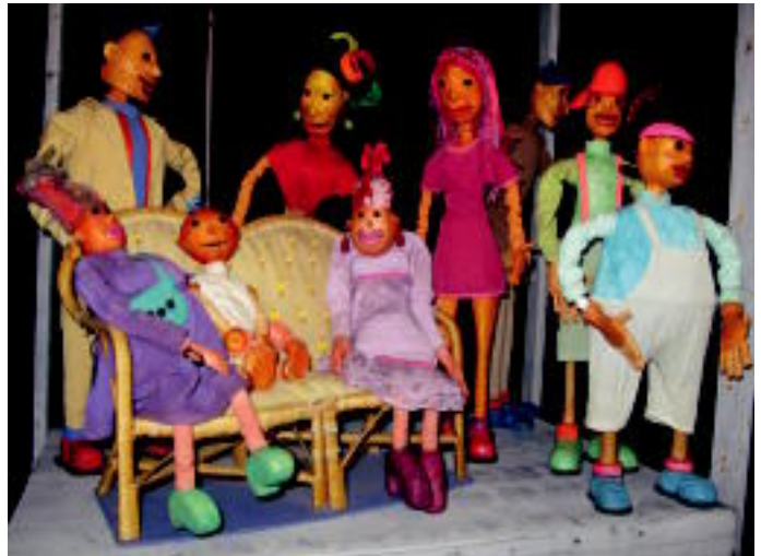
Tamaina, era, kolore,... guztietako txotxongiloak daude Topic zentroan. Inaugurazioa ofiziala 2011ko Titirijaien barruan egingo dute. E.MAIZ