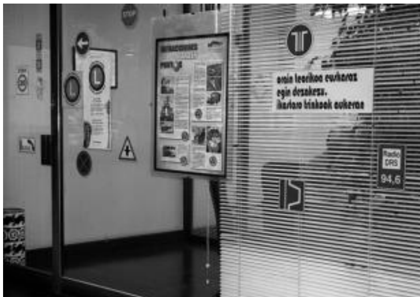
Tolosan bi autoeskoletan eskaintzen dute gidabaimena euskaraz ateratzeko aukera. I. URKIZU

KULTURA SAILAK DIRUZ LAGUNDUTAKO HEDABIDEA