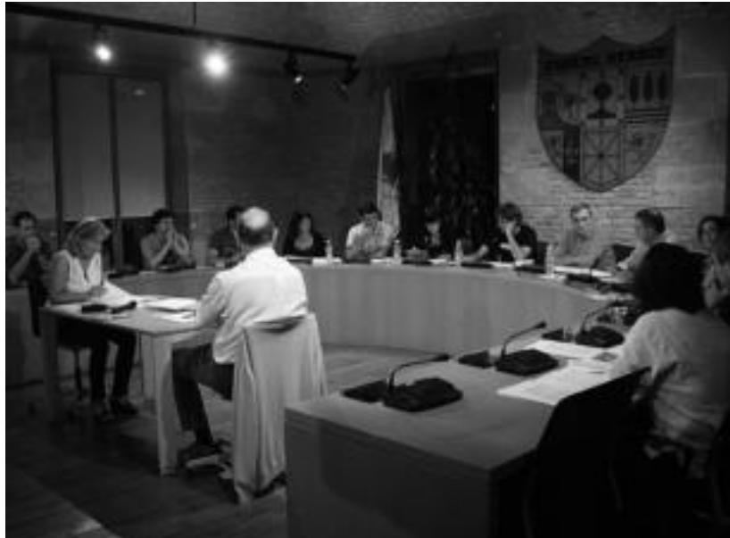
Pasa den asteartean izan zen osoko bilkura. I. URKIZU

Zaborraren kasuan, «Gipuzkoan nolako eztabaida dagoen badakigu», eta Bilduk eta Aralarrek, talde bezala, iritzi garbi bat