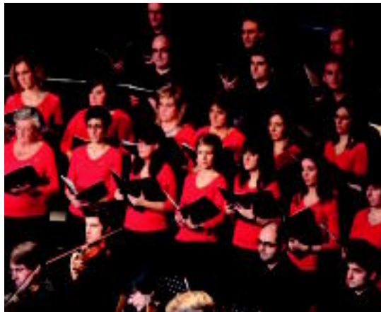
Orfeoikak Eguberrietan, Tolosako Leidorren eskainitako kontzertua.