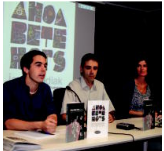
Gaztelumendi, Etxaburua eta Zabala, atzo, Mintzolan. A. IMAZ

'Ahotsa bete hots' jardunaldiak egingo dituzte Villabonako egoitzan azaroaren 2tik 4ra; gaur da izena emateko lehen eguna 3